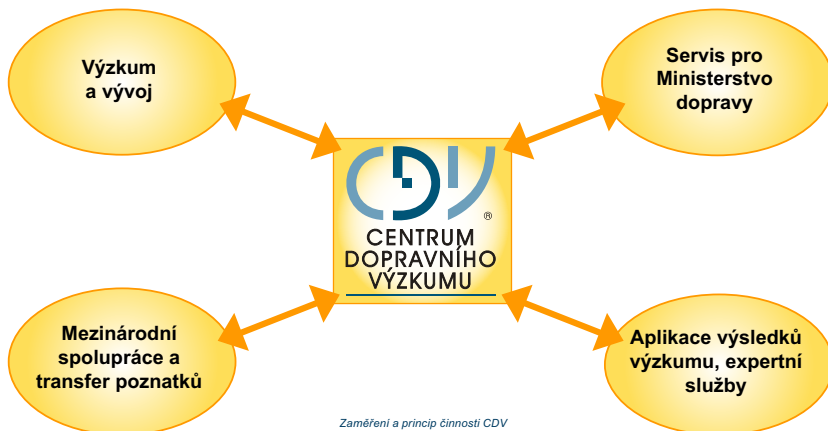
Zaměření a princip činnosti CDV