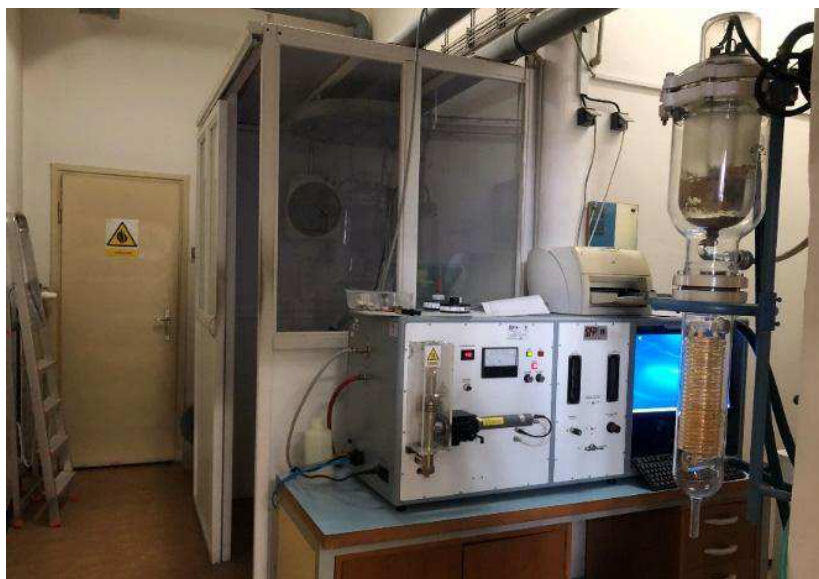
Obr. 1 Testovací komora

Testovací komora (obr. 1), ve které probíhalo měření, má dřevěnou konstrukci se skleněnými okny. Přibližné rozměry komory jsou 1,85 m x 1,15 m x 2,3 m. Do komory se vstupuje z levé strany přes posuvné dveře. Uvnitř komory se nachází běžící pás, potrubí a hlavice, kterými je přiváděn a rozprašován aerosol NaCl.