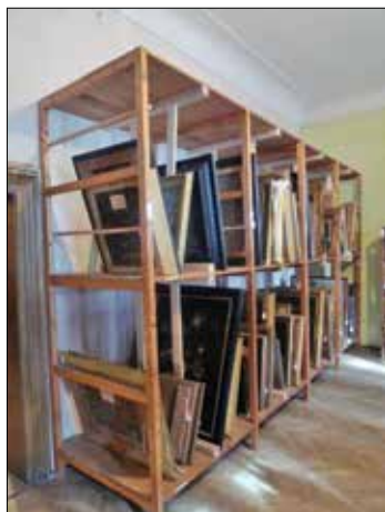
◀ Obr. 7: Regálové uložení obrazů v depozitáři památkového objektu