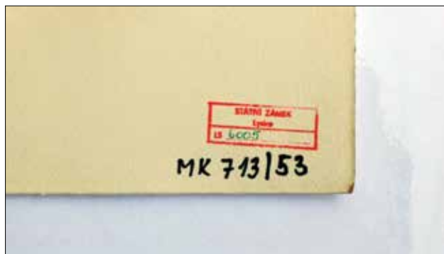
▲ Obr. 10: Příklad nevhodného označení grafiky fixem (nereverzibilní)

V současné době je vhodné v odůvodněných případech stávající označování předmětů doplnit dalšími ochrannými a evidenčními prvky jako jsou mikrotečky, mikročipy a čárové kódy (kap. 10.2.3.), pro jejichž umístění na předmětu platí výše uvedené.