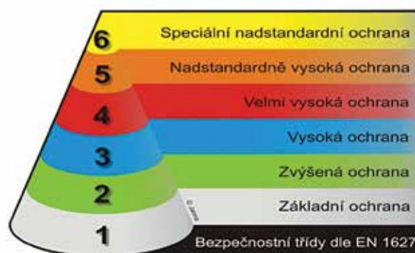
▲ Obr. 3: Bezpečnostní třídy dle EN 1627

Zvláštní pozornost si zasluhuje mechanické zabezpečení depozitářů . Jednak z důvodu obrovské koncentrace předmětů zde uložených a dále z důvodů jejich lokace – často bývají mimo budovu instituce, někdy dokonce nemají stálou ostrahu. Veškeré přístupy do depozitáře, jako jsou dveře, výtahy, schodiště, okna a ventilační stoupačky, by měly být navrženy tak, aby se vyloučila možnost vstupu neoprávněných osob a zajistilo se, aby i pracovníci běžné údržby mohli vstupovat do budovy pouze pod dohledem. Žádná část budovy, v níž jsou trvale nebo dočasně uloženy předměty, by neměla být použita jako chodba nebo nouzový východ. Mechanickou odolnost proti vnějšímu napadení určuje tzv. doba průlomové odolnosti (v minutách). Ta je dle ČSN P ENV 1627 (746001), 2012 4 rozdělena do šesti bezpečnostních tříd. Pro objekty, kde jsou uloženy předměty kulturní povahy, se doporučuje používat prvky zařazené nejméně do bezpečnostní třídy č. 4 (Obr. 3).