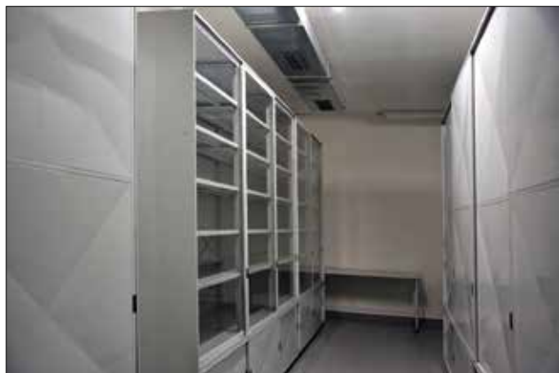
▲ Obr. 5: Skříňové regály s uzavřeným úložným prostorem