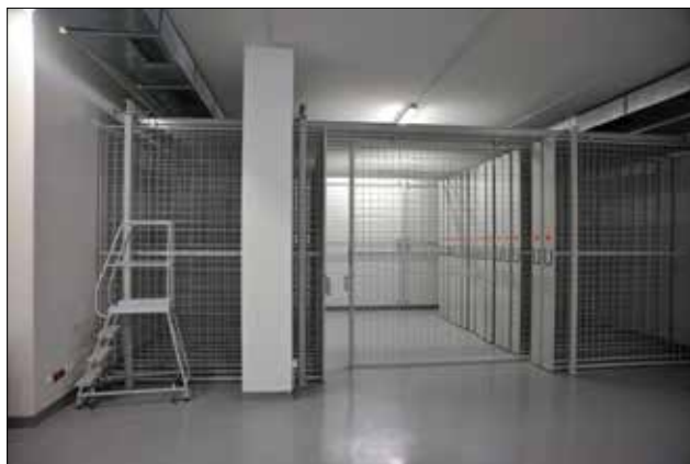
▲ Obr. 9: Výsuvné závěsné stěny pro depozitární uložení obrazů

Jedním z typů tohoto úložného systému jsou i mapové a výkresové skříně . Ty slouží k uložení plochého materiálu větších rozměrů, jako jsou právě mapy a výkresy, které by měly být uloženy rozvinuté v horizontální poloze. Z praktických důvodů, a pokud je to možné, by zásuvky neměly být zabudovány ve výšce větší než 1400 mm. Umístění komod s těmito zásuvkami je obzvláště důležité, neboť požadovaný prostor pro přístup k uloženým materiálům musí být nejméně dvakrát větší než hloubka komody plus dalších 450 mm 1 .