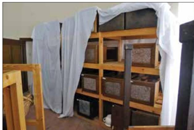
▲ Obr. 6: Regálové uložení nábytku v depozitáři památkového objektu