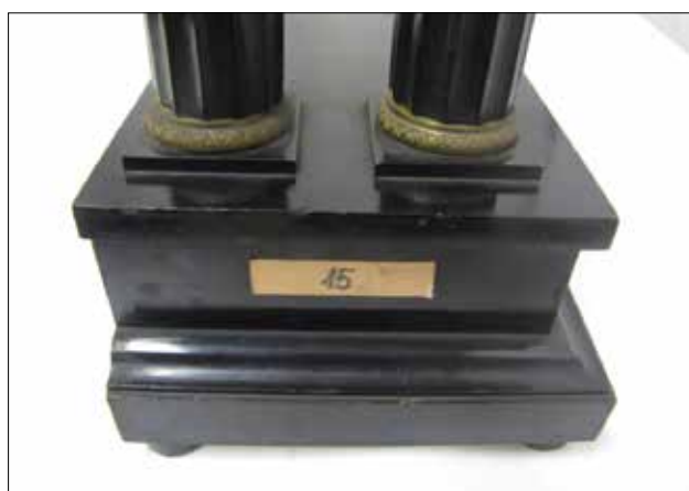
▲ Obr. 11: Příklad nevhodného označení na pohledové straně předmětu