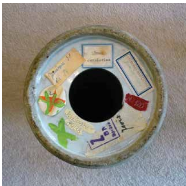
▲ Obr. 12: Nevhodné označení porcelánového předmětu s množstvím historických štítků s různorodým značením