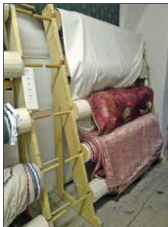
◀ Obr. 8: Ukázka uložení textilií v depozitáři památkového objektu