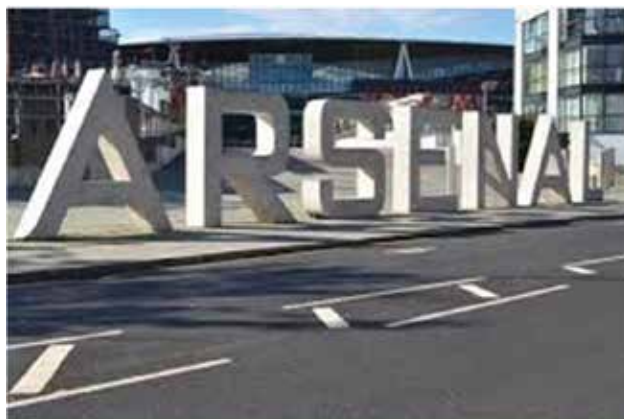
▲ Obr. 4: Fotbalový stadion a muzeum londýnského klubu Arsenal