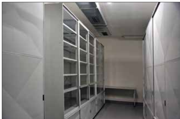
▲ Obr. 5: Skříňové regály s uzavřeným úložným prostorem