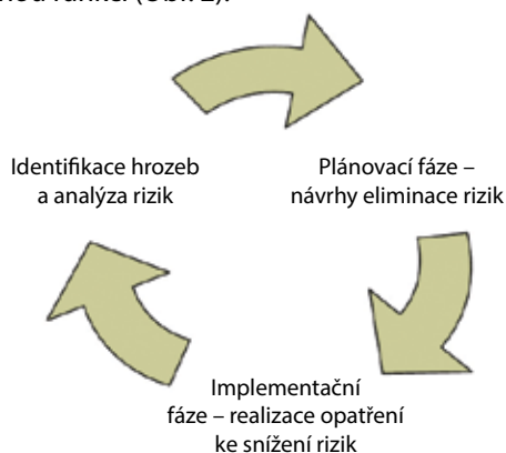
▲ Obr. 2: Dynamické pojetí bezpečnostního systému

Pochopení bezpečnostního systému jako neustále se vyvíjejícího procesu je nutnou podmínkou pro jeho správnou funkci (Obr. 2).