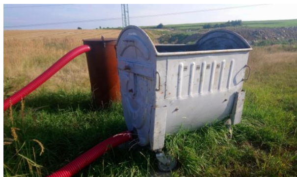
Obr. 2 Kontejnerový biofiltr Fig. 2 Container biofilter

Aktivní odplynění skládky je normou definováno jako odplynění pod tlakem, který je vyvíjen v externím zařízení (například čerpací stanice), jež je napojeno na odplyňovací systém. Aktivní systém odplynění je běžně zakončen zneškodňovacím zařízením v podobě vysokoteplotní pochodně (fléry) nebo kogenerační jednotky umožňující energetické využití plynu za současné výroby tepla a elektrické energie (viz obr. 3) [13]. Ve výjimečných případech je zneškodňovacím zařízením výše popsán biooxidační filtr.