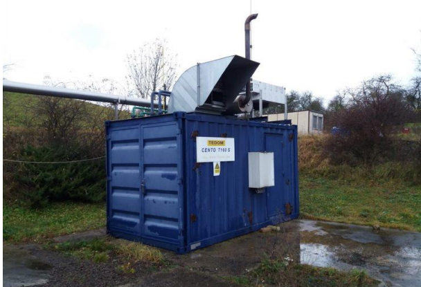
Obr. 3 Příklad řešení kogenerační jednotky na skládce