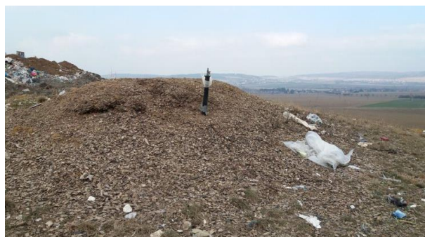
Obr. 1 Zemní biofiltr Fig. 1 Open in-ground biofilter

v biofiltračních jednotkách probíhá za pomoci mikroorganismů, které jsou přirozeně přítomné v náplni. Zásadní je přítomnost methanotrofních bakterií, které oxidují metan na oxid uhličitý a snižují tak dopady skládkového plynu na životní prostředí. Další bakterie přítomné v náplni odstraňují ze skládkového plynu další sloučeniny, jako jsou například látky obtěžující zápachem [12]. Pro správné fungování biofiltru je nutné zajištění vhodné vlhkosti náplně, avšak přílišné zvlhčení snižuje účinnost systému. Dalším faktorem ovlivňujícím účinnost biofiltru je teplota, která v běžných provozních podmínkách není nijak upravována.