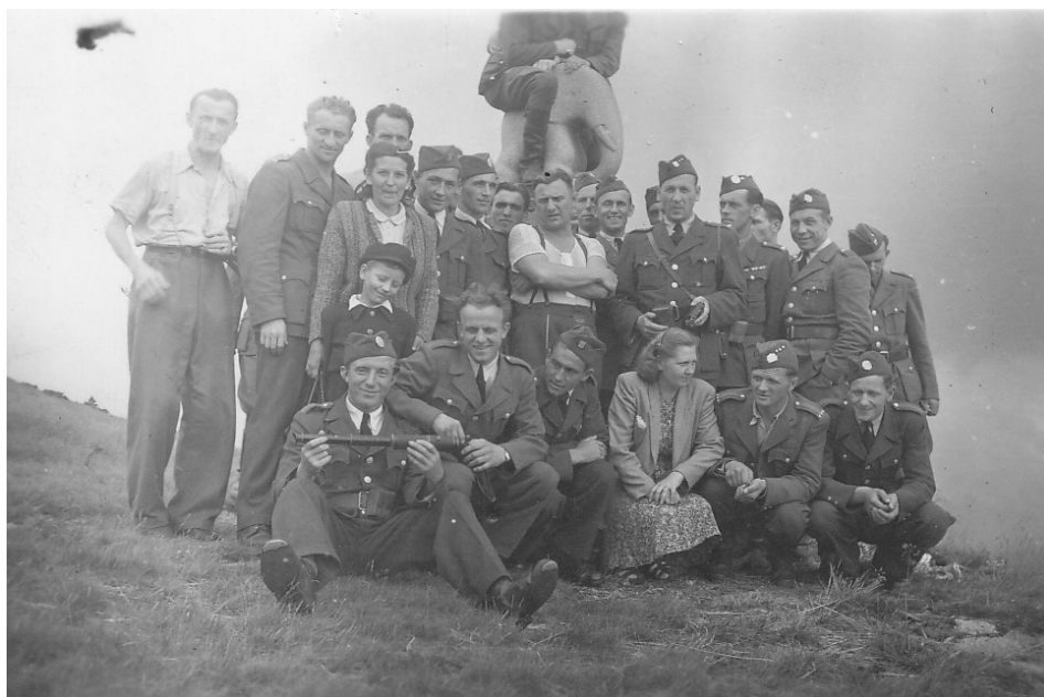
6 | Skupina příslušníků SNB s rodinami na Kralickém Sněžníku