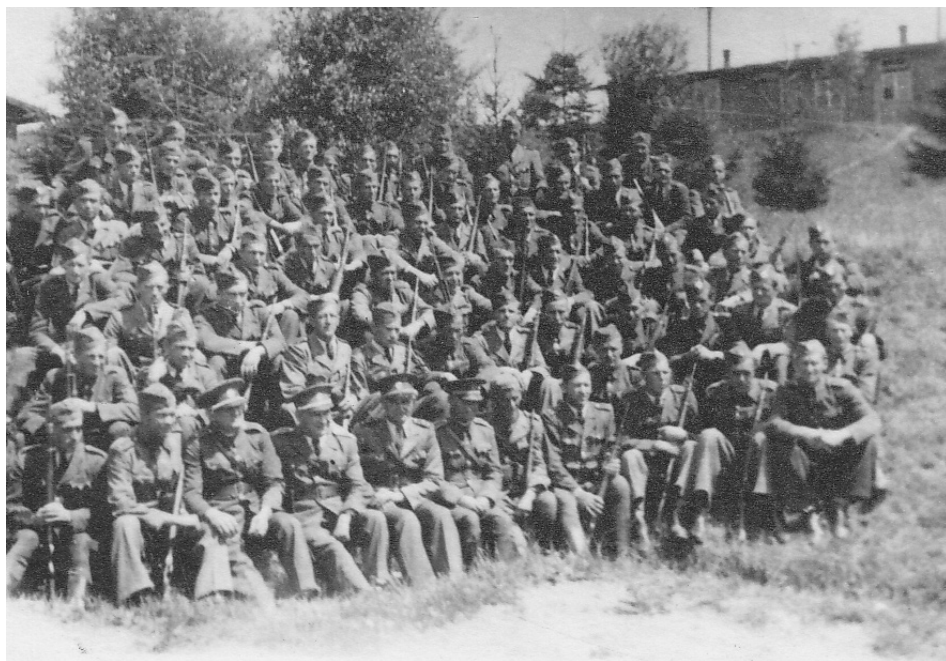
5 | Oddíl SNB na Jesenicku