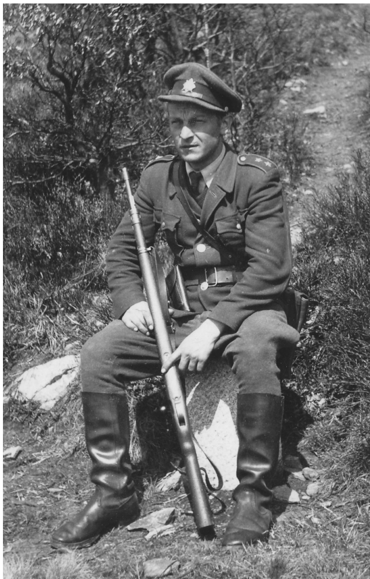
9 | Příslušník SNB během hlídky v terénu