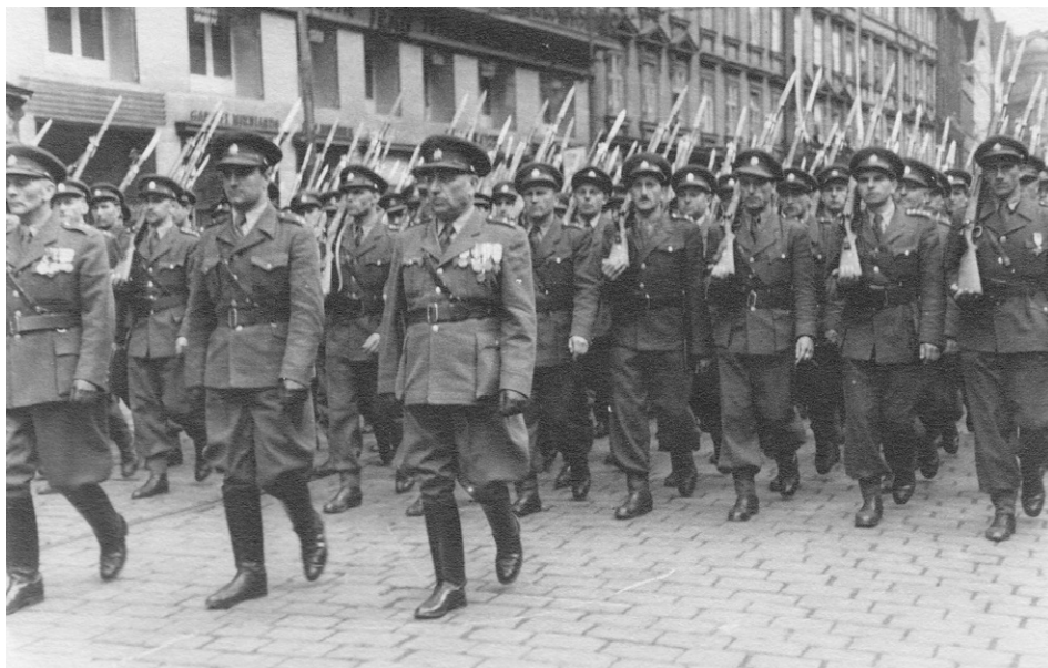
18 | Prvomájová přehlídka SNB v Praze, 1948