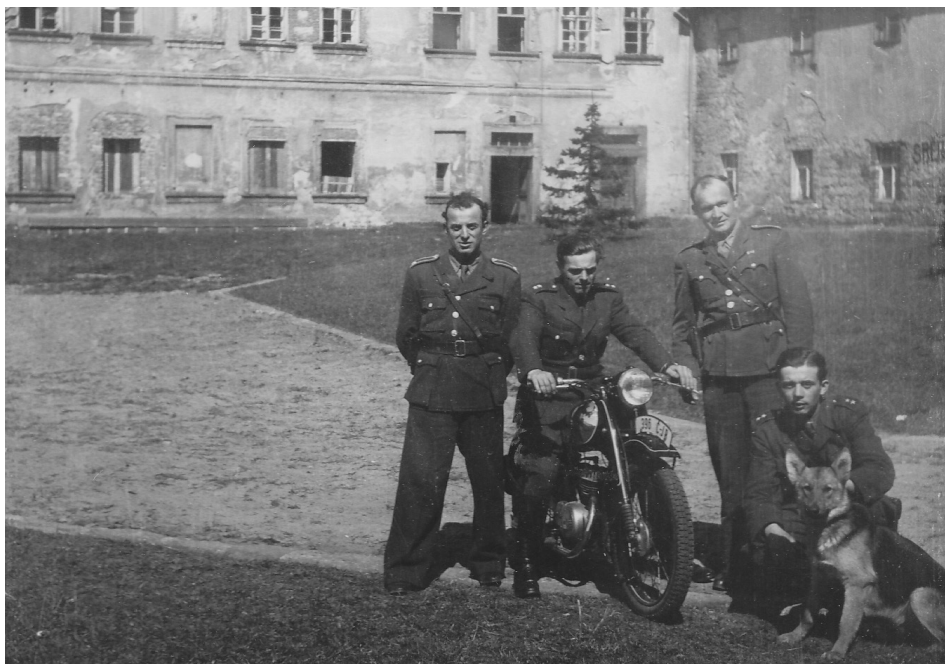
17 | Skupina členů SNB v pohraničí