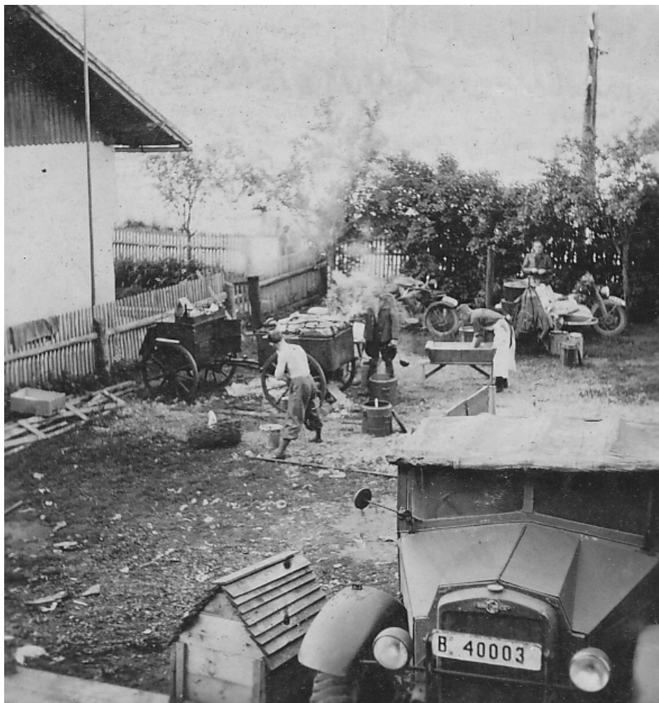
4 | Polní kuchyně SNB v pohraničí