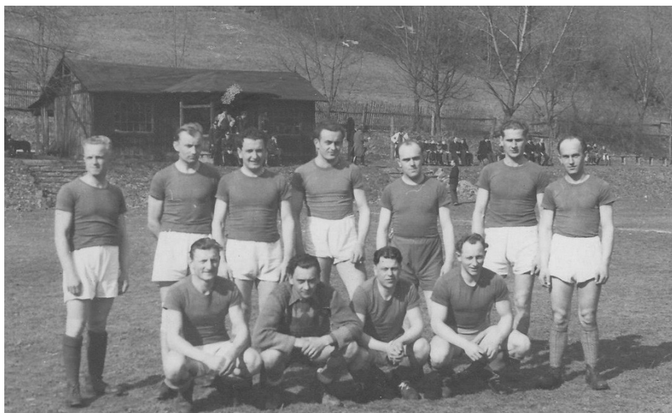
3 | Fotbalové mužstvo SNB v Javorníku