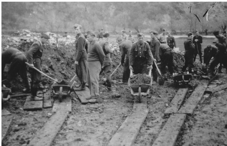
16 | Příslušníci SNB při stavební brigádě