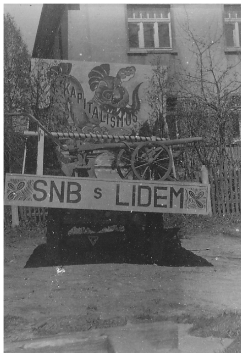
8 | Alegorický vůz SNB při prvomájových oslavách