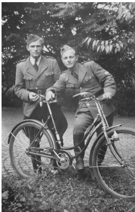
7 | Dvojice příslušníků SNB s bicyklem