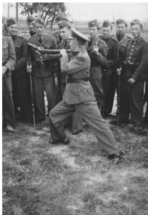
14 | Z výcviku příslušníků SNB