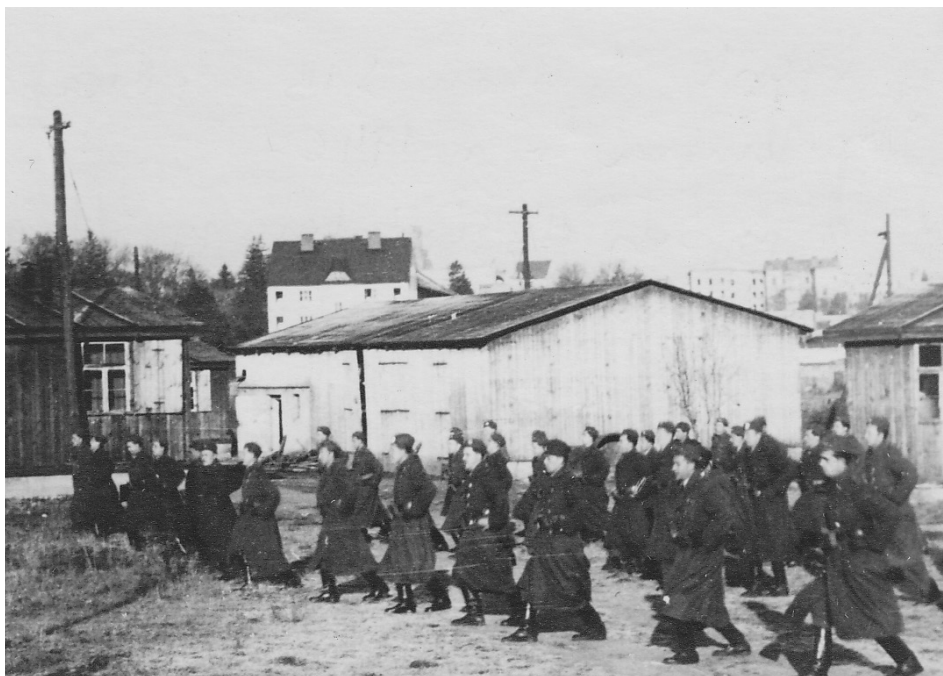
13 | Výcvikové středisko SNB v bývalém internačním táboře pro Němce v Osoblaze