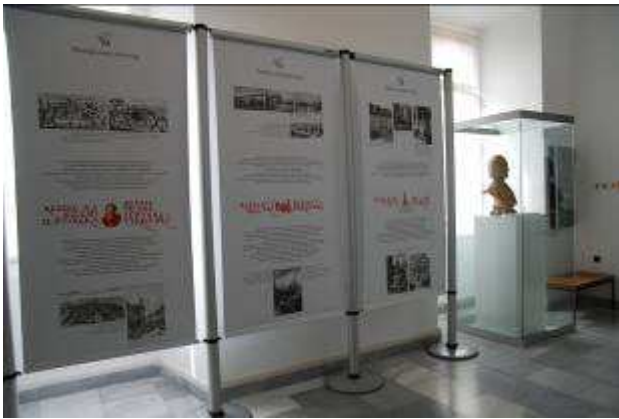
Josef Ressel – český vynálezce...