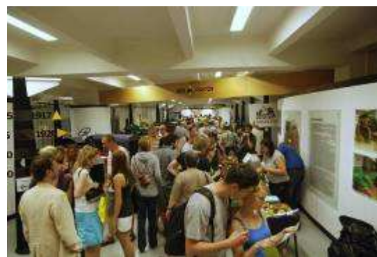
Pražská muzejní noc