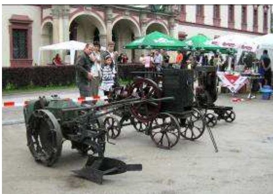
Národní myslivecké slavnosti