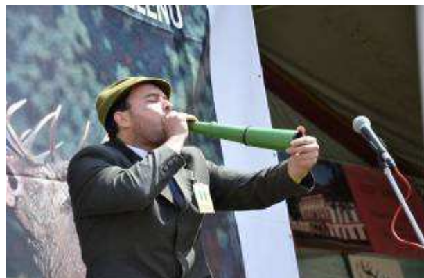
Národní myslivecké slavnosti