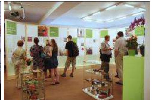
Fair Trade Flowers