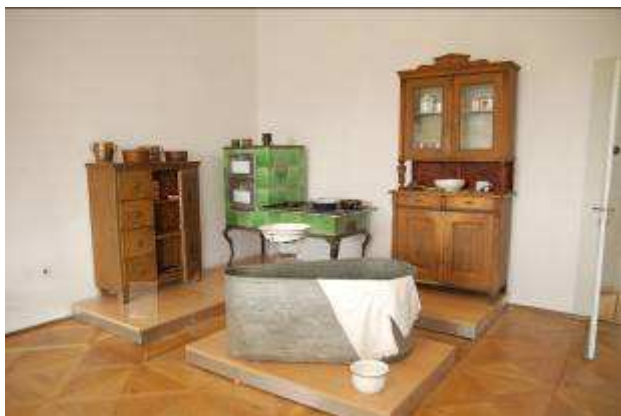
Český a moravský venkov v proměnách staletí