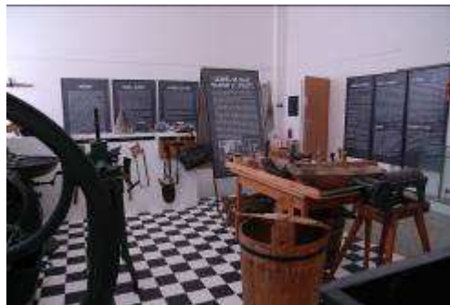
Pod korouhví stříbrného lva