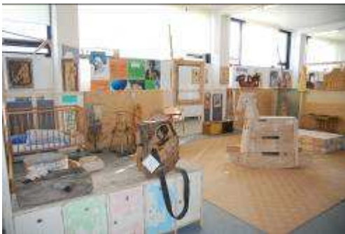
Patříčny a hosté – O dřevě