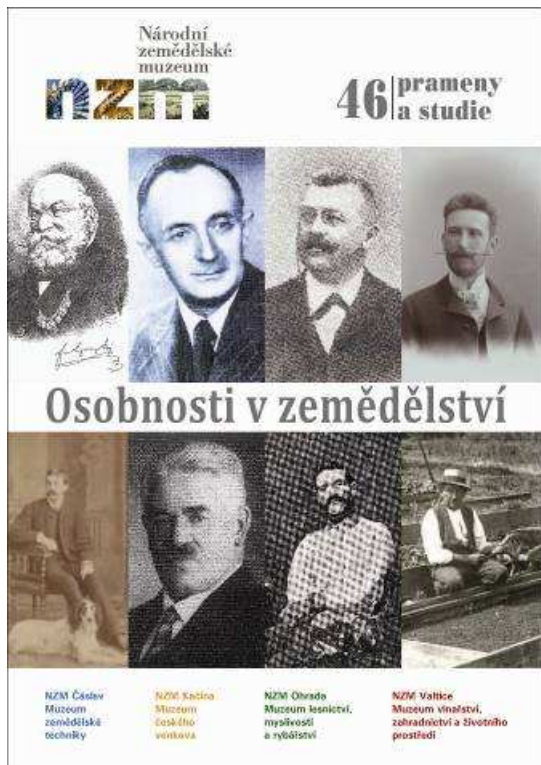
Prameny a studie č. 46