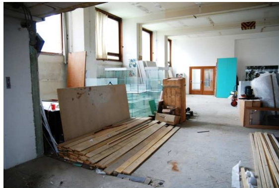
Výstavní prostory před rekonstrukcí