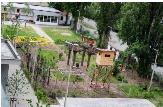
Nádvoří muzea s naučnou stezkou, 2011