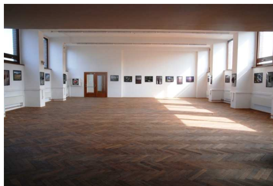
Tytéž výstavní prostory po rekonstrukci

Stavebně upraven byl i sál v 1. poschodí muzea, který poskytl prostor pro výstavu o lesních železnicích s názvem Vůně dýmu a jehličí . Stěžejní výstavou roku se stala v roce 2011 výstava věnovaná Mezinárodnímu roku lesa Co pamatuje strom a lidé zapomněli? , která byla připravena a realizována ve spolupráci s Lesy ČR, s.p., a ÚHUL a která pokračuje i v následujícím roce. Národní zemědělské muzeum Praha tuto výstavu přihlásilo do národní soutěže Ministerstva kultury ČR, Českého výboru ICOM a Asociace muzeí a galerií ČR „Gloria musaealis“. Mezinárodní rok lesa připomněly i doprovodné výstavy Střední lesnické školství v České republice a KKL – Český les v poušti Negev a současně proběhla ve spolupráci s LZ Dobříš a firmami poskytujícími služby v lesním hospodářství i úprava nádvoří muzea podle návrhu ing. Michala Nováčka, Ateliér DVA, kde vznikla naučná stezka O stromech a lidech . K NZM Praha se u příležitosti Mezinárodního roku lesů s vlastními projekty připojila pobočka NZM Ohrada i několik dalších muzeí a institucí z Čech a Moravy.