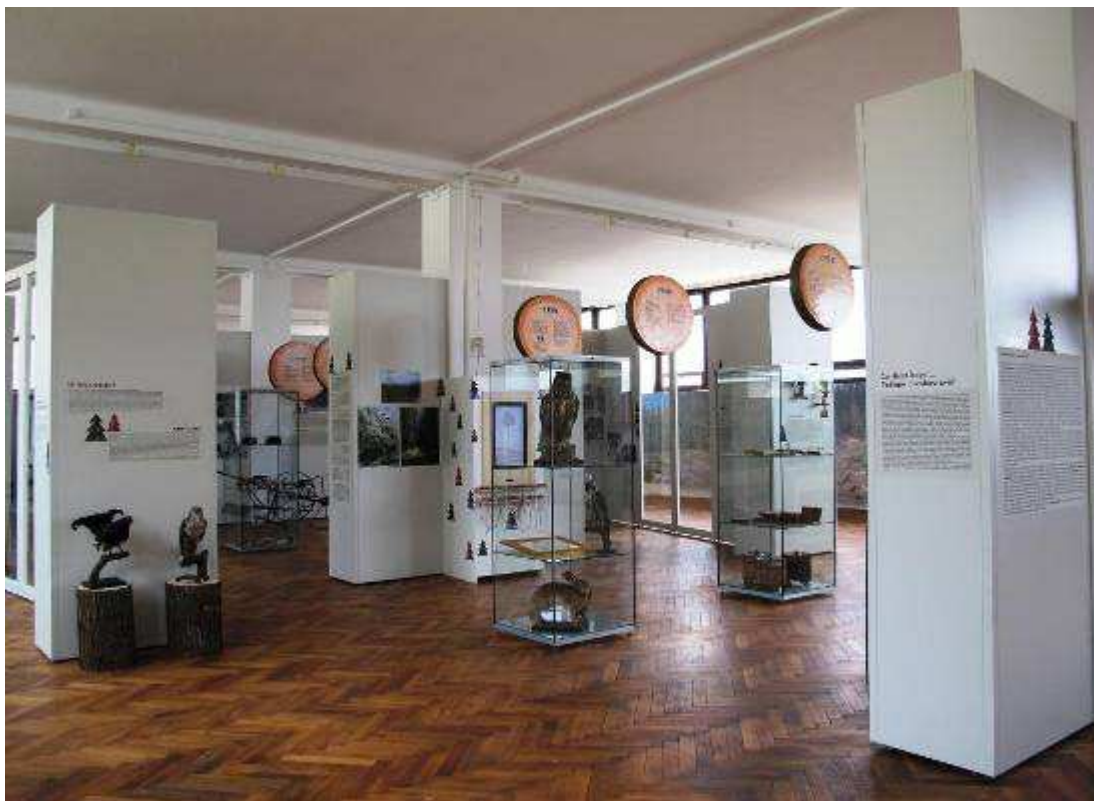
Výstava Co pamatuje strom a lidé zapomněli