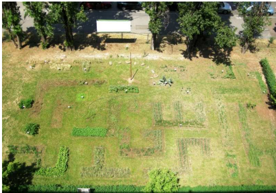
Nádvoří muzea, 2010