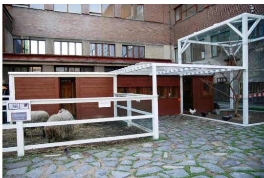
Muzejní farma, 2011

V lednu 2011 byla v rámci mezinárodního projektu, na kterém spolupracovalo devět evropských muzeí, otevřena výstava A Taste of Europe , která mapovala současnou evropskou potravinou produkci, místní stravovací zvyklosti a podněcovala diskuzi o konzumaci z hledisek lokality, zdrojů potravin, jejich dopravy a konzumace.