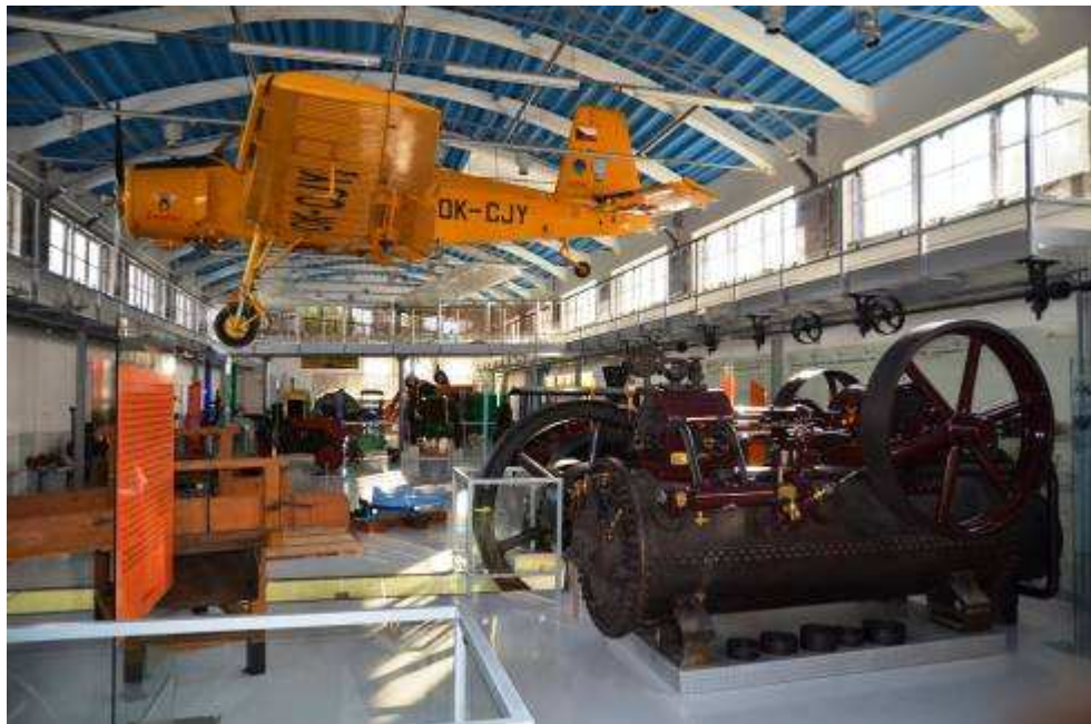
Nová expozice v NZM Čáslav