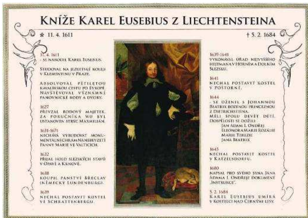
Z výstavy Karel Eusebius z Liechtensteina