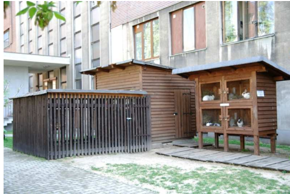
Muzejní farma, 2010