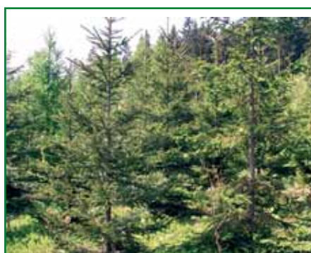
Obr. 16: Růst kultur řízkovanců smrku v terénu