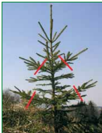
Obr. 3: Odběr rostlinného materiálu pro řízkování z matečného stromku

V mladých matečnicích nehraje místo odběru řízků v koruně významnější roli. Pokud je nutno odebrat řízky ze starších stromů, doporučuje se odebrat větve ze spodní poloviny koruny, protože tam jsou řízky ontogeneticky mladší. Použití řízků z méně vitálních letorostů se obvykle následně projevuje v nižší kvalitě zakořenění v množárně.