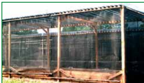
Obr. 7: Boční stínění pařenišť

Popis schématu stínění: výška stínící konstrukce 100 - 140 cm velikost rozpětí L profilů 10 - 15 cm