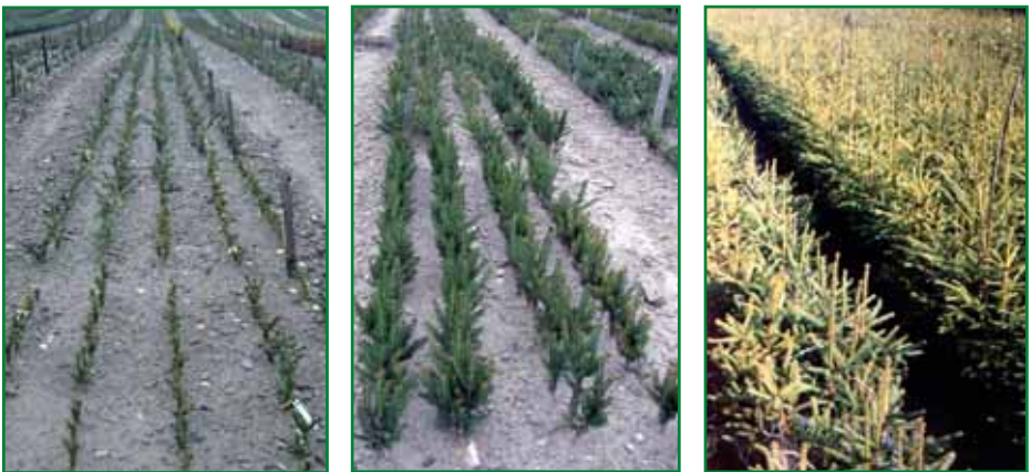
Obr. 15: Růst řízkovanců smrku po školkování na záhony ve školce

Jarní termín pro školkování a osazování do obalů je spolehlivějším pěstebním postupem, kdy vzhledem k delšímu časovému úseku pro zakořeňování v množárně včetně pozdního léta lze počítat i s vyšším procentem kvalitně zakořeně-