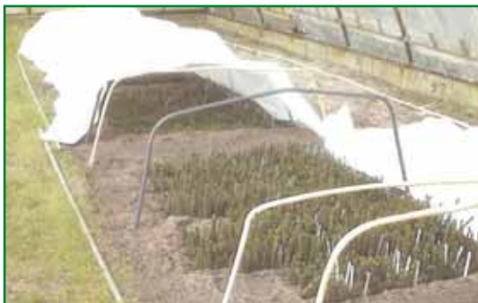
Obr. 8: Konstrukce tunelu z mléčné fólie uvnitř množárny - fóliového krytu

Při použití fóliového krytu byla experimentálně ověřena vhodnost a účelnost metody tzv. dvojího krytí s použitím speciální množárenské mléčné fólie (obr. 8), jejíž mikroklimatické vlastnosti jsou blíže popsány v kapitole 5.3.2. I v tomto případě musí část tepelné složky slunečního záření odfiltrovat kaširovaná fólie hlavního krytu, většinou doplněná i dalším vnějším stíněním. Zabránění přehřátí vzduchu je ale v tomto případě snazší, protože prostor vlastního fóliového krytu můžeme větrat (řízky jsou přikryty další fólií). I když je možné tunel z mléčné fólie vytvořit přímým přikrytím řízků zapíchaných v záhonech nebo obalech (sadbovačích), je vhodné pomocí nízkých oblouků (nejlépe profily z umělé hmoty) zabránit přímému kontaktu fólie s jehlicemi řízků (fólie musí být ale těsně nad řízky). Okraje fólie musí být dobře utěsněny, například dřevěnými nebo kovovými tyčemi, přihrnutím zeminou apod.