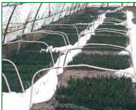
Obr. 13: Snímání fólie pro kontrolu zakořeňování, závlahu a ošetření řízků fungicidy