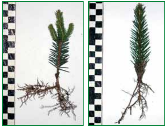
Obr. 14: Kvalitně zakořeněné řízky smrku s kořeny zkrácenými pro školkování

Experimentálně byla rovněž prokázána možnost dlouhodobého zimního skladování kvalitně zakořeněných řízků v klimatizovaném skladu (skladování při teplotě +1 až +3 °C v uzavřených obalech po náležité fytopatologické prevenci).