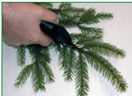
Obr. 4: Stříhání letorostů (řízků) smrku z větví odebraných z matečnic v terénu