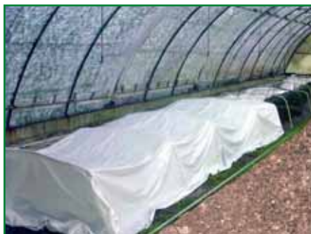
Obr. 12: Tunel ze speciální mléčné fólie uvnitř fóliovníku

Fólie z nízkých tunelů je během zakořeňování na krátkou dobu snímána (obr. 13) jen podle akutní potřeby, obvykle v týdenních intervalech, a to pro dovlhčení substrátu a povrchu řízků včetně dalších pěstebních a ochranných opatření (hnojení, aplikace fungicidů apod.). Při použití této technologie není tedy nezbytný stabilní závlahový systém s mlžícími tryskami, je možná i jednoduchá ruční závlaha s jemně mlžícími rozstřikovači.