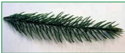
Obr. 5: Letorost (řízek) smrku připravený k zakořeňování

Odebrané letorosty nebo části větví je možné krátkodobě skladovat v klimatizovaných prostorách (maximálně 4 týdny), a to v uzavřených obalech při teplotě +2 až +4 °C. Vhodnějším postupem je ovšem odběr letorostů těsně před vlastním řízkováním, aby byla doba skladování co nejkratší a omezilo se tak potenciální nebezpečí fyziologického poškození letorostů.