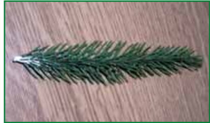
Obr. 10: Řízek smrku ošetřený práškovým stimulatorem připravený k zakořeňování

Řízky se zapichují do řádků v minimálních rozstupech (2 cm), optimální vzdálenost mezi řádky je 5 - 7 cm. Řízky by se vzájemně neměly dotýkat, naopak při velké vzdálenosti mezi řízkými není efektivně využívána plocha množárny (obr. 11).