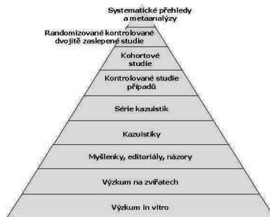
Obrázek 1: Pyramida důkazů.

S ohledem na výše uvedené nároky vznikly pro potřeby EBM některé specifické dokumenty, mezi něž patří především tzv. sekundární zdroje odvozené analýzou a syntézou primárních časopiseckých článků, tj. originálních studií. Za nejspolehlivější primární zdroje jsou považovány randomizované kontrolované studie, které stojí na vrcholu tzv. pyramidy důkazů (obr. 1). Ze stejných důvodů se informační zdroje zaměřené na podporu EBM v klinické praxi postupně vyvíjely a v současnosti je lze rozdělit do pěti základních skupin (viz pyramida "5S", obr. 2, [6]). Při vyhledávání odpovědí na klinické otázky se doporučuje začínat u sekundárních zdrojů a postupovat od vrcholu pyramidy směrem k jejímu základu.