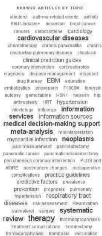
Obrázek 4: Oblak štítků (tag cloud) a možnost prohlížení článků podle témat.