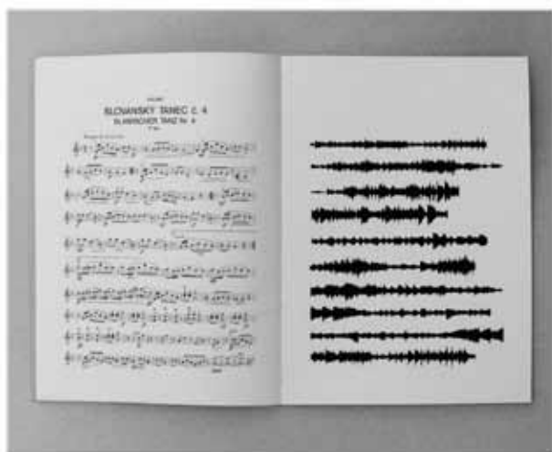
Tomáš Rybníček | Možnosti interpretace