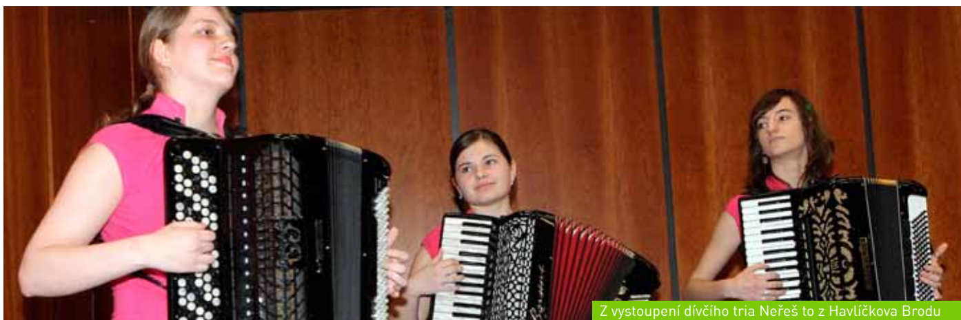
Z vystoupení dívčího tria Neřeš to z Havlíčkova Brodu (Slavnostní setkání knihoven obcí Jihomoravského kraje)

Více na: mzk.cz/SlavnostniSetkaniKnihoven-JMK2012 .