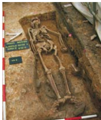
Nález tzv. hrádeckého vampýra Tobiáše, Hrádek nad Nisou, březen 2010.

kátní informace o historii místa, kde žijí, nebo kam přijíždějí a kam se snad do budoucna budou i rádi vracet. Pro doplnění uvádím, že zatím byl v Hrádku nad Nisou řádně dokumentován jen jeden archeologický objekt, a to část trámové konstrukce nalezené doktorem Kavánem v roce 1959 ve vnitrobloku domu čp. 71 na náměstí.