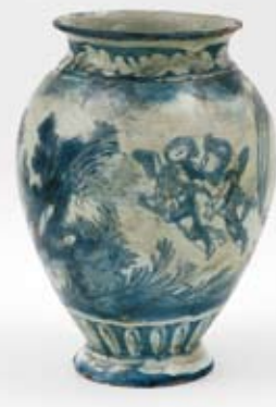
Váza, fajáns, modře malovaný dekor, Itálie, 17. století, PK 541.

Až na vázu s italskou krajinou se jedná o exponáty, které jsou součástí stále uměleckohistorické expozice Severočeského muzea v Liberci. Návštěvníci však nebudou při prohlídce muzejních expozic nijak ochuzeni. Po dobu přechodné prezentace na výstavě Správy Pražského hradu nahrazují zmiňované zápůjčky neméně významné umělecké předměty. Za urbinkou mísou je vystaven skvělý majolikový talíř se znakem florentské rodiny Salviati. Pochází z let 1545–1550 rovněž z Urbina, a to z dílny Quido Fontany. Talíř patří do rozsáhlého servisu, jehož jednotlivé části jsou dnes roztroušeny