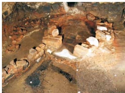
Základy chlebové pece po odstranění zbytků propadlé klen- by, Frýdlant, únor 2011.

nuje vybudování expozice arche- ologie a historie frýdlantského náměstí a dějin tamních řemesel. Unikátní zhruba 500 let staré zá- klady pece se tak stanou součástí výstavy a každý je bude moci vi- dět přesně tam, kde je opustili naši předkové.