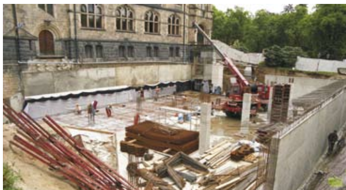
Stavba podzemního depozitáře, léto 2002.

Prosíme čtenáře o pomoc při shánění informací o dění na Liberecku, Jablonecku a Českolipsku za druhé světové války. V případě, že máte zajímavé informace, či jste byli přímo účastníky dění, napište nám prosím na e-mailovou adresu ivan.rous@muzeumlib.cz či volejte na telefonní číslo +420 485 246 165.