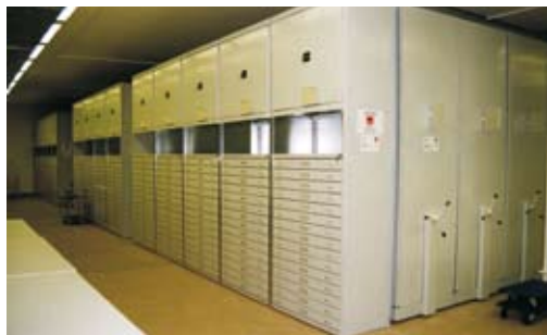
Sbírkové předměty v podzemním depozitáři jsou uloženy v pojezdových regálech nebo fixních šuplíkových skříních.

tento rok se podařilo získat významnou finanční injekci na již třetím rokem probíhající rekonstrukci barokního kláštera v Hejnicích, který byl tehdy ve vlastnictví muzea. Na základě restitučního zákona však musel být rekonstruovaný klášter v závěru roku vrácen původním vlastníkům, Řádu menších