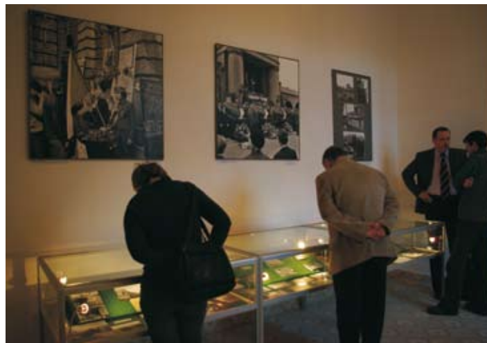
Zahájení výstavy Inwazja na Czechoslowacjie w 1968 r. – Karkonosze, Góry Izerskie i Północno-Wschodnie Czechy, Archiwum państwowe, Wrocław – Odział w Jeleniej Górze, 2. 12. 2008.

I přes tento pokrok nám v dokumentaci událostí souvisejících s rokem 1968 zůstávají mnohé mezery. Zejména pro období následujícího roku a počátku normalizace nám chybí doklady. Do budoucna bychom proto rádi doplnili zatím velmi skromný soubor vzpomínek těch, kteří jsou ochotni se o své osobní prožitky podělit a zaznamenat je pro budoucnost.