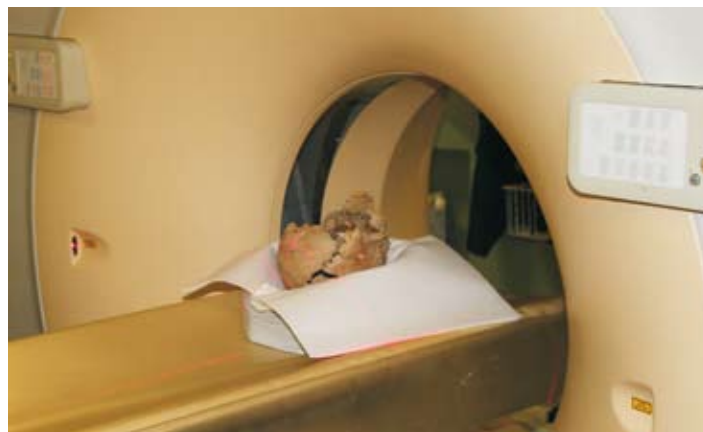
Cranium „vampýra Tobiáše“ na pracovišti spirální CT v liberecké nemocnici.

ření ve Švýcarsku a v jihozápad- ním Německu v osmdesátých le- tech 20. století (města Konstanz, Zürich, Freiburg im Breisgau, Rott- weil, Winterthur, Regensburg, Ulm a Zurzach). V devadesátých letech 20. století byla s výbornými vý- sledky prozkoumána městská jádra v sousedním Sasku (Dresden, Lei- pzig, Crimmitschau). V Čechách můžeme navázat na výsledky prů- zkumů Mostu, Plzně či Žatce a do-