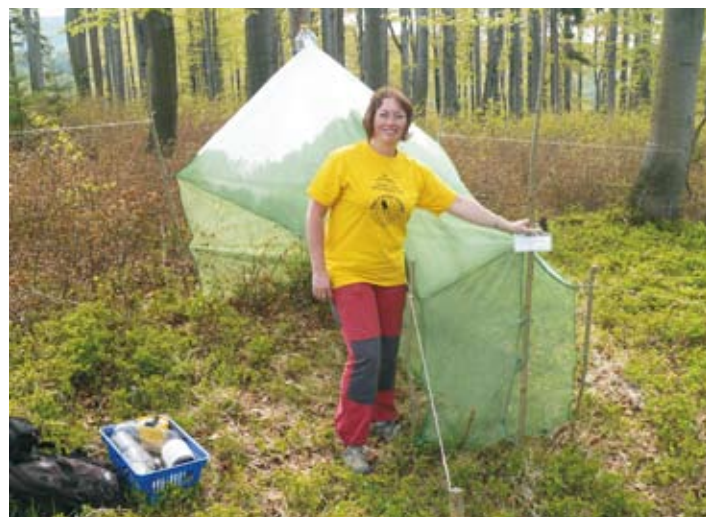
Instalace tzv. Malaiseho pasti k odchytu hmyzu pro vědecké účely ve staré bučině v Jizerských horách, květen 2011.

Severočeské muzeum v souvislosti s děním v letech 1938 až 1945 v tzv. Říšské župě Sudyty připravuje přehledovou výstavu, zabývající se zhruba 40 pobočkami koncentračních táborů Flossenbürg, Groß-Rosen, Osvětim a Ravensbrück na území České republiky v pohraničním pásu od Sokolovska po Bruntálsko a jednotlivě v Brně, v okolí Prahy a v jihozápadních Čechách, včetně pobočných koncentračních táborů na Jablonecku a Liberecku – v Rýnovicích, Rychnově u Jablonce nad Nisou, Smržovce a Chrastavě. Výstava se bude konat v termínu 25. října až 4. prosince 2011.