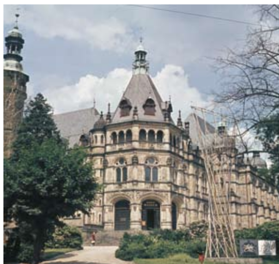
Budova muzea s poutačem M. Halašky na reprezentativní výstavu československého skla, která byla po premiéře v Moskvě v r. 1959 uspořádána o rok později rovněž v Liberci.