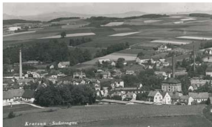
Zatím jediná známá fotografie koncentračního tábora FAL Kratzau II (r. 1944), kterou objevil badatel a spolupracovník muzea Pavel Štekl.

V současné době pracujeme na přípravě knihy, která se bude zabývat regionální historií táborových komplexů z období první a druhé světové války a z období odsunu německého obyvatelstva z českého pohraničí. První světová válka bude v knize zastoupena obrovským zajateckým táborem, který stál na místě dnešního libereckého letiště. Největší díl publikace věnujeme období druhé světové války. Koncentrační tábory, pobočky kmenového tábora Groß-Rosen, budou mít samostatné kapitoly a poprvé budou zpracovány zcela detailně. Každý objekt bude přiblížen plánovou dokumentací jak původní, tak i novou, která ostatně bude provázet i další typy táborových zařízení v knize uvedené. Zároveň budou známá fakta doplněna o závěry z výzkumů v terénu a o donedávna neznámé podrobnosti odhalené při archivních šetřeních. Podobně pojaty budou i kapitoly o druhoválečných zajateckých a pracovních táborech a odsunových střediscích. Některá zařízení máme doložena jen ve svědeckých výpovědích nebo naopak