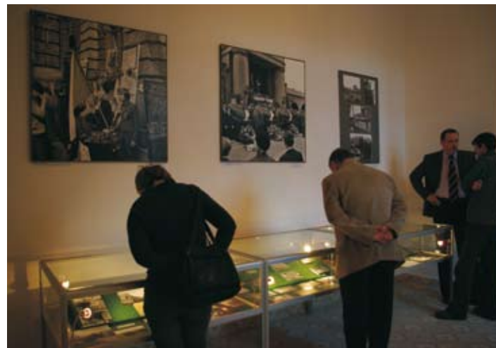
Zahájení výstavy Inwazja na Czechoslowacjie w 1968 r. – Karkonosze, Góry Izerskie i Północno-Wschodnie Czechy, Archiwum państwowe, Wrocław – Odział w Jeleniej Górze, 2. 12. 2008.

I přes tento pokrok nám v dokumentaci událostí souvisejících s rokem 1968 zůstávají mnohé mezery. Zejména pro období následujícího roku a počátku normalizace nám chybí doklady. Do budoucna bychom proto rádi doplnili zatím velmi skromný soubor vzpomínek těch, kteří jsou ochotni se o své osobní prožitky podělit a zaznamenat je pro budoucnost.