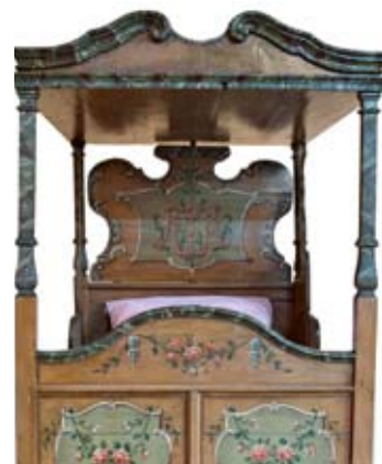
Postel s nebesy, Liberecko, konec 18. stol., stav po zrestaurování v r. 2011.

Předměty, zaplavené 7. srpna 2010 v depozitáři vodou a zanesené vrstvou bahna, byly v následujících dnech převezeny do muzea, kde byly v konzervátorské dílně očištěny. Hlavní nebezpečí, kte-