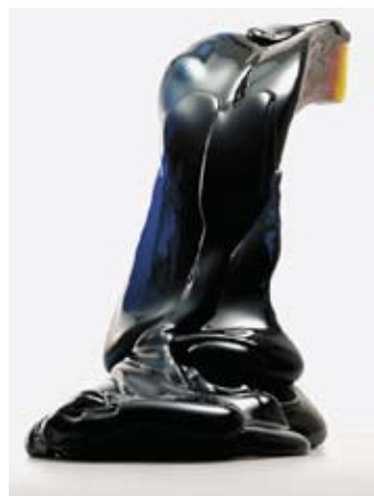
„Z vnitra země“, lité sklo, 2004.