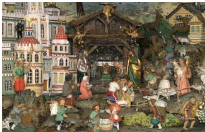
Skříňkový betlém, dřevořezba, polychromie, Hostinné, třetí čtvrtina 19. století, Krkonošské muzeum Vrchlabí.

Samozřejmě dřevořezby, kterým patří velmi významné místo v celých severních Čechách. Na Liberecku nevyrostly tak výrazné a početné osobnosti řezbářů, jak tomu bylo směrem na východ v oblasti Krkonoš a Podkrkonoší a směrem na západ ve Šluknovském výběžku. V době, kdy se již v Liberci betlémy v rodinách nestavěly a vzbuzovaly napříště především pozornost muzejních pracovníků a soukromých sběratelů, prožívalo betlémařství na Šluknovsku bouřlivý rozvoj. Mistrovství řezbářů Šluknovska bude moci návštěvník na výstavě srovnat se zcela rozdílným přístupem krkonošských tvůrců, jejichž dílo bude prezentováno několika skříňkovými betlémy zapůjčenými z Krkonošského muzea KRNAP ve Vrchlabí. Mimořádnou pozornost si rovněž zaslouží skříňkový betlém s oblékanými voskovými figurami, klášterní prá-