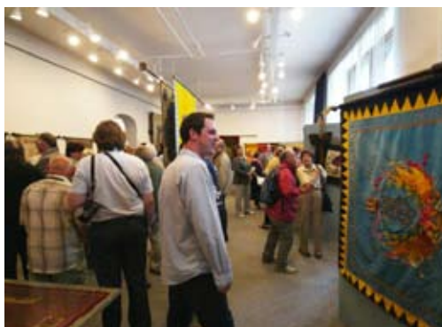
Záběr z vernisáže výstavy 22. 6. 2012.

Blížší informace o průběhu kongresu a písemné verze přednášených příspěvků byly publikovány ve sborníku, vydaném na podzim roku 2012 Českou vexilologickou společností. ■