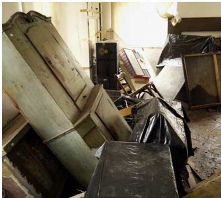
Depozitář Severočeského muzea v Raspenavě, stav po povodních, 9. 8. 2010.

ré tehdy nábytku hrozilo, představovala změna vlhkosti, vysychání dřeva spojené s jeho deformací, rozpraskáním a poškozením malby. Muzeum naštěstí získalo z pojistného plnění finanční prostředky na restaurování. Teprve v okamžiku ztráty si lidé uvědomují její zhoubnost a nenávratnost. Jsme velmi rádi, že díky restaurátorům mohou zachráněné artefakty lidem zprostředkovat setkání se světem našich předků, a to prostřednictvím umu městských i venkovských truhlářů, řezbářů a malířů, kteří je před dvěma sty lety zhotovili. ■