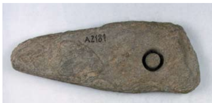
Polotovar sekeromlatu s nedokončeným vrtáním otvoru pro topůrko, surovina: metabazit typu Pojizeří (neolit – kultura s vypíchanou keramikou; sbírka Muzea Českého ráje v Turnově).

ných nástrojů. Geologové ji nazvali amfibolový kontaktní rohovec a archeologové ji nazývají metabazitem typu Pojizeří. Původně jemný sopečný popel splavený do moře prošel dvojí metamorfózou. Přičemž při druhé kontaktní metamorfóze vznikla surovina, kterou lze zařadit mezi nejtvrdší horniny na území České republiky, avšak zároveň díky svým vlastnostem je vhodná