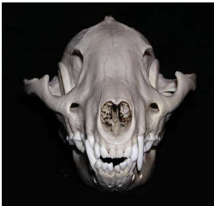
Lebka psíka mývalovitého.

Už od úsvitu civilizace hrály zvířecí lebky důležitou emotivní úlohu v lidském životě. S uctíváním zvířecích lebek se můžeme setkat jak u pravěkých kultur, tak u primitivních domorodých kmenů současnosti. Do dnešní doby rozhodně pozůstatky těchto kultů přežívají v podobě nejrůznějších loveckých trofejí, ať už se jedná o lebky, parohy nebo vypreparované celé hlavy. Pokud však tato záliba souvisí se zbytečnou smrtí zvířete, nemá v životě moderního člověka místo.