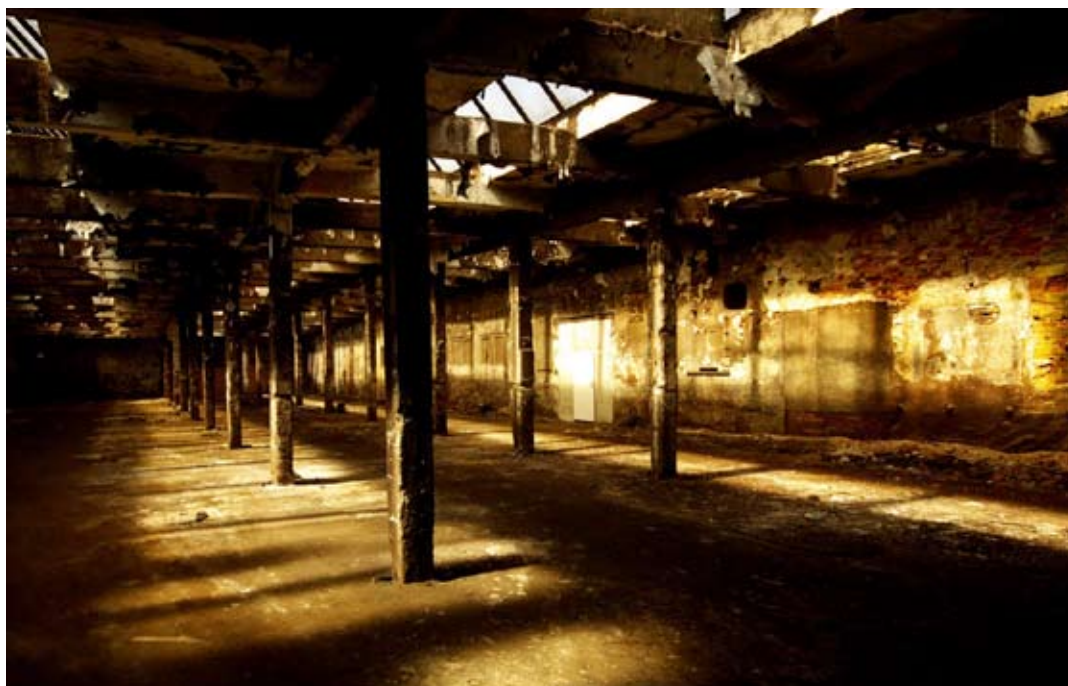
Areál bývalé továrny R.A.F., současný stav v roce 2012.

V letech 1914–1915 se v liberecké RAFce vyráběly již jen náhradní díly a díly pro mladoboleslavský koncern. V roce 1916 byla výroba definitivně zastavena a továrna uzavřena. Areál byl prodán a do prázdných hal se přestěhovala přádelna a továrna na koberce. Z automobilky se stala textilka. Ale v roce 1926 bývalou RAFku koupil starý pán Christian Linser. Znovu se do objektu stěhují stroje a vybavení slévárny a opět se zaměřuje na produkci pro automobilový průmysl. Rokem 1926 je datován i projekt velké haly slévárny od firmy Robert u. Ernst Peukert. Požadována byla i přestavba kancelářské budovy, kde vznikl velký byt pro Christiana Linsera. Opodál byly postaveny garáže pro tři automobily. Do továrny se tak vrátil život, tentokrát do slovně.