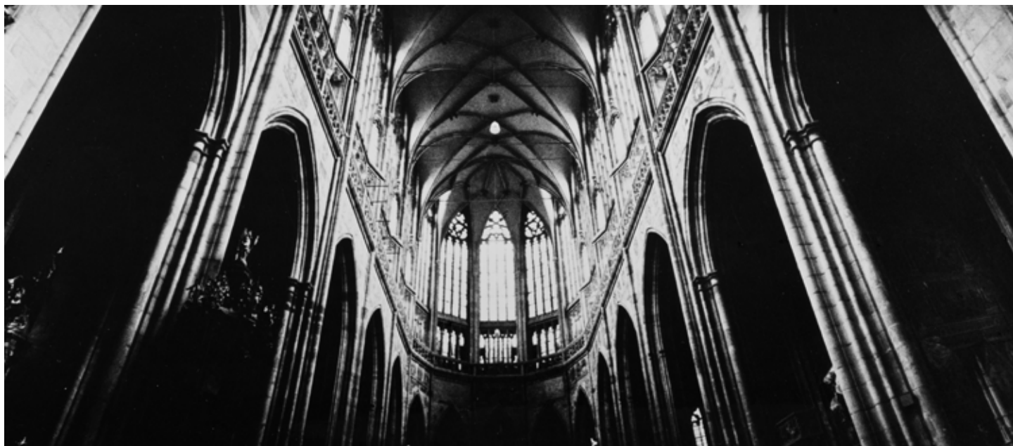
Jiří Bartoš: Bez názvu, 1972

Lektorský program je možné pro zájemce uspořádat od 29. 7. do 29. 8. vždy od úterý do pátku během otevírací doby muzea. Na program je nutné se domluvit minimálně pět pracovních dnů předem na tel. 485 246 147 nebo na e-mail iva.krupauerova@muzeumlb.cz . Jednotná cena za workshop je 30 Kč za osobu, minimální počet účastníků je 10, maximální 30. ■