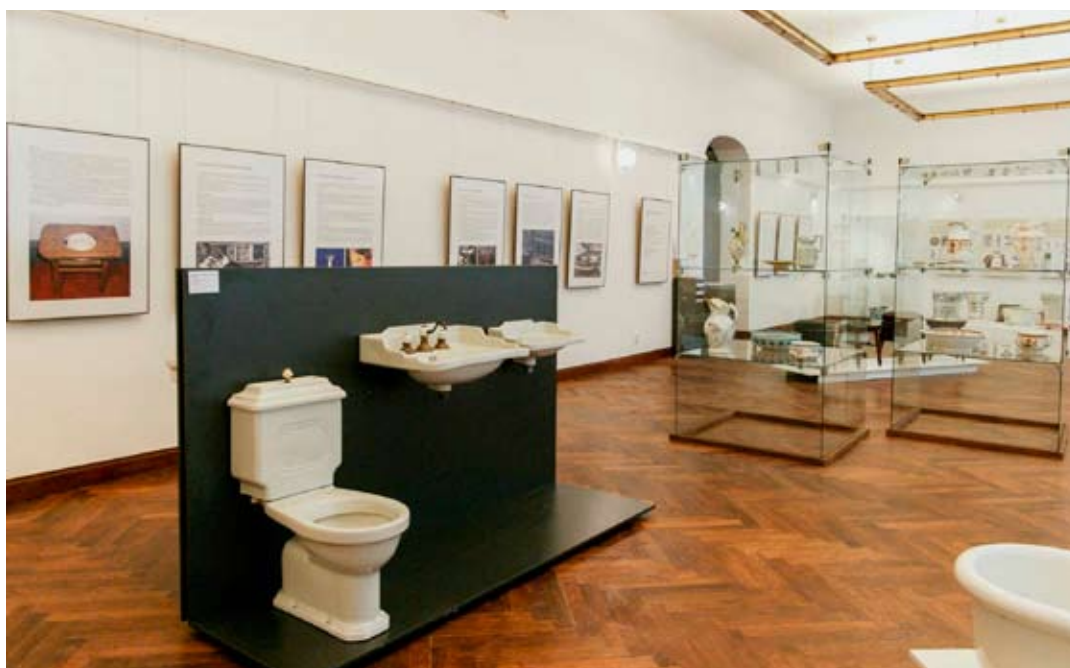
Královské posezení, první výstava ve zrekonstruovaném malém výstavním sále, potrvá do 28. září.