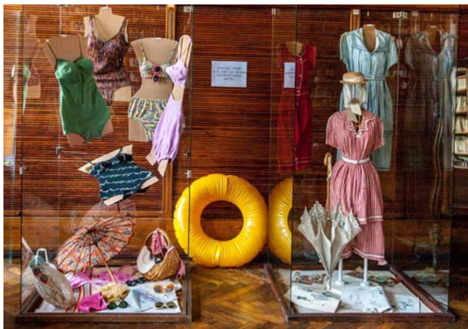
Koupací úbory a doplňky z depozitáře textilu vystavené v knihovně při příležitosti Muzejní noci.

Nejvíce prezentovaný a zvláště půvabný červenobíle pruhovaný secesní koupací úbor byl v minulosti několikrát vystavován. Nejprve roku 1990 jako exponát měsíce v SM. V roce 2001 doplnil výstavu v Regionálním muzeu v Jílovém u Prahy s názvem „Bejvávalo aneb jak jsme žili před 100 lety“. V nedávné době jej mohli návštěvníci spatřit na výstavě „Koupání bez hranic“ v Städtischen Museen Zittau, s reprízou na začátku roku 2014 v nově otevřené Oblastní galerii v Lázních. Dva úbory – modrobíle pruhovaný a dívčí červený – byly v roce 2006 vystaveny v Lázních na benefiční akci pořádané Statutárním městem Liberec. Na letní sezónu roku 2014 zapůjčilo muzeum jedny dámské a jedny pánské plavky ze 30. let 20. století Regionálnímu muzeu a galerii v Jičíně na výstavu „Rozmariná léta aneb plovárny na Jičínku“. Naposledy bylo k vidění deset koupacích úborů a plavek ze sbírek SM na komorní prezentaci u příležitosti muzejní noci (31. 5. 2014) v knihovně Severočeského muzea. Pro návštěvníky byl připraven doprovodný program s možností vytvořit si návrh na plavky a slunečník ve formě letního „přáníčka“. Inspiraci k navrhování mohli návštěvníci nalézt na obrázcích v dobových časopisech a na fotografiích. ■