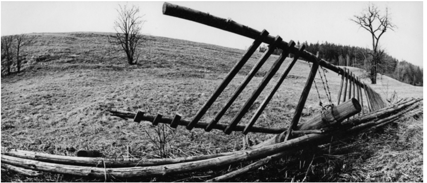
Jiří Bartoš: Bez názvu , 1974