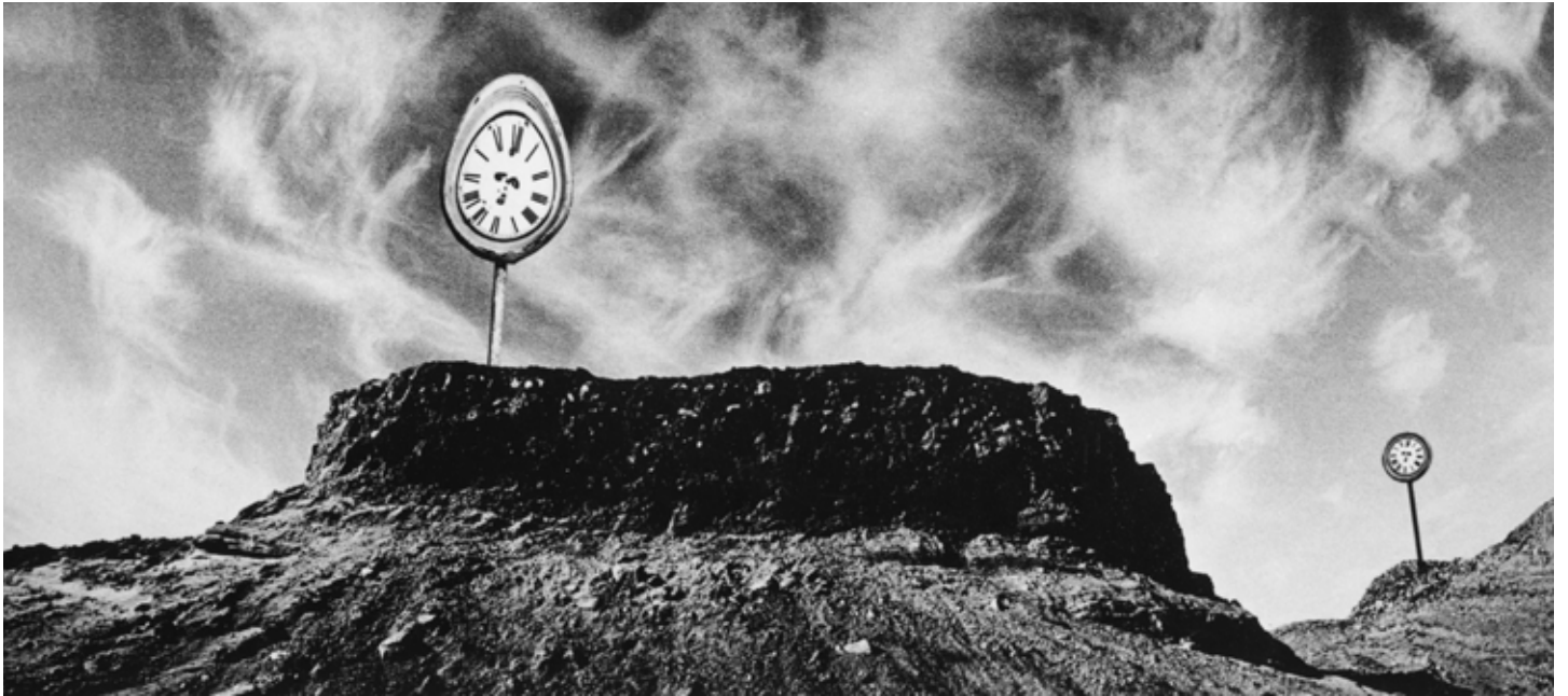
Jiří Bartoš: Představy II , 1975 Jiří Bartoš: Představy III , 1975