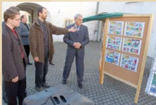
Oficiální otevření EC EKODOMOV v Žatci

Projekt je spolufinancován Evropským sociálním fondem a státním rozpočtem ČR.