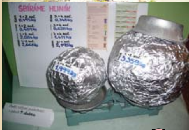
Sběr hliníku v ZŠ Záboří nad Labem