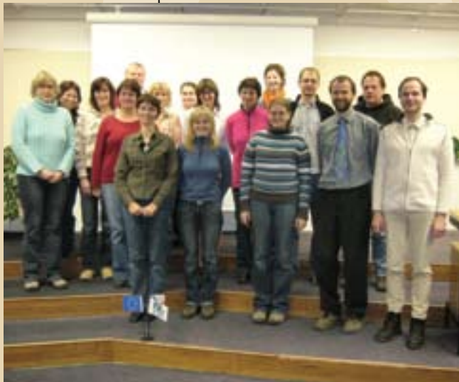
Prvních 20 proškolených účastníků vzdělávacího programu

Projekt je spolufinancován Evropským sociálním fondem a státním rozpočtem ČR.