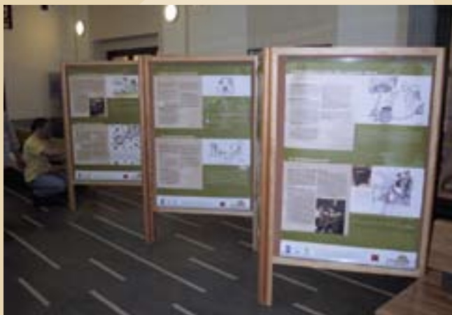
Jedním z výstupů je putovní výstava Miss kompost a Nulový odpad, která na podzim 2007 „navštívila“ 4 města a obce.