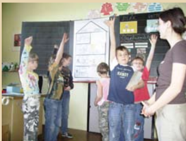
Výukový program „Energie s námi vždy je“

Kampaň je podpořena Magistrátem hl. města Prahy.