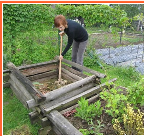
Ilustrace 4: Vítězný kompost