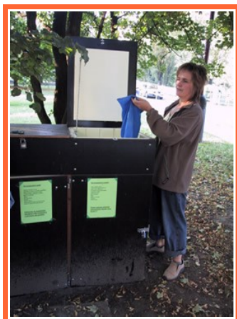
Ilustrace 11: Komunitní kompostování v Chrudimi

Komunitní kompostování představuje jednoduchý a levný způsob využívání bioodpadů. Je mezistupněm mezi domácím a komunálním kompostováním a umožňuje lidem, kteří nemají vlastní zahradu, využívat v blízkosti místa bydliště vlastní bioodpady. V rámci pilotního ročníku projektu byla ověřena možnost komunitního kompostování v panelovém sídlišti U Stadionu v Chrudimi, kde byl instalován kompostovací box, do kterého své bioodpady v roce 2006 ukládalo cca 20 rodin. Box je uzamykatelný, má perforované dno pro odvod zbytkové vody a lepší provětrávání. Pro minimalizaci změn teplot je box opatřený tepelnou izolací, má uzamykatelné čelní dveře a víko, aby nedošlo k znečištění kompostu nežádoucími příměsími či k vniknutí hlodavců. Klíč od kompostéru obdrží každý, kdo se chce zapojit do kompostování. Pilotní ročník projektu probíhal díky ekocentru PALETA, které získalo finanční prostředky od města Chrudim.