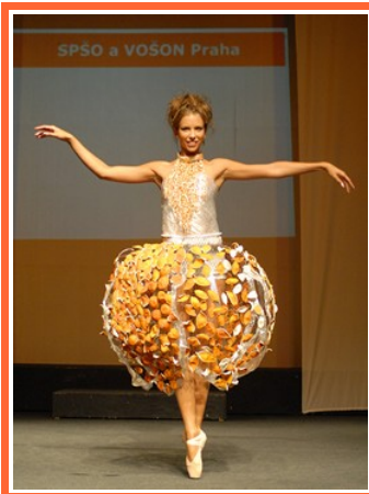
Ilustrace 5: Přehlídka Nulový odpad 2006