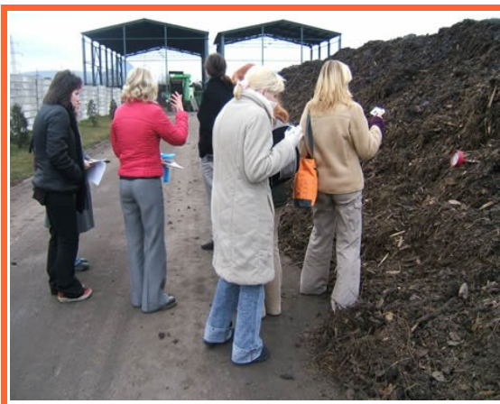
Ilustrace 10: MNO- exkurze na kompostárnu Pitterling