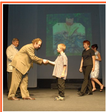
Ilustrace 3: Výherce soutěže Nejlepší dílo o kompostu

Součástí galavečera byl první ročník módní přehlídky „ Nulový odpad 2006 “, kde se sešly jedinečné modely od mladých tvůrců, které byly zpracované z odpadových materiálů, biodegradabilních plastů, ze starých, přešivaných oděvů a mnoha dalších materiálů. Přehlídku podpořila Helena Fejková částí své Iněné kolekce,