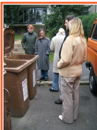
Ilustrace 9: MNO - exkurze sběr bioodpadů