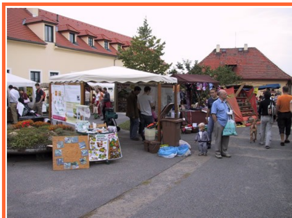
Ilustrace 1: Infostan Toulcův Dvůr