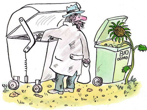
Ilustrace 12: Jaroslav Dostál (ČUK – soutěž na téma MISS KOMPOST)

Tisk vybraných záznamů: Datum >= 01.01.2006, Datum <= 31.12.2006