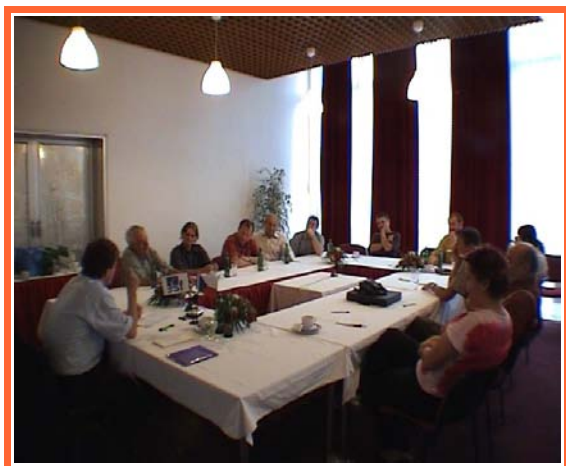
Ilustrace 6: Výzkum - vnímání ekocenter v Úst. kraji