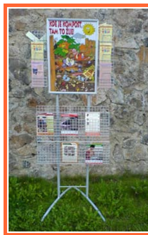
Ilustrace 7: Stojan ISE