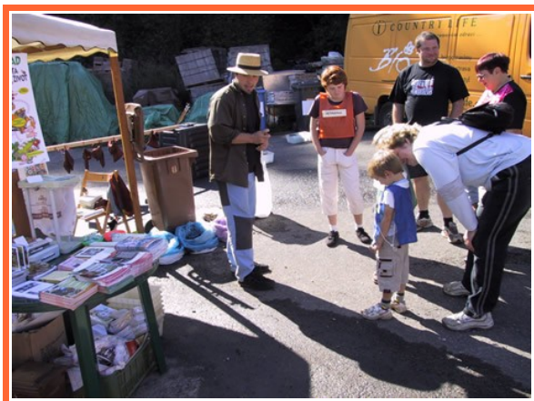
Ilustrace 2: Infostan Nenačovice