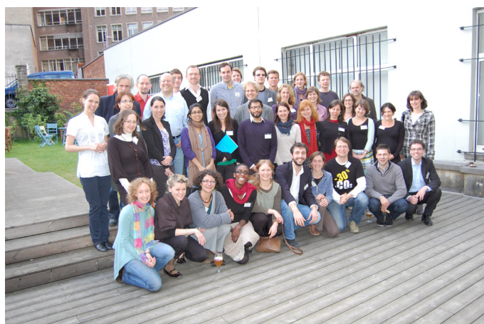
Valná hromada Climate Action Network Europe

V rámci sítě nevládních organizací Climate Action Network Europe jsme se účastnili několika strategických setkání a odborných seminářů o mezinárodní klimatické politice a emisním obchodování.