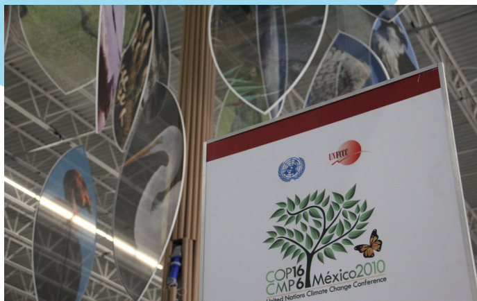
autor: Friends of the Earth International

proto označit výsledek konference v mexickém Cancúnu v závěru roku, kde mnoho z dlouho připravovaných ujednání dostalo podobu závazných rozhodnutí a státy projevíly vůli dosáhnout právně závazné dohody v roce 2011. V průběhu roku jsme se účastnili celkem čtyř týdnů vyjednávání o detailech klimatické smlouvy. Práce CDE se zaměřila na informování českých médií [→] a dalších nevládních organizací o vývoji jednání a na místě jsme spolupracovali s mezinárodními nevládními organizacemi.