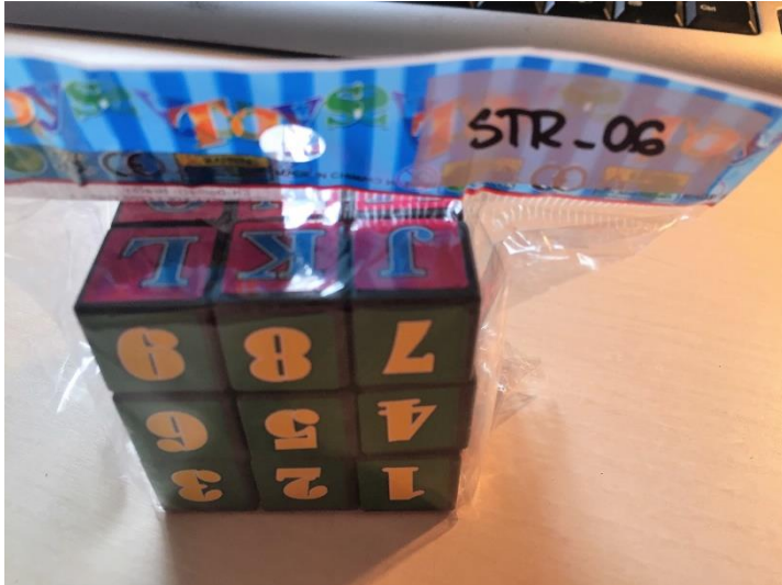
Rubikova kostka 1