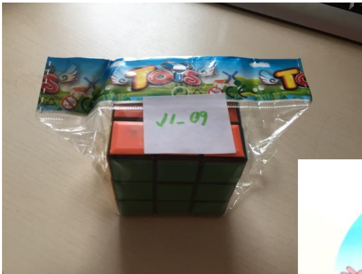
Rubikova kostka 2