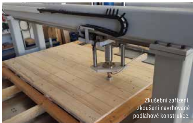
Zkušební zařízení, zkoušení navrhované podlahové konstrukce.