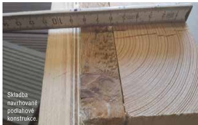
Skladba navrhované podlahové konstrukce.