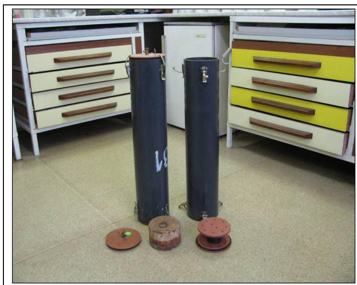
Obr. 1: Minisila o kapacitě cca 5 kg sloužící k laboratornímu testování procesu silážování

Fermentační testy na silážování se prováděly pomocí laboratorních minisil (viz obr. 1). Zařízení je vybaveno možností odvodu a odběru silážních tekutin. Doba silážování byla dle běžných postupů jednotně stanovena na 90 dnů. U všech variant, zejména s nízkou sušinou, jsme použili v silážních nádobách dvojitě dno za účelem jímání uvolněné silážní tekutiny během fermentačního procesu. Při silážování byla zjišťována hmotnost prázdné nádoby a nádoby po naplnění silážní hmoty a sušina naskladněné hmoty. Po 90 dnech fermentace, kdy minisila byla otevřena, byly nádoby zváženy a odebrány vzorky fermentovaných plodin (siláží) k analýzám. Během fermentace bylo u každé varianty zjišťováno množství uvolněné silážní tekutiny. Ze zjištěných hodnot byly vypočítány fermentační ztráty sušiny a ztráty původní hmoty silážní tekutinou.