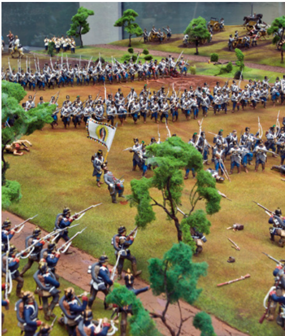
Nové dioráma bojů Knebleovy brigády na Chlumu

Ve druhé polovině roku 2011 se pracovalo na úpravě nové expozice. Celkem navštívilo muzeum 6 552 lidí, 6 181 lidí navštívilo rozhlednu, celkem tedy areál Památníku navštívilo 12 733 lidí.