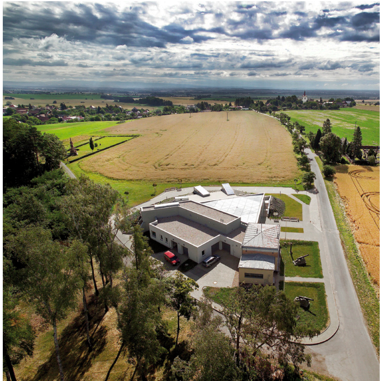
Památník bitvy 1866 na Chlumu – pohled z rozhledny