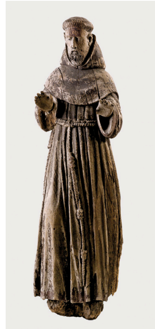
Nový příspěvek do historické sbírky muzea – dřevěná socha svatého Františka z Assisi, vysoká 90 cm, se zbytky polychromie

V roce 2011 bylo v rámci oddělení ISO digitalizováno celkem 578 kusů sbírkových předmětů, čítajících celkem 726 záběrů. Dále probíhala fotodokumentace sbírek a nálezů MVČ v HK, především pro potřeby nové expozice v Muzeu války 1866 na Chlumu. V roce 2011 bylo pořízeno celkem 1 788 záběrů, které byly zpracovány do tiskové podoby. V rámci skenování byly pořizovány digitální skeny diapozitivů, papírových předmětů, plánů, sbírkových fotografií v souvislosti s činností muzea. Bylo pořízeno a do tiskové podoby připraveno celkem 484 skenů. Oddělení zajistilo fotodokumentaci všech vernisáží, výstav a dalších muzejních akcí. V roce 2011 se oddělení ISO výrazně podílelo na grafickém zpracování řady publikací a propagačních materiálů instituce. Od roku 2011 zajišťuje řadu prací souvisejících s provozem webových stránek (úpravy, aktualizace, optimalizace apod.). Dále zajišťuje bezproblémový chod „sbírkového“ serveru (databáze obrazové dokumentace ISO), instalace a úpravy počítačových programů.