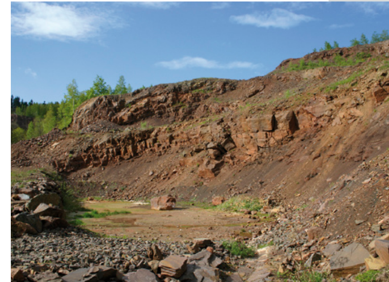
Lom Rožmitál u Broumova

„Přírodě blízká obnova lomu Rožmitál u Broumova“ na workshopu JU České Budějovice.