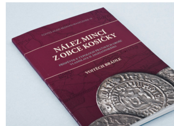
Publikace Nález mincí z obce Kosičky

Zpracování libreta expozice v Muzeu války 1866 a textu pro propagační materiál.