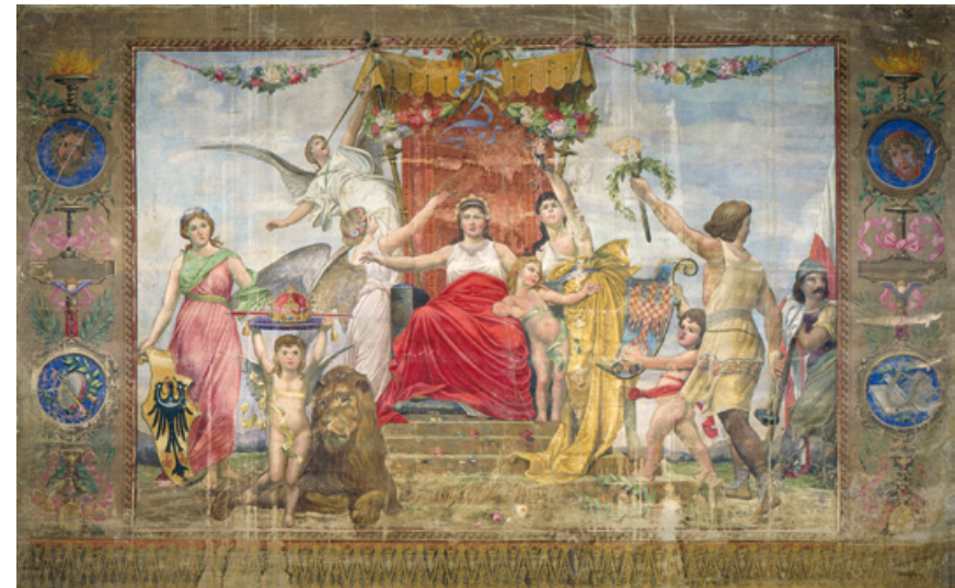
Opona divadelního spolku Tyl z Kuklen - Hold matce Vlasti, autor neznámý, 1893

Probíhala také spolupráce s televizí RTA a TV Prima.