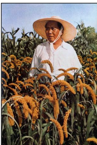
Obrázek 1 Mao Ce-tung na inspekci porostu béru (Barmé, 2009)

Agrární komora České republiky vydala k této problematice článek „Chybí řešení proti suchu“, otištěno v týdeníku Zemědělec (Línková, 2012), kde je zdůrazněna potřeba dlouhodobých a systémových opatření, kde je zmíněn bod o zapojení státu do šlechtění nových typů plodin tuzemského původu. Také MZe (2014) ve své publikaci „Český venkov a zemědělství v podmínkách měnícího se klimatu - Přizpůsobení českého zemědělství a venkova na dopady změny klimatu“ poukazuje na využití některých netechnických opatření. Jako první uvádí šlechtění a výběr odolnějších druhů a odrůd, které se lépe přizpůsobí dostupnosti vody a které jsou odolnější vůči novým klimatickým podmínkám.