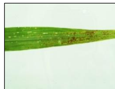
Obrázek 10 Okus listu kohoutkem