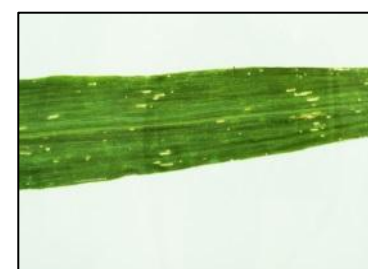
Obrázek 11 Okus listu dřepčikem