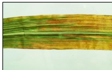
Obrázek 8 Žloutnutí listu