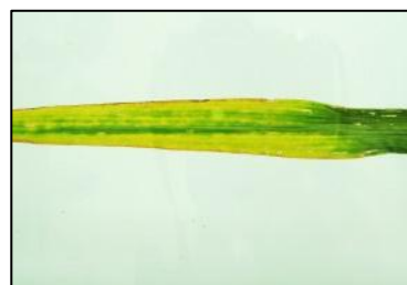
Obrázek 9 Chloróza listu