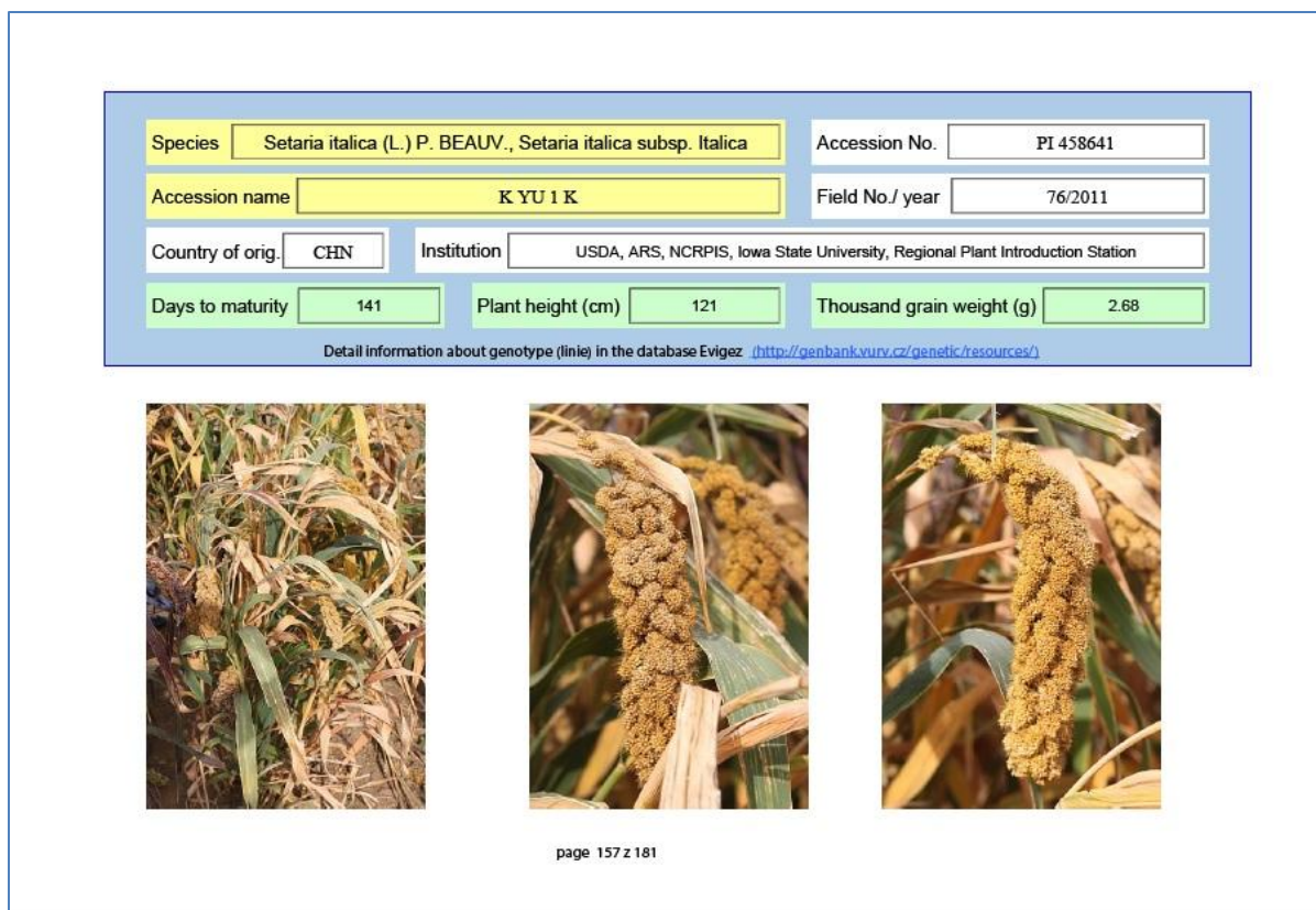
Obrázek 6 Ilustrativní obrázek jedné strany katalogu

Na základě práce s GZ béru byly z širokého souboru vybrány genotypy béru, které byly dále selektovány. Ze selektovaných rostlin vznikla na pracovišti VÚRV, v.v.i. odrůda RUBERIT, která je právně chráněná podle zákona 408/2000 Sb. o ochraně práv k odrůdám, ve znění pozdějších předpisů. Tato perspektivní odrůda béru vlašského rozšiřuje možné portfolio pěstovaných plodin pro zemědělskou praxi k využití pro tvorbu biomasy. Zrno je vhodné pro lidskou výživu podobně jako jáhly. Neobsahuje lepek, takže je vhodné i při bezlepkové dietě. Druhý materiál vhodný do podmínek ČR je v současné době ve zkouškách ÚKZÚZ. Tabulka 3 uvádí vybrané hodnoty stanovené u obou materiálů.