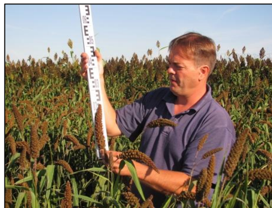
Obrázek 5 Hodnocení GZ béru v GB VÚRV, v.v.i. Praha

V ČR se šlechtění provádí pouze ve Výzkumném ústavu rostlinné výroby, v.v.i. (VÚRV, v.v.i.) v Praze. V Genové bance (GB), která je součástí VÚRV, v.v.i., se nachází kolekce genetických zdrojů béru. Pro jeho šlechtění je využívána selekce. V roce 2014 byla udělena ochranná práva (č.47/2014) k odrůdě béru RUBERIT. Tato perspektivní odrůda béru vlašského rozšiřuje možné portfolio pěstovaných plodin pro zemědělskou praxi k využití pro tvorbu biomasy, ale i pro lidskou výživu (zrno) a výživu