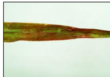
Obrázek 7 Červenání listu béru

Sklizeň béru na zrno provádíme v plné zralosti, neboť porosty dozrávají poměrně jednotně a obilky z laty nevypadávají. Protože obilky jsou velmi drobné, musíme výmlat provádět vysokými otáčkami s dostatečně staženým mláticím košem. Nebezpečí poškozování obilek je minimální. Zrno je po sklizni v některých letech nutné dosušit. Při pěstování béru na zelenou hmotu provádíme sklizeň v době začátku metání nebo až plného metání. Dřívější sklizeň je nežádoucí, neboť snižuje výnos hmoty z jednotky plochy, při pozdější sklizni obsahuje rostlina značné množství vlákniny a je hůře stravitelná. Zelenou hmotu můžeme zkrmovat přímo, nebo silážovat, nebo sušit na seno. V rámci České republiky byly ověřovány možnosti pěstování netradičních letních mezplodin jako bér vlašský a proso seté (Hermuth et al. , 1997), přičemž u béru vlašského je nutné zajistit dostatečně dlouhou vegetační dobu porostu (93 – 119 dní) pro tvorbu biomasy. Hektarové výnosy zrna béru kolísají podle pěstitelských podmínek a úrovně agrotechniky od 1,5 do 4 t.ha -1 . Při pěstování na zelenou hmotu získáváme 20 – 55 t.ha -1 , ze které můžeme sušením získat 5 – 15 t sena.