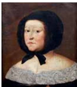
Décolleté, před 1669