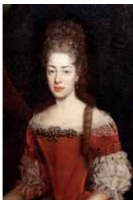
Vyčesané vlasy s hadí lankou, přelom 17. a 18. století