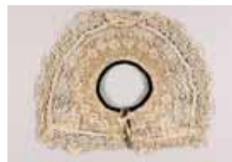
Paličkové rabato s podpinkou, 30. léta 17. a 19. století