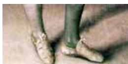
Prořezávané přezůvky s mašlemi, typ slip on shoe, 1584