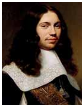
Velký ložený límec lemovaný krajkou, 1660