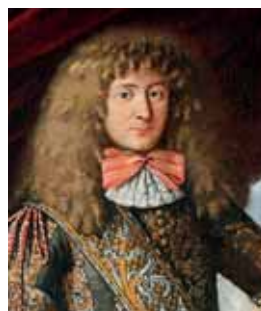
Bohatě zkadeřaná paruka, 1676