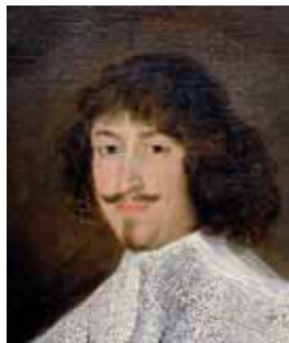
Polodlouhé vlasy podle francouzské módy, 30.–40. léta