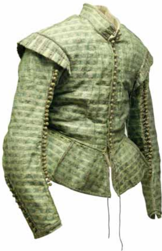
Pánský kabátec, začátek 17. století, hrad a zámek Český Krumlov

Nejen u vojáků byl oblíbený klobouk s širokou kreprou a nízkým dýnkem (něm. Schlapphut ). Hlavním materiálem na výrobu klobouků byly zaječí a bobří chlupy. Kvalitní bobří klobouk, který odolal i největšímu dešti, se nazýval castor . Pomocí páry se