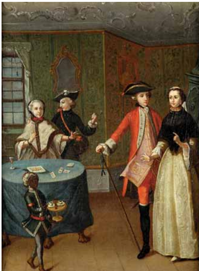
Neznámý mistr, Chvilka pro pití kávy, po 1760, zámek Konopiště

méně formální šaty se zdůrazněným pasem, robe à la polonoise měly zdviženou svrchní sukni otevřenou do stran a vykasanou. 102 Šaty šlo prakticky rozdělit na uzavřené a na otevřené, kde se vkládala tzv. náprsenka a byla viditelná spodní sukň. Náprsenky byly vyráběny jako trojúhelníkovité vložky z kartonu potažené látkou nebo přímo z želoviny či slonoviny, vždy však bohatě zdobené mašlemi nebo výšivkou. Do dekoltu se upevňovaly pomocí háčků nebo špendlíků. Živůtek měl hluboký dekolt lemovaný krajkou nebo dekorativně skládanými stuhami, motivy se pak opakovaly i na sukni.