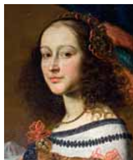
Volný zkadeřený účes, polovina 17. století