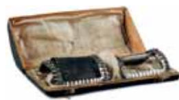
Přezky na pánské střevíce, 18. století