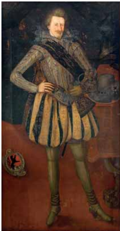
Christof Ammon, Přemysl II. ze Žerotína, 1618, zámek Velké Losiny