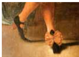
Černé střevíce s červeným podpatkem, kolem 1652