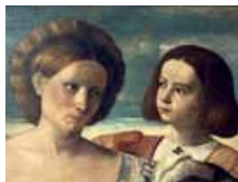
Balzo a účes na anděla, 20. léta 15. století