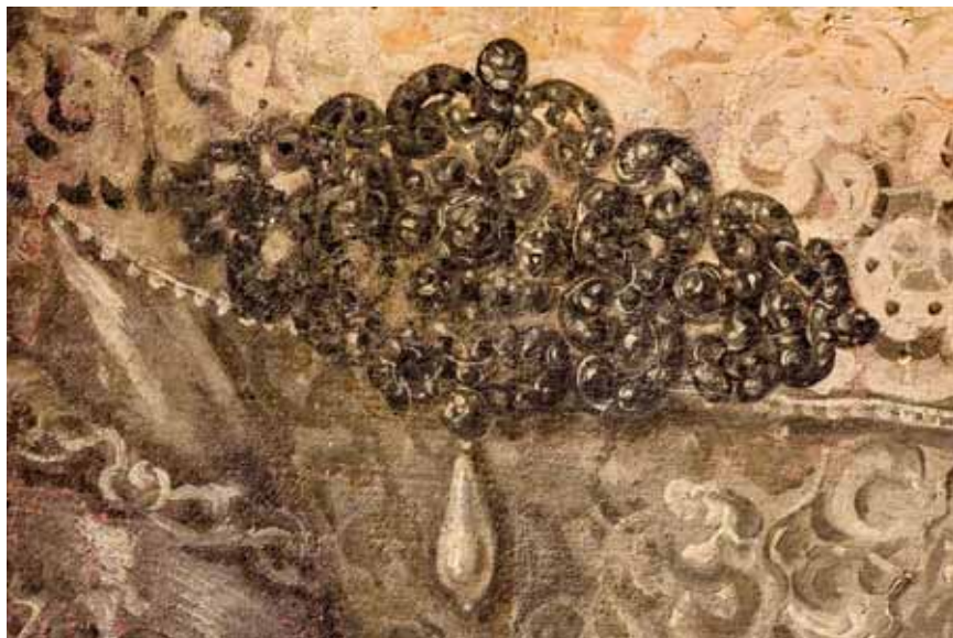
Středoevropský malíř, Neznámá dáma z rodu Žerotínů, přelom 60. a 70. let 17. století, zámek Velké Losiny

hned několik ochranných funkcí. 246 Dětem byly dávány přívěsky ze surového korálu, kuličkové náhrdelníky a náramky. Často dostávaly na hraní tzv. chrastítka. Ty tvořila stříbrná ručka s rolničkami, v horní části osazena větvičkou korálu. Záměrně býval vybírán korálový úlomek bez bočních výrůstků. Chrastítka, která se dochovala v několika evropských a amerických muzeích, nesou totiž známky okusování. Jejich tvar ani funkce se prakticky neměnila až do 19. století, kdy mizí. Kromě korálového se setkáváme s typem, který je osazený vlčím zubem. Zub tohoto zvířete měl ochraňovat před uříknutím, ale i před úrazy hlavy a bolestí zubů. Jediné dochované chrastítko na našem území nalezneme v Slezském muzeu v Opavě. 247 Chrastítko je 12 cm dlouhé, vyrobené ze stříbrného plechu a osazené kančím (?) zubem. Je sice datované až do 18. sto-