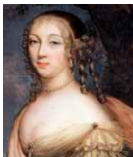
À la maintenon, 60. léta 17. století