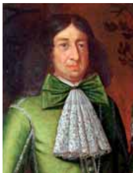
Vázanka z krajky a barevné stuhy, poslední čtvrtina 17. století