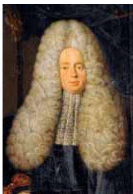
Alonžová pudrovaná paruka, 1. čtvrtina 18. století