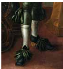
Černé střevíce se zelenou mašlí, 60. léta 17. století,