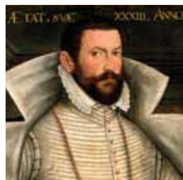
Krátký zástřih s konzervativní bradkou, 60. a 70. léta 16. století