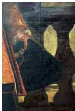
Tricorne (konec 17. století – 18. století)