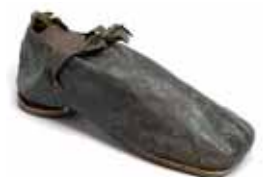
Pánský střevíc, počátek 17. století