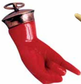
Higa, 18. století (?), zámek Buchlovice