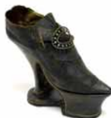
Dámský Koturn , 1680–1720