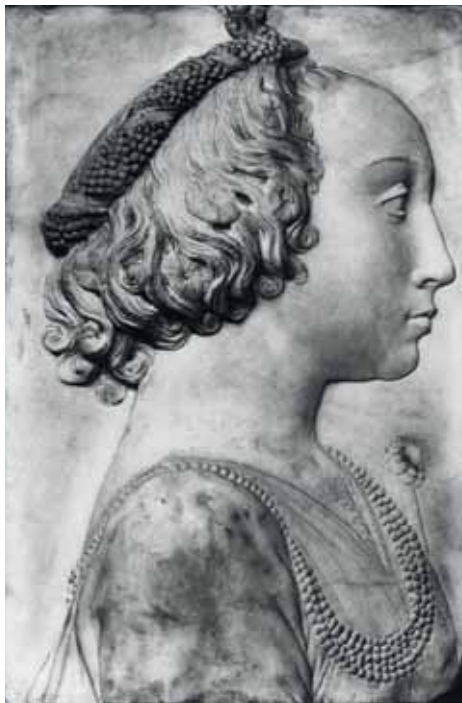
Andrea del Verrocchio – dílna, Beatrice Aragonská, 60.–70. léta 15. století, zničeno během 2. světové války

Základem mužského oděvu byla giornea , krátký zřasený plášť, a její prodloužená verze se šněrováním se nazývala tappert . Nosily se dlouhé pláště zimmara , dogaline i dlouhé lucco s kapucí. Italští muži oblékali speciální punčochové kalhoty opatřené podešvemi, které sloužily i jako obuv. Obouvali však také vysoké holínky, sahající do poloviny lýtek. Důležitým kouskem oděvu se stala košile, která již není ukrytá pod svrchním oděvem. Stala se rovnoprávnou součástí standardního šatníku a až do 18. století téměř nezmění střih. Košile se šily z luxusního plátna a zdobily výšivkou. Vlasy muži nosili delší, natočené tzv. na anděla , ale také velmi krátké, na kštici . Na konci 15. století se dlouhé vlasy staly poznávacím znakem mužů ze záalpských zemí, naproti tomu v Itálii byl stále upřednostňován střední sestřih vlasů natočených pomocí horkého železa.