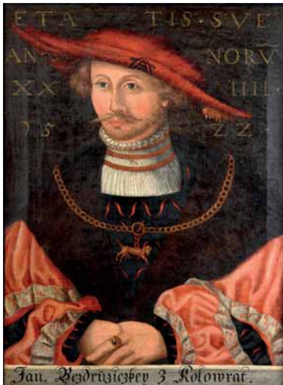
Jan Bezdružický z Kolowrat, (kopie podle originálu z 1522), zámek Březnice

v měšťanském prostředí. Na počátku 16. století byly velmi těsné nohavice nahrazeny kalhotami a punčochami. Kalhoty, tzv. plundry , se šily z dvojího materiálu, přičemž jemný spodní se vytahoval skrze rozparky ven. Tuto podivnou módu vyvlačovaných oděvů snad inicializovali na počátku 16. století lancknechti, kteří na sebe při válečném tažení navlékali ukořistěné oděvy a ty menší museli rozřezat. Typicky německé přežávané a vyvlačované plundry byly u nás velmi populární, a to i po jejich zákazu v roce 1558, kdy byly na Českém sněmu označeny jako „ ostudný oděv “. 56 První punčochy byly šité z pevného materiálu, byly vyráběny přesně na míru a musely je přidržovat podvazky. Jako materiál sloužila nejen látka, ale dochovaly se punčochy kožené i nejstarší hrubě pletené. Punčochy si zpočátku zachovaly kontrastní barevnost nohavic, ale k polovině 16. století se objevovaly stále častěji sladěné s celým oděvem.