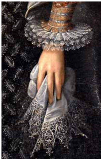
Kapesník – Španělský malíř, Isabella Clara Eugenia, kolem 1600, zámek Opočno

z jemných látek, velmi populárními materiály byly jelenice, teletina nebo kozinka. Zpočátku byly hladké, postupně se ještě více tvarově zjemnily a výšivka se rozprostřela po celé délce. Na konci 18. století byly dokonce potištěné ornamentálními i figurálními motivy. Na portrétech lze velmi těžce rozeznat, zda se jedná o rukavice textilní, nebo kožené, důležitější je tvar.