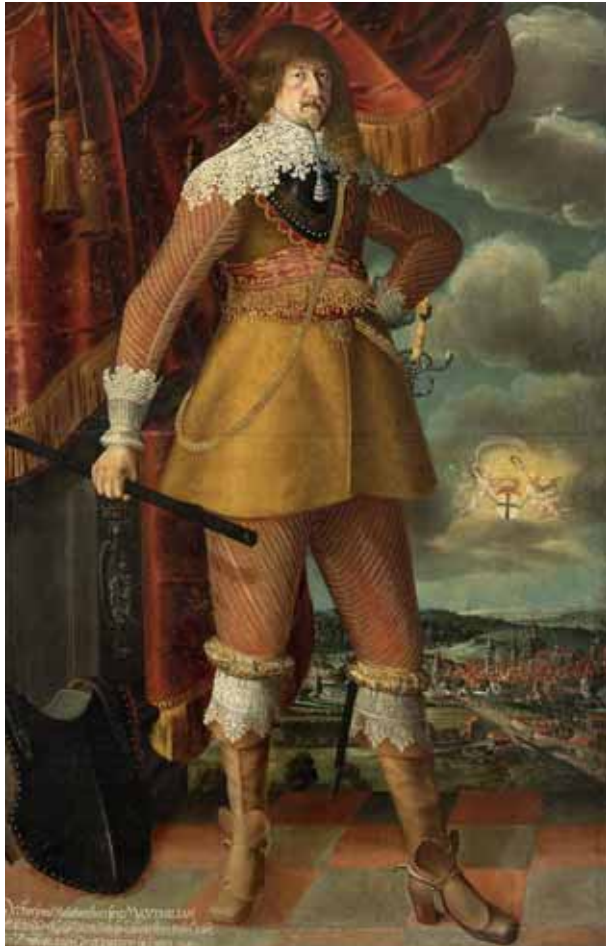
Maximilian Willibald von Waldburg-Wolfegg, kolem 1640, zámek Konopiště

Dámy si i v raném baroku nadále zakrývaly hlavy čepci. Kromě nich se stále objevovaly také oblíbené bílé roušky. Ty však na počátku 17. století působily velmi konzervativně a najdeme je hlavně u starších žen. 83 Právě bílá rouška se stala již v průběhu 16. století součástí vdovského oděvu. 84 Kromě tohoto zavítí se v průběhu 17. století v období smutku nosily rozměrné tylové čepce, v druhé polovině století černé závo-