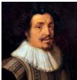
Nekulmované okruží, okolo 1610