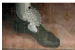
Pánský střevíc s rozetou, po 1612