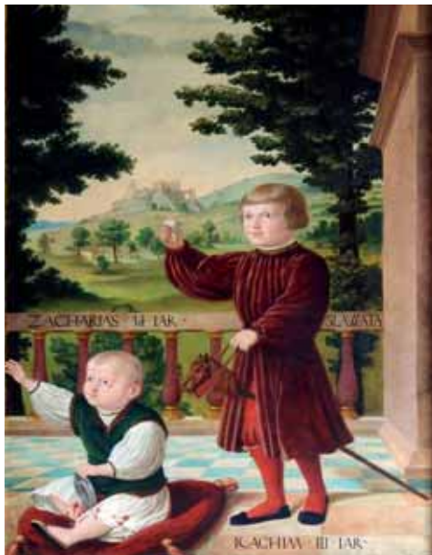
Jacob Seisenegger – kopie, Zachariáš a Jáchym z Hradce, 1529, zámek Jindřichův Hradec

omotání se používal druhý zdobený pruh, který byl širší a kratší. Svrchní povijany mohly být vyšívané nebo lemované krajkou. Toto zavjívání mělo velmi dlouhou tradici, už od středověku. Dítě bylo zamotáno tak, že připomínalo vánočku. Věřilo se, že zafixováním tělíčka v této poloze se zpevní svaly a dítě bude zdravé. 207 Hlava se překrývala malou čepičkou – karkulí .