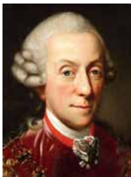
Paruka, polovina 18. století