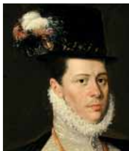
Krátký zástřih podle španělské módy, 80. a 90. léta 16. století