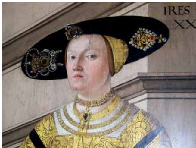
Jacob Seisenegger, Anna z Rožmitálu, 1529, zámek Telč, původ zámek Strážnice

Kromě geometrických, ornamentálních nebo rostlinných kompozic s drahými kameny a perlami najdeme mnoho přívěsků s náměty z mořské říše – delfíni, nereidy, mořské víly, tritóni, okřídlení mořští koníci a nejrůznější mořské stvůry. Ve Španělsku vzniklo také velké množství závěsů ve tvaru lodě – karavely. Všechny šperky spojené tematicky s vodou sloužily pravděpodobně také jako amulety chránící na dalekých cestách. Od druhé poloviny 16. století byly velmi populární zvířecí přívěsky. Objevují