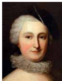
Řasený obojek, polovina 18. století