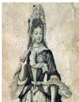
Dámské steinkerke, kolem 1700