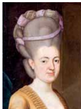
Vysoký zpevněný účes, 70. a 80. léta 18. století