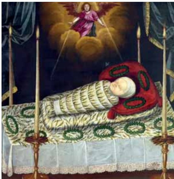
Anonymní moravský malíř, Mrtvé dítě na katafalku (Úmrtní portrét Marie Angeliky nebo Marie Josefy ze Žerotína (?), 1665 nebo 1670, zámek Velké Losiny)

Oděv pro děti byl ve sledovaném období 16. až 18. století velmi jednoduchý a do věku 5–7 let stejný pro chlapce i dívky. Novorozeně bylo vybaveno plenou, oblečeno do košilky a čepečku, zavinuto do kusu látky ve tvaru čtverce, poté omotáno povijanem . Tento asi 10 centimetrů široký pruh byl dlouhý až 3 metry. Na svrchní