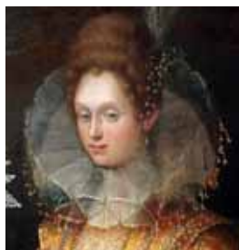
Transparentní okruží, kolem 1600