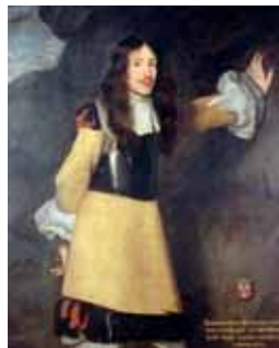
Koller s rukávý

Macaroni – první výstřední dandyové, provokující svým vzezřením i chováním (Velká Británie, 70. léta 18. století)