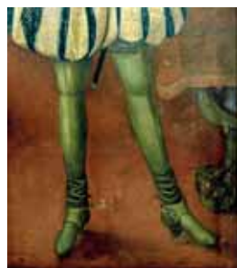
Holínky s vytaženou manžetou a ostruhovými plátky, 1618