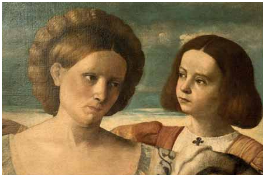
Bernardo Licinio, Dáma s chlapcem, 20. léta 15. století, hrad Štenberk

Ideálem byla plavovlasá žena s bílou pletí, přesný opak tmavovlasých Italek. 51 Ty si vlasy vybělovaly na slunci za pomoci citronové šťávy a klobouku zvaného solana nebo účesy doplňovaly přímo prameny surového hedvábí. Módní bylo vysoké čelo, vytrhané obočí a jednu dobu i doslova „oškubané“ krátké vlasy. 52 Setkáme se však i se složitými účesy do drdolu – balzo nebo dlouhými vlasy přitaženými věncem zvaným ghirlanda .