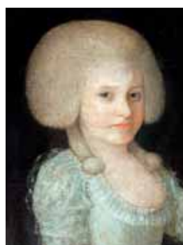
Tupírovaný účes, kolem 1790