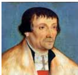
Kolbe, okolo 1534