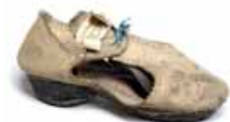
Dámský střevíc, počátek 17. století