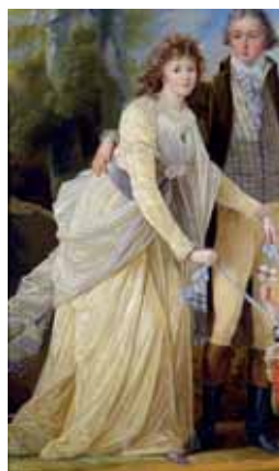
Chemise à la reine