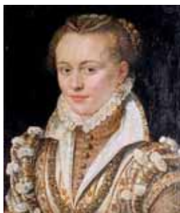
Dámský účes podle italské módy, kolem 1580