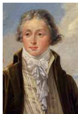
Hladká vázanka, 90. léta 18. století