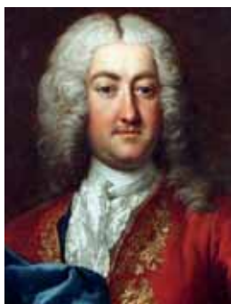
Krajková vázanka, 1733