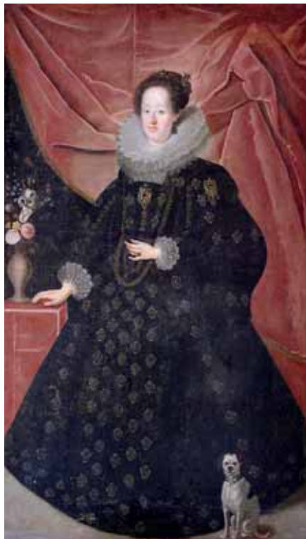
Justus Sustermans – dílna, Eleonora Gonzaga, 1630, zámek Hrádek u Nechanic

během výrobního procesu dosahovalo stále větší hustoty chlupů, a tím i větší voděodolnosti. V průběhu století se objevily také vysoké klobouky zvané capotain . V první polovině 17. století najdeme na mužských portrétech velké množství šerp, které se uvazovaly nejen přes rameno, ale také kolem pasu. Dlouhý pruh látky byl bohatě vyšívaný a lemovaný krajkou. Byl to jeden z vojenských prvků, které pronikly do dvorské módy, a v druhé polovině 17. století se tyto šerpy začaly uvazovat horizontálně do pasu. U dvora se kromě nízkých zdobených střeviců díky dlouhotrvajícím válečným konfliktům běžně nosily i vysoké jezdecké boty.