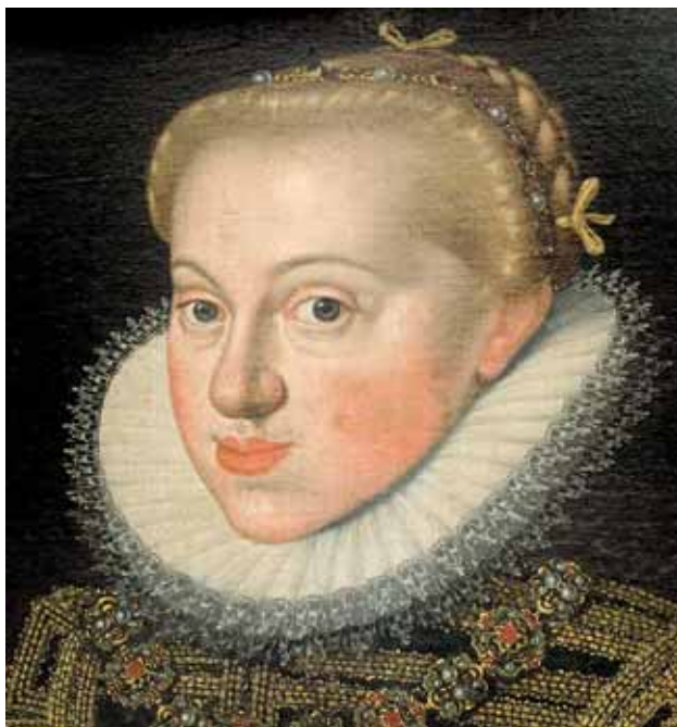
Jacob de Monte – kopie, Rakouská arcivévodkyně Kateřina Renata, po 1591, zámek Velké Losiny

Ačkoliv pořízení paruky bylo velmi nákladné, nikdy nezůstalo jen u jedné. Se zmenšováním paruk po roce 1700 postupně klesala i cena. Zatímco alonžová paruka mohla v době Ludvíka XIV. stát až tisíc écus, tak v průběhu 18. století se dala nízká paruka v Paříži pořídít i za 20–35 livrů. 121 Čím více klesala cena, tím mohutněji se šířily paruky směrem dolů po společenském žebříčku.