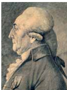
Paruka ailes de pigeon, kolem 1790