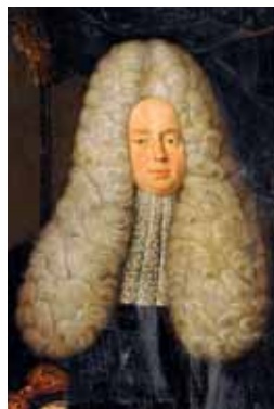
Paruka Grand lion

Plundry – kalhoty tvořené z pásů, mezi kterými je vyvlačo-