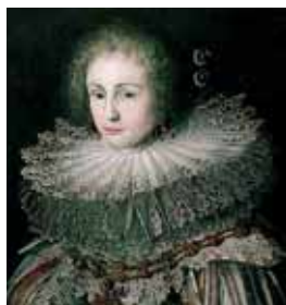
Mlýnský kámen, konec 30. let 17. století