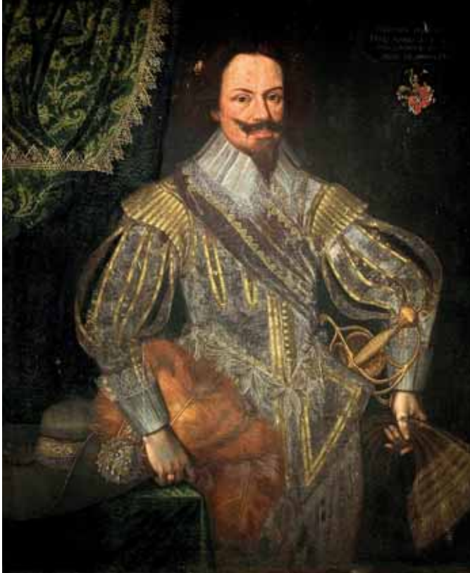
Neznámý mistr, Portrét člena rodu Lilgenau, 1630, zámek Velké Losiny

na oděvu obou pohlaví, ale také na portrétech a jejich četnosti. Zatímco dvacátá léta jsou na portréty velmi chudá, ve třicátých letech počet roste, ale převažují menší formáty, tak od konce čtyřicátých let se znovu objevují portréty v celé postavě. Vodítkem pro popis a datování oděvu tohoto období je hned několik. U mužského portrétu hraje velmi důležitou roli účes a límec. Ve dvacátých letech se ještě setkáváme s okružím a kratšími vlasy, ale ve třicátých letech postupně převažují ploché límce lemované krajkou a účes ze zkadeřených vlasů se prodlužuje. Kabátec třicátých let reaguje na francouzskou módu s rukávy z pásků, převážně však až do poloviny století