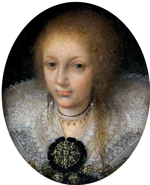
Německá škola, Polyxena z Lobkowicz, rozená z Pernštejna, kolem 1605, Lobkowiczské sbírky, Lobkowiczský palác, Pražský hrad

přehozy zvané bernia . 75 Ty původní ještě s otvory pro ruce, ale později pouze obdélný lehoučký závoj, do kterého se ženy halily a jehož jeden konec byl upevněn u pasu. Nalezneme ji překvapivě i v českém prostředí. Tento lehoučký a luxusní přehoz má na sobě na svém portrétu Anna Černoorská z Boskovic.