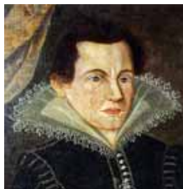
Středoevropská varianta – golilla s karajkou, 1610