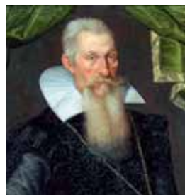
Golilla, 1. třetina 17. století