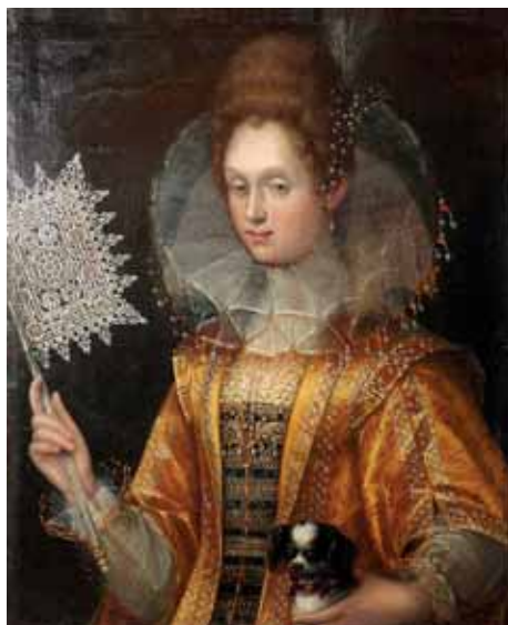
Vějíř – Italská dáma s vějířem, konec 16. století, zámek Lysice