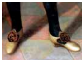
Pánské střevíce s rozetami, začátek 17. století