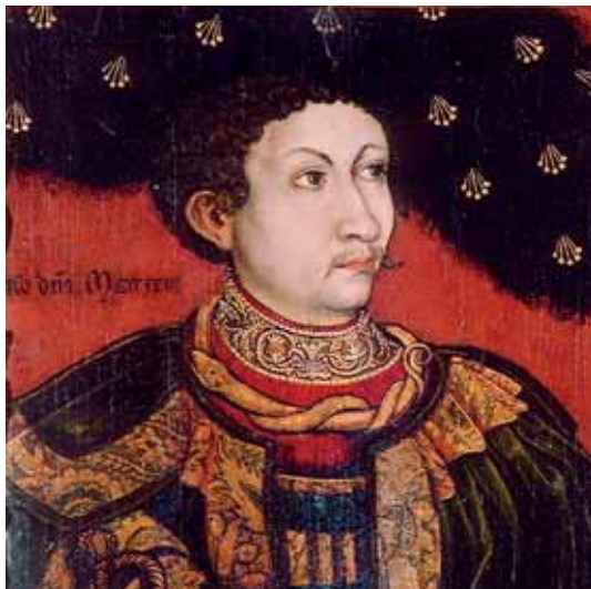
Neznámý mistr, Portrét šlechtice, kolem 1530, zámek Opočno

Košile měly velmi jednoduchý střih a byly překvapivě dlouhé. Pozornost krejčích a vyšivačů se soustředila hlavně na límec a manžety. Košile z počátku 16. století byly zdobeny pouze v lemu, který vytvářel drobný stojáček – límec zvaný německy Koller nebo Goller . V české odborné literatuře se setkáme také s pojmenováním saský límec. Postupem času se výšivka objevovala na stále větší ploše a i límcům je věnováno více pozornosti. Nízký stojáček košile byl později doplněn drobným zřaseným lemem. Vpředu se svazoval pomocí několika ozdobných šňurek, jejichž konce často visely dolů jako ozdoba. Límec se pevně svazoval do kompaktního tvaru nebo ponechával mírně rozevřený. Rozšíření techniky škrobení v šedesátých letech 16. století umožnilo zvětšení límců a bylo i důvodem jejich oddělení od košile. Z dobové literatury známe samostatné límce, které se ke košilím pouze přikládaly, přišívaly nebo špendlily. 142 Výroba a údržba těchto složitých doplňků byla velmi pracná. Okruží nebo obojky (angl. ruff , něm. Halskrause , Fraise , Kröse , šp. gorguera nebo gran gola ) 143 se vyráběly ze dvou pruhů látky. Kratší pruh obíhal kolem krku a tvořil základ okruží. Druhý pruh se pečlivě skládal do jednotlivých záhybů a našival po obvodu prvního. Na kon-