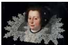
Krajkové rabato s podpinkou, 1630