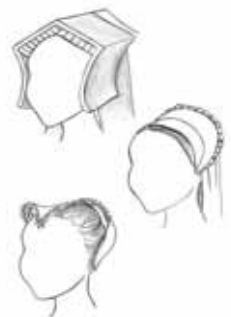
Čepec anglický, francouzský, stuartovský