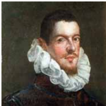
Španělský malíř začátku 17. století, Podobizna španělského šlechtice, Správa Pražského hradu

nejen čistým přírodním (obilným) škrobem, ale na počátku 17. století byly přidávány i barvy. Okružní se záměrně přibarvovala do žluta. Později je na dochovaných rozměrných holandských okružích doložen ještě modrý škrob, který měl opticky látku ještě více vybělit. 145 Při takovémto komplikovaném postupu nelze předpokládat, že by si dvořané své límce nechávali čistit nějak často a také dobové inventáře dokazují, že i přes jejich vysokou cenu převyšoval počet límců počet košil. 146