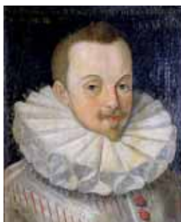
Hladké okruží obšíváné krajkou, 1580