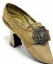
Dámský střevíc z hedvábného rypsu, 70. léta 18. století