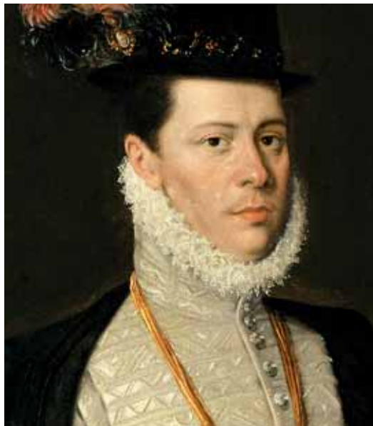
Rolam de Mois, Don Fernando de Aragon, kolem 1584, Lobkoviczké sbírky, Lobkoviczký palác, Pražský hrad

17. století a kolem roku 1700 byly naprostou nezbytností. Někteří muži sice nějakou chvíli váhali a nechali si vyrobit první paruku tzv. na zkoušku , jiní se na nový módní trend vrhli. Deník Samuela Pepyse z Londýna dokumentuje, že nová móda mohla v mnoha lidech vyvolávat smíšené pocity. 114