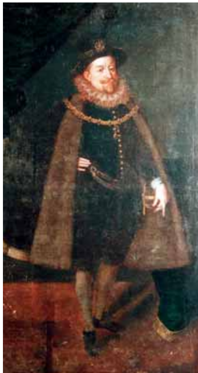
Neznámý mistr, císař Matyáš, zámek Hrádek u Nechanic