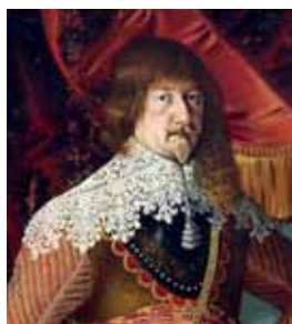
Ložený krajkový límce, 30. a 40. léta 17. století