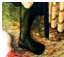
Pánské boty, 1515