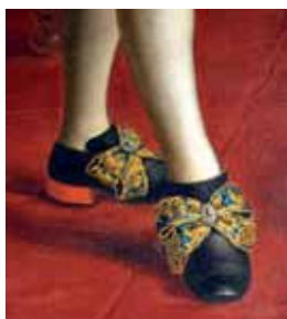
František I. Štěpán Lotrinský, po 1745