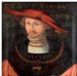
Řasený lem košile, (originál 1522)