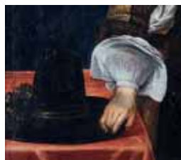
Tacle a klobouk Capotain