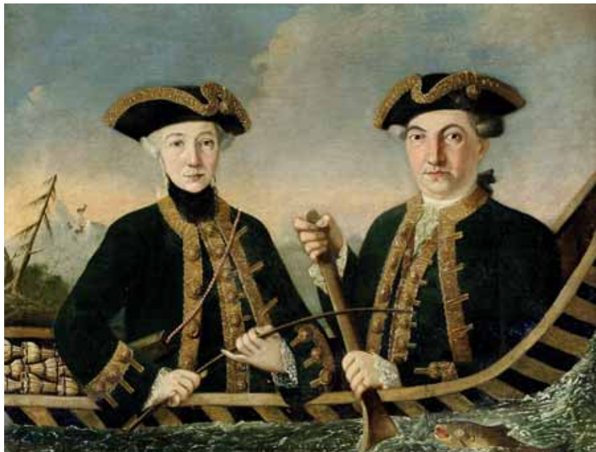
Monogramista A. G. S., Manželé ve člunu, po polovině 18. století, zámek Konopiště

V polovině 18. století se setkáme také s několika praktičtějšími oděvy inspirovanými mužskou módou. Jedním z nich byl tzv. brunswick s kratším živůtkem a sukní, oblíbený cestovní oděv. Živůtek měl zdvojené rukávy, kdy svrchní se u loktů otevíraly do falešných a spodní těsně obepínaly předloktí až k zápěstí. Tento oděv byl často doplněn kapucí lemovanou kožešinou. Dalším zajímavým typem oděvu bylo amazon , určené k jízdě na koni, které se také skládalo z těsného kabátku s klopami přes boky a sukně. Můžeme se setkat také s krátkým kabátkem caraco , který se nosil přes dekorovaný korzet s náprsenkou.