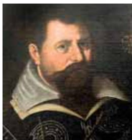
Hladký přeložený límec, 1600