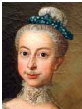
Bichou, polovina 18. století