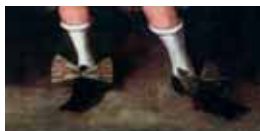
Jan Jiří Jáchym Slavata, 60. léta 17. století