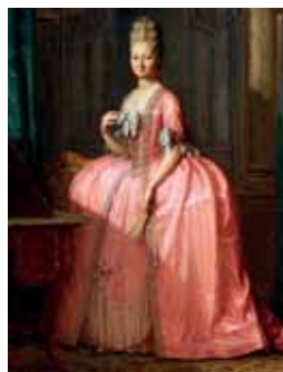
Panier à coudes