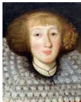
Bouffons, 30. léta 17. století