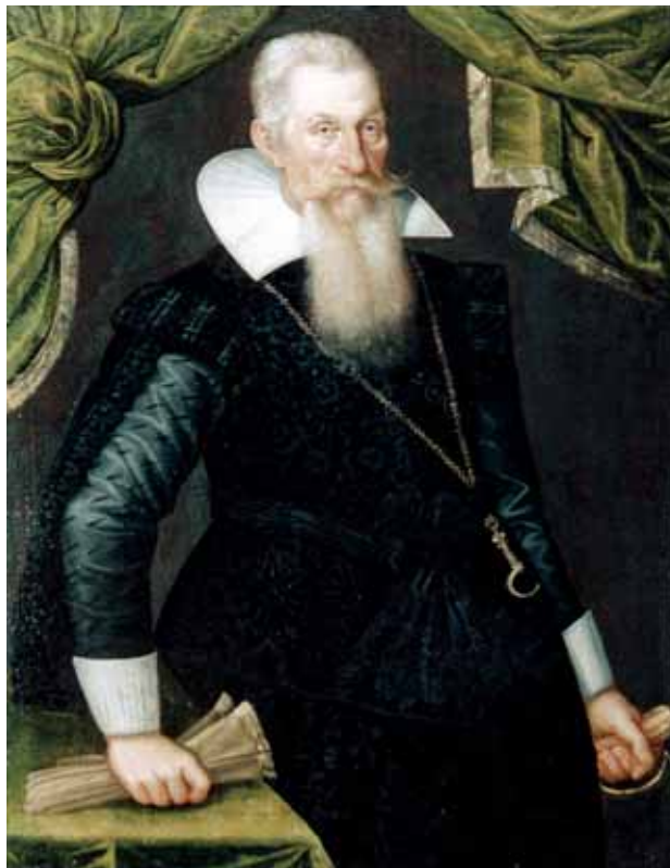
Čistítka zubů – Podobizna šlechtice v černém šatě, 2. čtvrtina 17. století, zámek Náchod

ný hlavně ve Španělsku, které se volbou šperků v 17. století snad nejvíce odlišuje od zbytku Evropy. Individuální a poměrně konzervativní přístup však neznamená opuštění luxusu. Šlo jen o rozhodnutí, že šperk nemusí být čistě okázalý. Devocionální šperky byly nošeny po celé Evropě, tedy nejen v přísně katolických zemích. Už u Erasma Hornicka (1520–1583) nalezneme návrhy na šperky zobrazující Klanění, alegorie Víry, Naděje, Charity. 226 Jelikož na konci renesance jsou rozměrné šperky, například kloboukové aigrette nebo brože, montované z několika částí, zákazník si