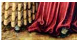
Dámské střevíce, 1515