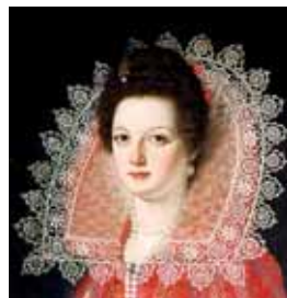
Medici límce, počátek 17. století