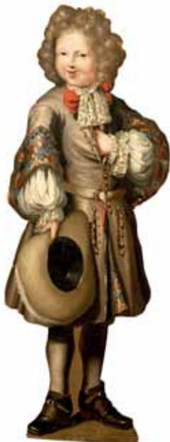
Neznámý mistr, tzv. Tichý společník – postava chlapce, kolem 1700, zámek Velké Losiny