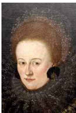
Vysoký tupírovaný účes, počátek 17. století