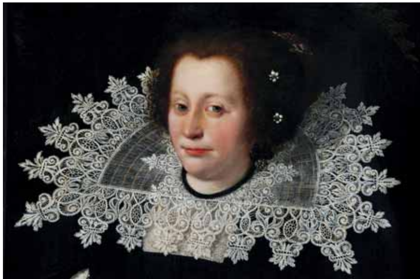
Neznámý mistr, Lavinie Tekla da Gonzaga, 1630, zámek Hrádek u Nechanic

také prýmký. Vzhledem k velké oblibě šité krajky ji paličkováná krajka ve vzorech často napodobovala. Nebyly neobvyklé ani kombinace šitých technik a paličkování na jedné krajce. Největším producentem paličkových krajk bylo od 16. století Nizozemí.