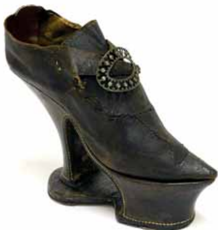
Dámský střevíc koturn, 1680–1720, hrad Buchlov

podpatky, až po klasicky ludvíkovsky tvarované. Pro dámskou obuv byly materiálově preferované luxusní hedvábné textilie. Dámské střevíce se sponami byly na počátku století uzavřenější a zapínání měly umístěno vysoko na nártu. Pozice spon se postupně snižovala a nártový výstřih se prohluboval. Rozdílně tvarovaný byl rovněž jazyk. K vysokému nártu z počátku století byl zpracován ve tvaru lichoběžníku, širší stranou obrácenou vzhůru. Se zvětšením nártového výstřihu se zkrácený jazyk vypracovával se zaobleným horním krajem. Zhruba po polovině 18. století se u střevíců začalo častěji upouštět od zapínání na spony. Nártový dílec byl kompaktní a namísto zapínání se zdobil výšivkou, aplikacemi, skládanými stuhami a dalšími dekorativními prvky.