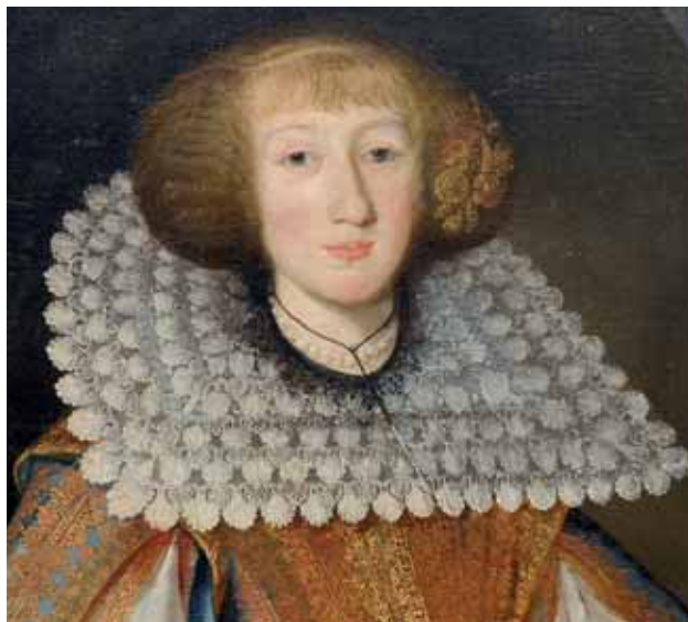
Neznámý mistr, Angelika Sybilla ze Žerotína, druhá polovina 30. let 17. století, zámek Velké Losiny

První parukářské dílny jsou v Paříži doloženy v roce 1656. Již v roce 1673 zde byl založen cech parukářů a počet řemeslníků rychle vzrůstal. Parukářství se dynamicky rozvíjelo po celé 18. století a utlumení nastalo až po Velké francouzské revoluci. Naproti tomu v Čechách není parukářské řemeslo vůbec zdokumentováno. Je předpoklad, že parukáři zde pracovali již v druhé polovině 17. století, ale cechovní doklady máme až z 18. století. 122