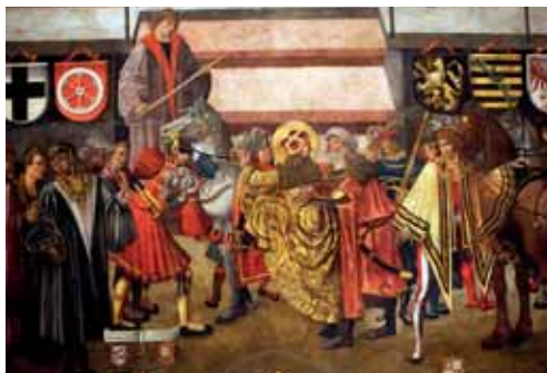
Legenda ze života sv. Václava, kaple sv. Václava, katedrála sv. Víta, sv. Václava a sv. Vojtěcha, Praha

Košile byly volné a dlouhé s bohatě nabíranými rukávy. Kolem krku se objevuje vyšívaný tuhý stojáček – tzv. saský límec . Druhý typ košile tvarově kopíroval hluboký dekolt kabátce či živůtku a lem tvořila zdobená bordura. Ve třicátých letech 16. století najdeme na portrétech první náznaky zřaseného okružní, které však bylo pevnou součástí košile.