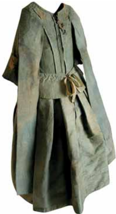
Pohřební oděv Reimunda Josefa z Dietrichsteina, 1682, Regionální muzeum v Mikulově.

do dvou vrstev povijanu. Spodní je bílý, svrchní má zelenou barvu. Kolem krku má černý řetízek s křížkem, který mohl být vyrobený z gagátu.