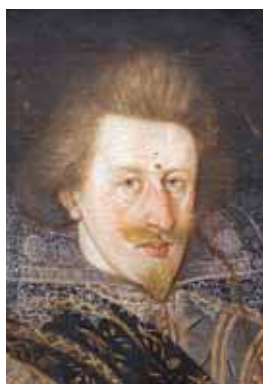
Vyčesané vlasy a liebeslocke, 1618