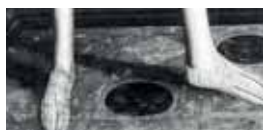
Prořezávané přezůvky, typ slip on shoe, 1570