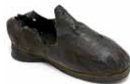
Pánský střevíc, počátek 17. století