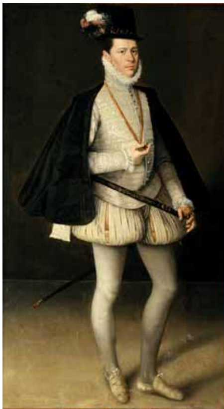
Rolam de Mois, Don Fernando de Aragon, kolem 1584, Lobkowiczké sbírky, Lobkowiczký palác, Pražský hrad

Rozšířená přední část byla zdobena podobně jako oděv prostřihy, které mohly být vyvlačované 189 kontrastním materiálem. Nártové vykrojení je v některých případech na portrétech tak rozměrné, že můžeme uvažovat i o použití podešví opatřených punčoch, které byly běžně užívány o století dříve. 190 V českém prostředí se setkáváme nej-