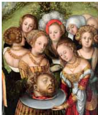
Lucas Cranach st., Stětí sv. Kateřiny, zřejmě 1515, Arcibiskupství olomoucké, Arcidiecézní muzeum Kroměříž