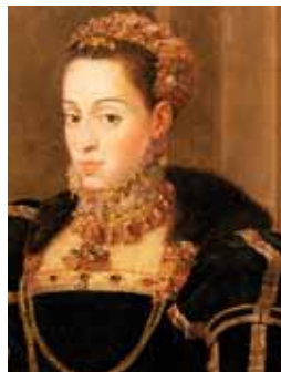
Bleší kožešinka, zibellino

Cadenette – (z fr. ) silný pramen vlasů na levé straně, který spadal až na ramena, někdy býval spleten do copu a ozdoben výraznou mašlí. Pojmenován po francouzském šlechtici Honorém d'Albertovi, vévodovi de Cadenet. V 18. století se tento termín užívá pro cop paruky. (začátek 17. – začátek 19. století)