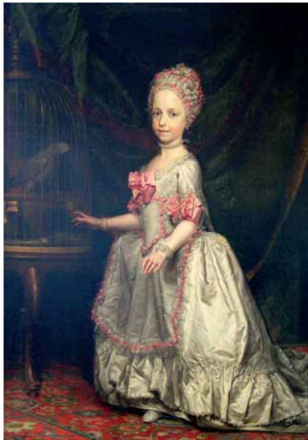
Anton Raphael Mengs - kopie, rakouská arcivévodkyně Marie Terezie, 70. léta 18. století, zámek Krásný Dvůr

nělských královských portrétů z poloviny 17. století. 101 Původně šlo vlastně o konstrukci pěti propojených kovových obručí, které se při chůzi houply. Ihned po zavedení se objevilo několik odlehčených verzí, ale vzápětí se panier znovu začal rozpínat do šířky. Vznikly varianty panier à coudes , demi-panier , considération – speciální skládací konstrukce pro cestování v kočáře.