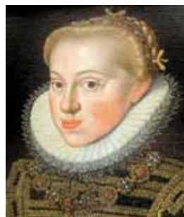
Dámský účes kopírující tvar stuartovského čepce Jacob de Monte, po 1591