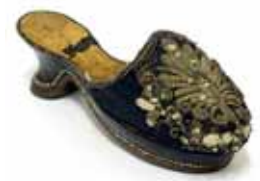
Dámský pantoflíček, 1610–1630