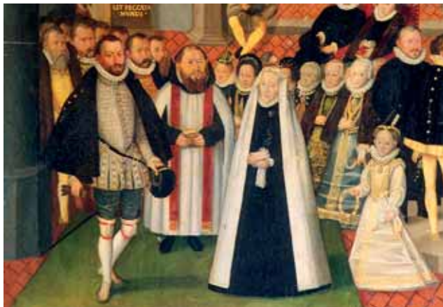
Neznámý mistr, Žerotínský epitaf, 1575, zámek Opočno

bránily okolnosti a nemohl ho mít připnut u pasu, pak ho za něj nesl jeho sluha nebo byl doprovázen ozbrojenou stráží. Klobouk odkládal snad jen v přítomnosti krále.