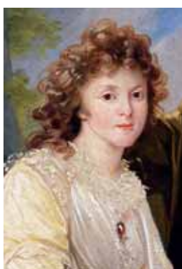
Šátek v dekoltu, 90. léta 18. století,