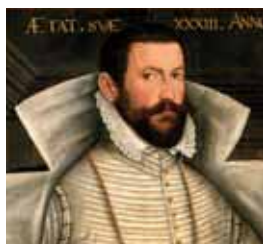
Dělené okruží, 1570