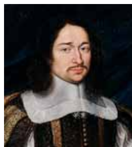
Ploché límce, 50. léta 17. století