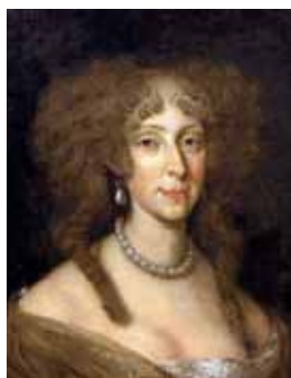
Hurluberlu, 80. léta 17. století