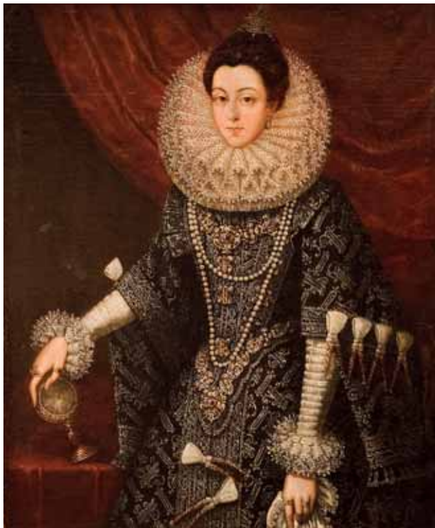
Juan Pantoja de La Cruz, Španělská šlechtična, kolem 1600, zámek Velké Losiny

Kalhoty dosahovaly délky maximálně po kolena, zprvu byly úzké, ale kolem poloviny 16. století se jejich tvar ustálil v podobě pomyslné dýně nebo balonu. Vzorem se staly německé plundry , kalhoty sešívané z pruhů, mezi nimiž se protahovala spodní podkladová látka. Španělské kalhoty se na rozdíl od plunder, které volně splývaly dolů, vyztužovaly do pevné formy. Česky se jim říkalo španělské nebo duté poctivice . 61 Nového balonového tvaru se dosahovalo vycpáváním různým materiálem (žíněmi, koudelí nebo textilními odstřížky), příkládáním válců v pase či při dolním okraji nebo pečlivým vrstvením a prošíváním několika vrstev látek. Délka se držela někde kolem poloviny stehen, ale už v polovině sedmdesátých let zaznamenáváme také vlivy z módy francouzské, tedy zkrácení kalhot k hýždím. Takovéto krátké haut de chausses býva-