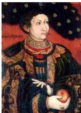
Saský límec, kolem 1530