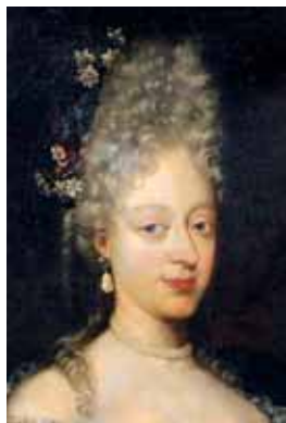
Commode, začátek 18. století