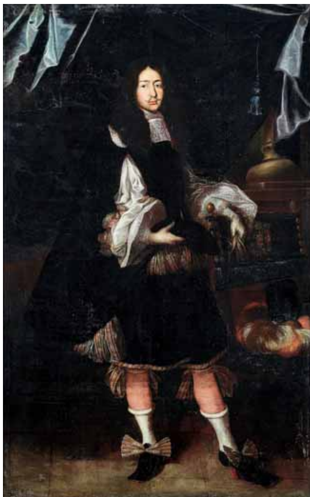
Jan Jiří Jáchym Slavata, 60. léta 17. století, hrad a zámek Jindřichův Hradec

V 17. století vznikla potřeba domácího oděvu, který by odpovídal náročným požadavkům šlechty. Domácí oděv tvořila noční čepička a jednoduchý volný oděv. Zhruba v sedmdesátých letech 17. století se v Evropě objevují pláště zvané „ japonsche rock “ či „ indianische Roch “. První tyto pláště byly vlastně kimona, které se