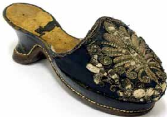
Dámský pantoflíček, 1610–1630, hrad Buchlov

častěji s jednoduchým, téměř lze říci schematickým znázorněním tohoto typu obuvi, a to až od třicátých let 16. století. 191 U zobrazených střevíců převládala tmavá hnědá nebo černá barva. Typická rozšířená hubatá špička se objevila také u pantoflů, v omezené šířce na vysoké obuvi a i na plátových zbrojích.