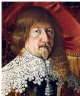
Cadenette bez stuhu, 30. a 40. léta 17. století