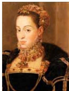
Stojáček s lemem obšitým zlatou nití, kolem 1555