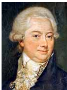
Paruka ailes de pigeon, 70. léta 18. století