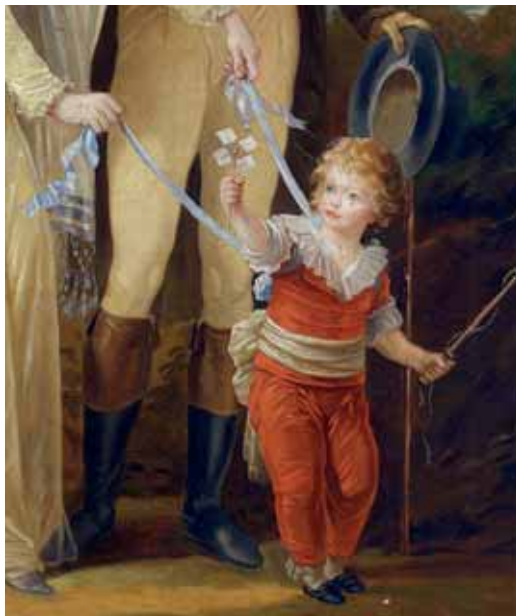
Podle obrazu Heinricha Fügera z roku 1792, Kníže Karel z Liechtensteina s manželkou a synem, 1871, soukromá sbírka

bolika využívána při výrobě amuletů. Velkou popularitu v 17. století získaly diamanty, které byly dováženy převážně z Indie. Francouzský král Ludvík XIV. miloval diamanty a dokázal ocenit jejich kvalitu. Za jeho vlády cestoval královský klenotník Jean-Batiste Tavernier (1605–1689) několikrát do Indie a dovezl do Evropy některé z dodnes nejcennějších diamantů. 218 V Orientu se diamanty cenily v neopracovaném stavu, Evropa si však žádala vybroušení do precizního tvaru. V průběhu století se několikrát změnil způsob výbrusu surových diamantů, od jednoduchých hranolových plošek až po brilantový výbrus složený z 33 faset na horní části a 25 faset na spodní. Účelem vybroušení bylo získat zářivě blyštivý kámen. Posedlost diamanty vedla Ludvíka k přehnaným nákupům, které si však jako panovník mohl dovolit. Jen v roce 1685 nakoupil od klenotníků 118 diamantů. 219 Nosil je osazené ve špercích, ty menší přeměněné na knoflíky nebo osazené do přezek na jeho střevících.