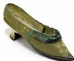
Dámský střevíc ze zeleného hedvábného rypsu, kolem 1780