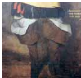
Vysoké jezdecké holínky s širokými okraji, hranatými ostruhovými plátky a ochrannými návleky na punčochy, 1660