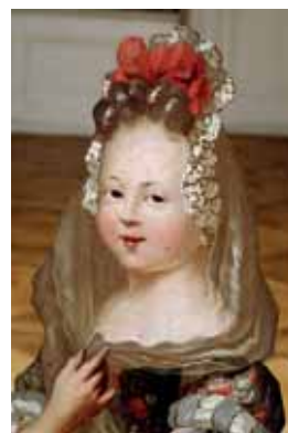
Fontange kolem 1700