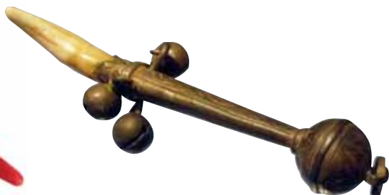
Chrastítko, 18. století, Slezské zemské muzeum Opava

Od konce 15. století rapidně roste zájem o prsteny. V našem prostředí může být důkazem první český šlechtický portrét Nejvyššího kancléře Albrechta Libštejnského z Kolowrat z roku 1506 – na ruce má šestnáct prstenů. Bylo běžné nechat se portrétovat se všemi prsteny, protože poukazovaly na zámožnost svého majitele. Již zmíněný prsten memento mori vlastnil například Petr Vok z Rožmberka. Tento šlechtic věřil v ochrannou moc amuletů a často je také rozdával. Březan popisuje, že Petr Vok dával svým poddaným v listopadu 1579 „prsteny proti padoucnici a psotníku“. 230