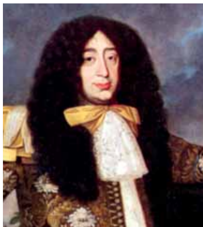
Neznámý mistr, Ferdinand Vilém Eusebius, kníže ze Schwarzenbergu, poslední čtvrtina 17. století, hrad a zámek Český Krumlov

Koncem 17. století se začínají paruky i dámské účesy pudrovat. Tato móda vrcholila na konci 17. století a ovládla celé 18. století. Z této doby jsou doloženy speciální pudrovací místnosti. Jak dokládají grafiky z 18. století, šaty chránil speciální plášť, obličej maska. Do vlasů byla napřed vtírána pomáda, poté naprášen pudr. 118 Ten se vyráběl hlavně z mouky. Její spotřeba však byla obrovská a v Anglii si na počátku 18. století stěžovali, že se na pudr spotřebuje mnohem víc mouky než na pečení chle-