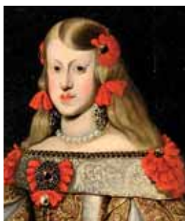
Španělský účes, 3. čtvrtina 17. století.