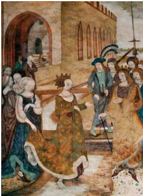
Cyklus královny ze Sáby a krále Šalamouna, Příjezd královny ze Sáby, 1485–1492, Smíškovská kaple, chrám sv. Barbory v Kutné Hoře.

varianta bez rukávů byla nazývána cotta . Živůtek měl většinou rukávy upevněné pomocí šněrování, tak aby se daly podle potřeby měnit. Zámožné dámy nosily půlkruhový plášť ze sukna mantello , česky mantlík. Již kolem roku 1470 se ve Španělsku objevily výztuhy sukní verdugado , které daly charakteristický zvonový tvar sukním 16. století.