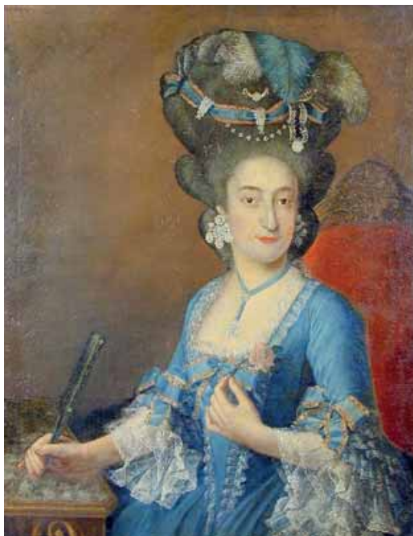
Neznámý mistr, portrét dámy s růží, kolem 1780, zámek Jaroměřice nad Rokytnou

Pánská móda dostala nový impuls v podobě tmavého fraku (fr. fraque ) a krátké světlé vesty. 104 Rozměrný justacorps se zúžil, ztratil rozměrnou suknicí a přední díly začaly v dolní části opticky ustupovat dozadu. Původně vojenský kabát se stal součástí běžného šatníku. Z Anglie se rozšířil do Evropy vlněný dvouřadý jezdecký kabát redingot , doplněný třírohým, později dvourohým kloboukem. Součástí společenské-