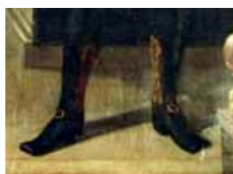
Černé pánské střevíce se zlatou přezkou a zlatě vyšívanými punčochami, Neznámý mistr, začátek 18. století