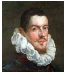
À la confusion, začátek 17. století