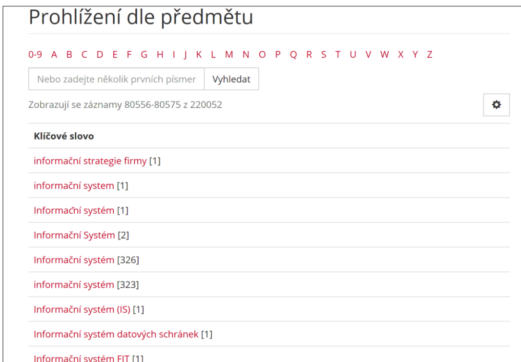
Obrázek 2: Rejstřík "předmětových hesel", aneb autorských klíčových slov k tématu "informační systémy" v repozitáři VUT (anglické ekvivalenty jsou v jiné části abecedy)

Neuspokojivé výsledky vyhledávání českých disertací podle témat v obou národních službách jsou způsobeny tím, že zdrojové záznamy disertací pocházejí z digitálních repozitářů univerzit nebo z databází jejich studijních systémů s tím, že popis témat zajišťují sami autoři (klíčová slova a abstrakta). Znamená to, že i vyhledávání podle témat v lokálních repozitářích vykazuje stejné parametry, popsané výše u národních služeb. Repozitáře nabízejí uživatelům (v aplikaci DSpace či jiné) pod označením "Prohlížení dle předmětu" či jiným označením někdy i delší seznamy termínů označujících totéž – viz ukázka termínů k tématu "informační systémy" z jinak skvěle vypadajícího repozitáře Vysokého učení technického v Brně (VUT).