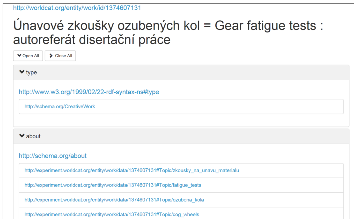
Obrázek 3: Část záznamu tezí české disertace jako díla z experimentálního serveru propojených otevřených dat OCLC

formálních předmětových hesel také dvě tematická hesla z řízeného slovníku CZENAS 10 . Díky spolupráci NK ČR a OCLC je záznam již také v databázi WorldCat ( http://www.worldcat.org/oclc/855464854 ) a v současné chvíli je dostupný i na webu ve struktuře propojených otevřených dat (ve standardech schema.org a RDFa). Záznam tezí citované disertace jako díla je k dispozici volně, má identifikátor URI: http://worldcat.org/entity/work/id/1374607131 . Záznam díla bude propojen na záznamy českých řízených předmětových hesel včetně anglických ekvivalentů (viz blok "about" na obr. 3), jakmile je NK ČR vystaví jako propojená data s příslušnými identifikátory URI. Prozatím se při pokusu na ně klikat objeví anglická zpráva: „This is a placeholder reference for a Topic entity, related to a WorldCat Entity. Over time, these references will be replaced with persistent URIs to... and other Linked Data resources“.