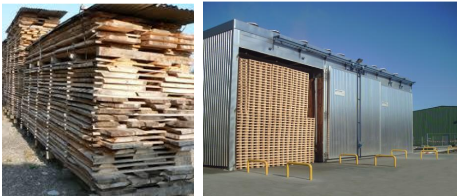
Obr. 1 Ukázka přirozeného sušení dřeva ve venkovních hráních (obrázek vlevo) a umělého sušení v sušárnách (obrázek vpravo).

Co se tedy stane, použijeme-li do soudobě vytápěných prostor dřevo přirozeně sušené? Dojde k deformacím křidel, nebudou dovírat, bude jimi táhnout, popraská lak nebo nátěr a životnost se sníží na několik let bez údržby. Je snad špatné dřevo? Špatná technologie výroby?