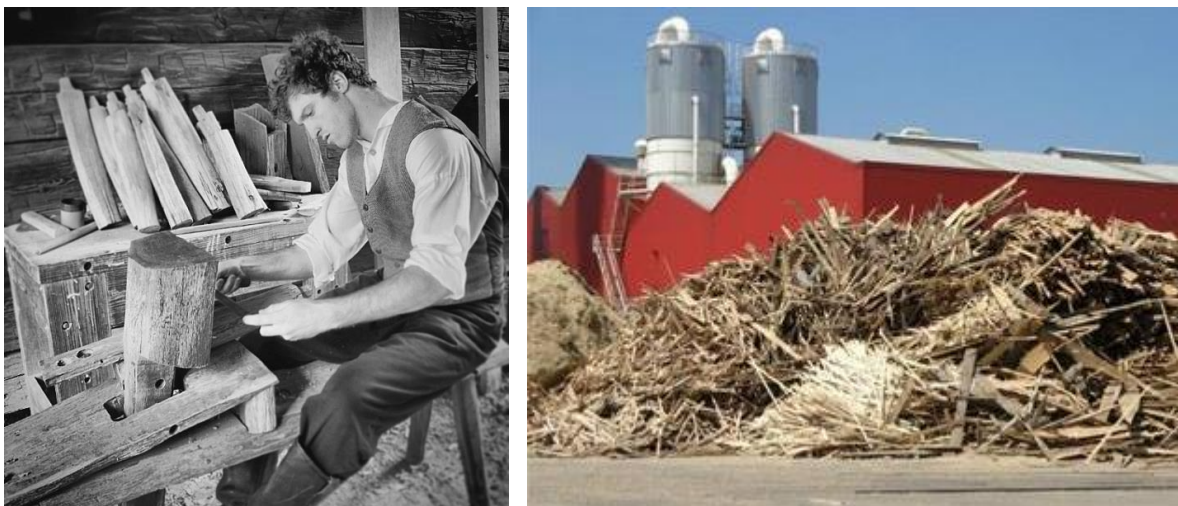
Obr. 5 Pohled na řemeslné zpracování dřeva v dřívějších dobách v kontrastu s novodobou masivní výrobou.

Obecně tedy lze říci, že dřevo je stejné jako kdysi, ale jeho výběr pro použití je ovlivněn naší společností a obchodními modely více, než jeho anatomii či emisemi škodlivin v některých lokalitách.