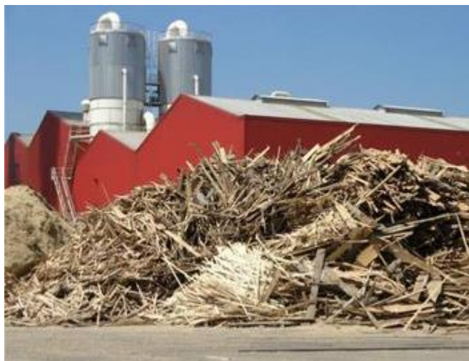
Obr. 5 Pohled na řemeslné zpracování dřeva v dřívějších dobách v kontrastu s novodobou masivní výrobou.

Výzkumný a vývojový ústav dřevařský, Praha, s.p. a firma WOODEXPERT s.r.o. se zabývají posuzováním stavu dřeva, dřevěných výrobků i prvků a konstrukcí ze dřeva a to od nejrůznějších laboratorních zkoušek až po odborné posuzování v terénu.