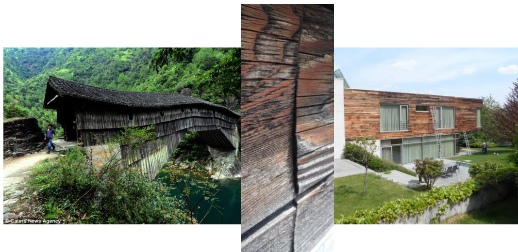
Obr. 3 Životnost dřívějších staveb a dřeva na nich použitého ve srovnání s dnešní stavbou (vlevo 1000 let starý dřevěný most v Číně, Foto Caters News Agency, vpravo 5 let stará budova residence velvyslance ČR v Budapešti, Foto: archiv Výzkumného a vývojového ústavu dřevařského, Praha, s.p.).

Z hlediska péče o dřevěné části historických objektů lze tedy říci, že platí stávající normy, zařídění a požadavky, až do doby, než budou nahrazeny novými. Při volbě dřevin pro výrobu replik a prvků historizujících či nepodléhajících požadavkům na původnost však doporučuji využít především poznatků historických – tedy zvolit materiál, který by dřívější řemeslník tehdy pro tento výrobek použil. A i tato volba je silně geograficky podmíněna a měli bychom vzít v úvahu také druhové složení tamního lesa v době vzniku výrobku.