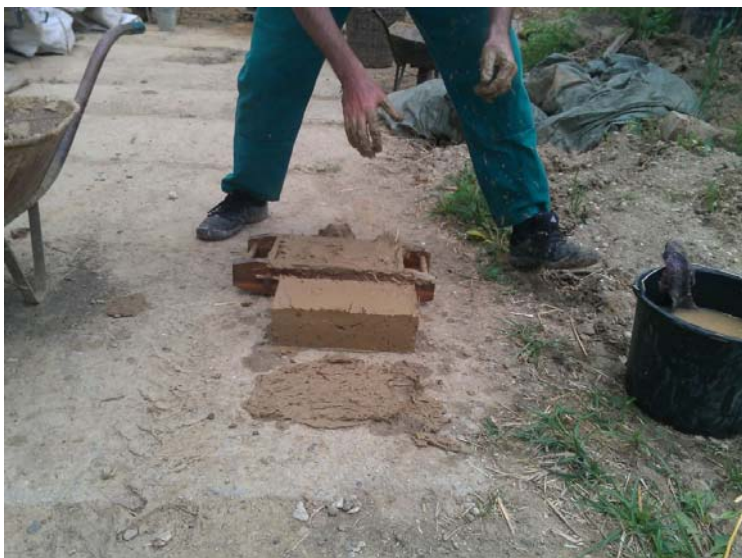
Obr. 1.: Úprava konzistence těsta – výroba zkušební cihly

Výroba hliněného těsta proběhla postupem dle kapitoly 3.3.2.2 pomocí míchačky s nuceným oběhem. Využití míchačky s nuceným oběhem nahrazuje jinak fyzicky namáhavé vyšlapávání. Byl dodržen poměr dávkování jednotlivých složek dle popisu, který je uvedený v metodice. Konzistence těsta byla upravena přidávkem vody tak, aby se zkušební vzorek cihly nedeformoval, viz obr. 1.