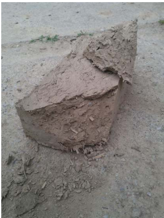
Obr. č. 2.: Test konce sušení

Hodnocení konce sušení výrobku proběhlo na prvku, který byl vyroben s dostatečným předstihem před datem inspekce. Prosušenost cihly byla hodnocena v souladu s popisem uvedeným v metodice a je dokumentována na obrázku č. 2.