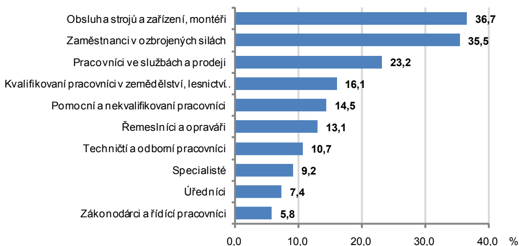
Podíl alespoň někdy pracujících v noci podle hlavních tříd CZ-ISCO v roce 2012

V rámci výběrového šetření každý šestý respondent (po přepočtu téměř 780 tis. osob) uvedl, že alespoň někdy pracoval v referenčním období v nočních hodinách od 23 do 6 hodin. Na rozdíl od večerní práce pracují v tuto dobu mnohem častěji zaměstnanci (přes 18 %) než např. podnikatelé se zaměstnanci (6 %) nebo pracující na vlastní účet (necelých 8 %). Intenzita noční práce zaměstnanců vyplývá v první řadě z toho, jak je v jednotlivých profesích uplatňován režim směnové práce. Alespoň někdy v noci pracovalo téměř 37 % všech pracovníků při obsluze strojů a zařízení (v přepočtu na celou populaci čtvrt miliónu osob) a v tuto dobu pracovala také téměř čtvrtina pracovníků ve službách a prodeji. Často pracují večer i zaměstnanci v ozbrojených silách, jedná se však o nejmenší hlavní třídu klasifikace CZ-ISCO.