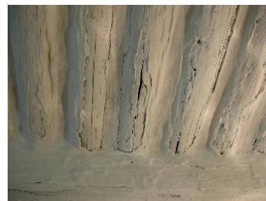
Obr. 1: Opakované líčení stropních trámů, obec Čistá.