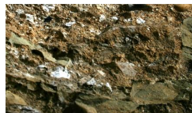
Obr. 3: Vnitřní zdivo románské hradby s maltou plnou vápenných kusů a nedopalů. Pražský hrad.