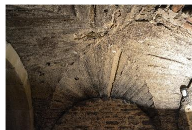
Obr. 2: „Litá“ malta zděné křížové klenby. Krypta románského kostela p. Marie a Sv. Václava, Znojmo.