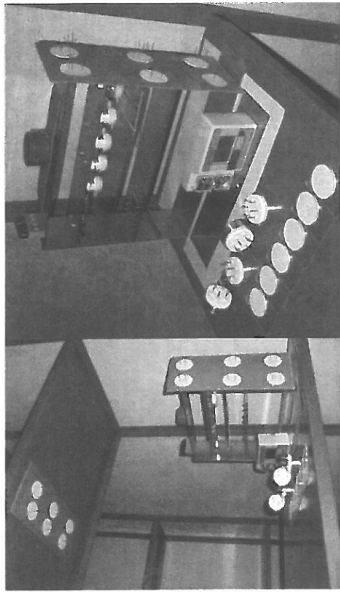
Obr. 1: Příklad umístění pasivních vzorkovačů depozice prachových částic v deponitáři Jihočeské vědecké knihovny na Zlaté Koruně

Jednoduchým způsobem zhodnocení zatížení vnitřního prostředí prachovými částicemi je použití pasivního vzorkovače, na kterém se prach usazuje a jeho koncentrace se následně zjišťuje pomocí iontové chromatografie. Doposud vyvinuté pasivní vzorkovače prachových částic hodnotily pouze příspěvek hrubých částic a zcela zanedbávaly vliv submikronové frakce (Costa a Dubus, 2007; Lloyd a kol., 2007). Nově vyvinuté vzorkovače jsou exponovány v orientaci směřující nahoru a dolů, čímž umožňují posoudit jak celkovou depozici částic pomocí sedimentace a difúze na vzorkovač směřující nahoru, tak i depozici submikronových částic pomocí difúze na vzorkovač směřující dolů (Obr. 1).