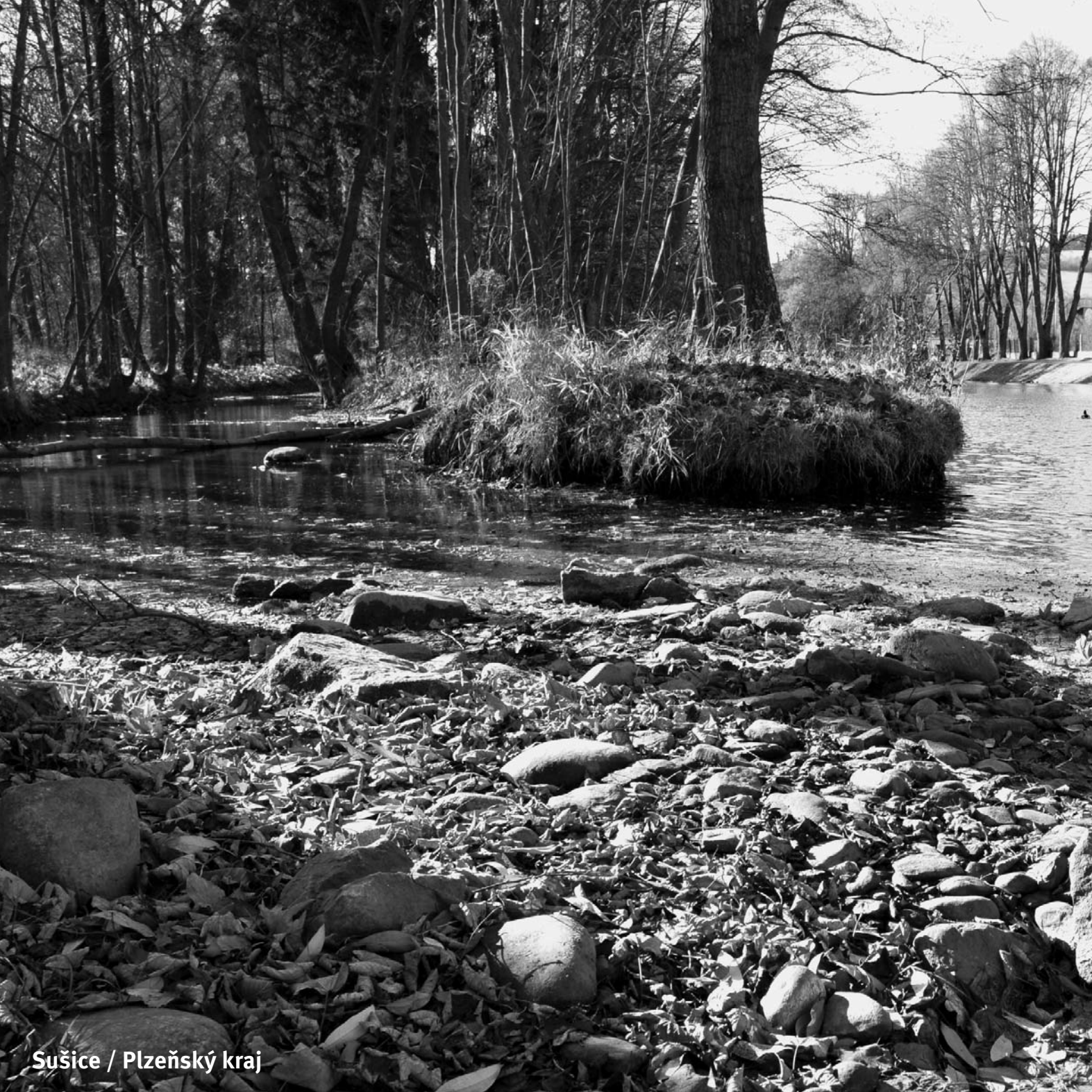
Sušice / Plzeňský kraj