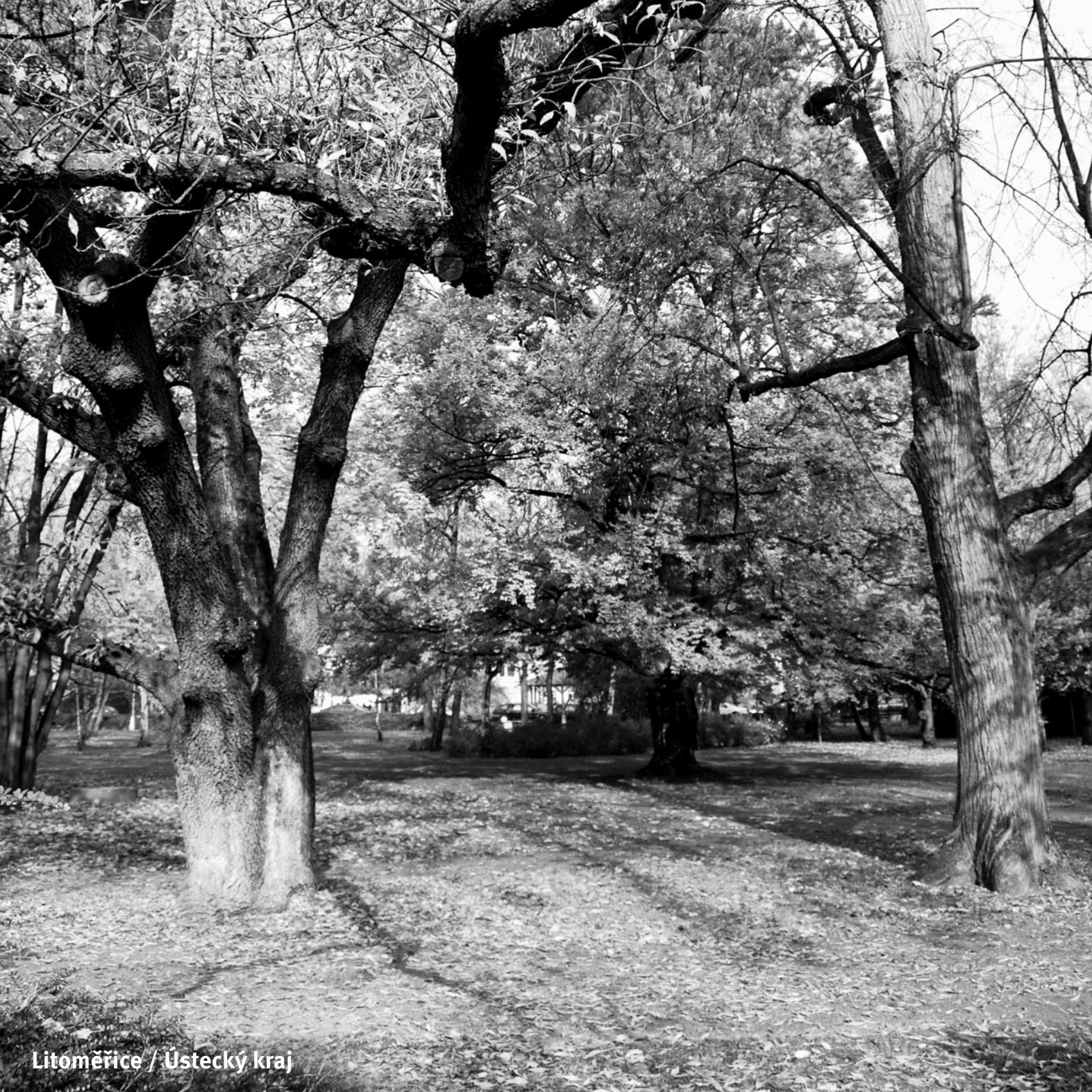
Litoměřice / Ústecký kraj