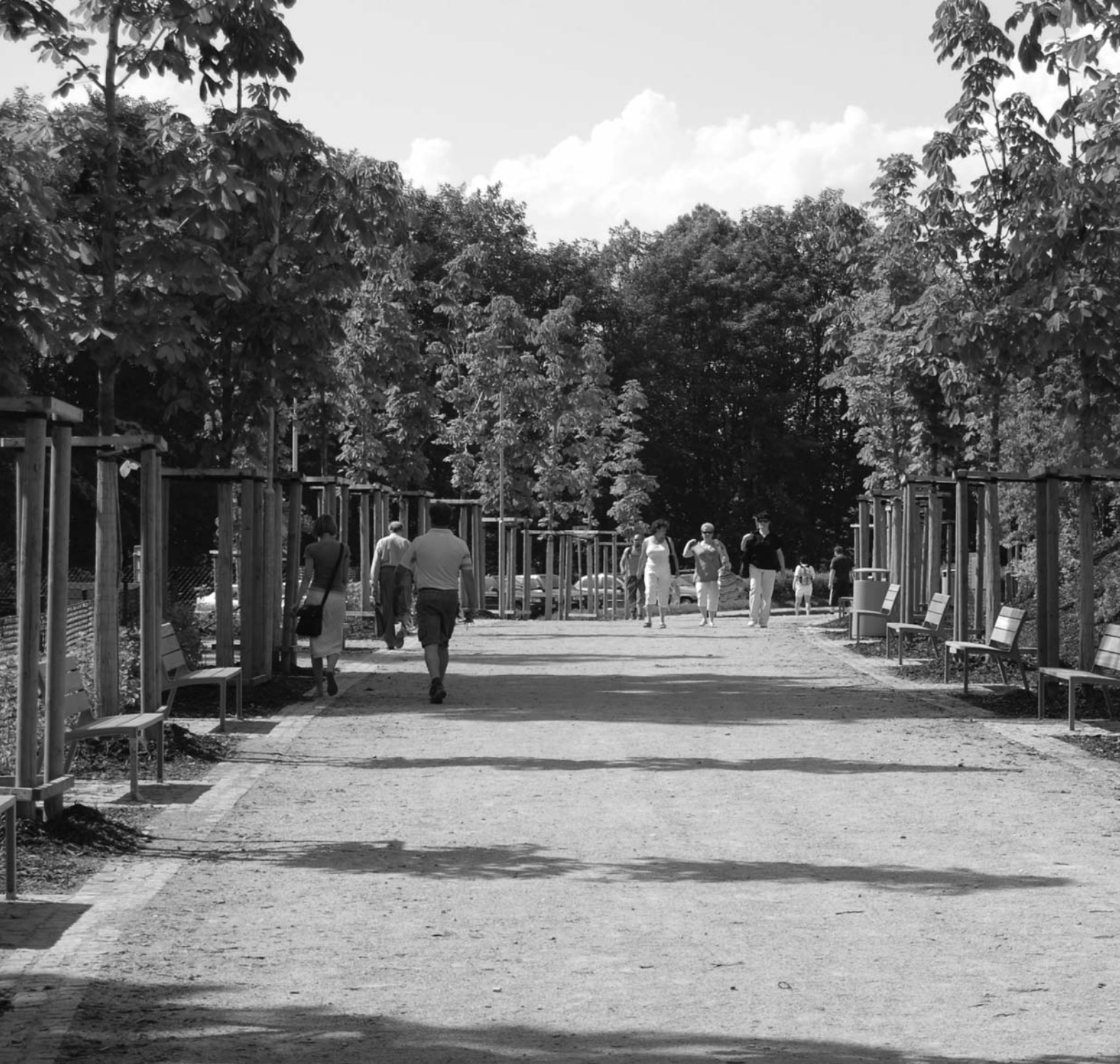
Broumov / Královéhradecký kraj