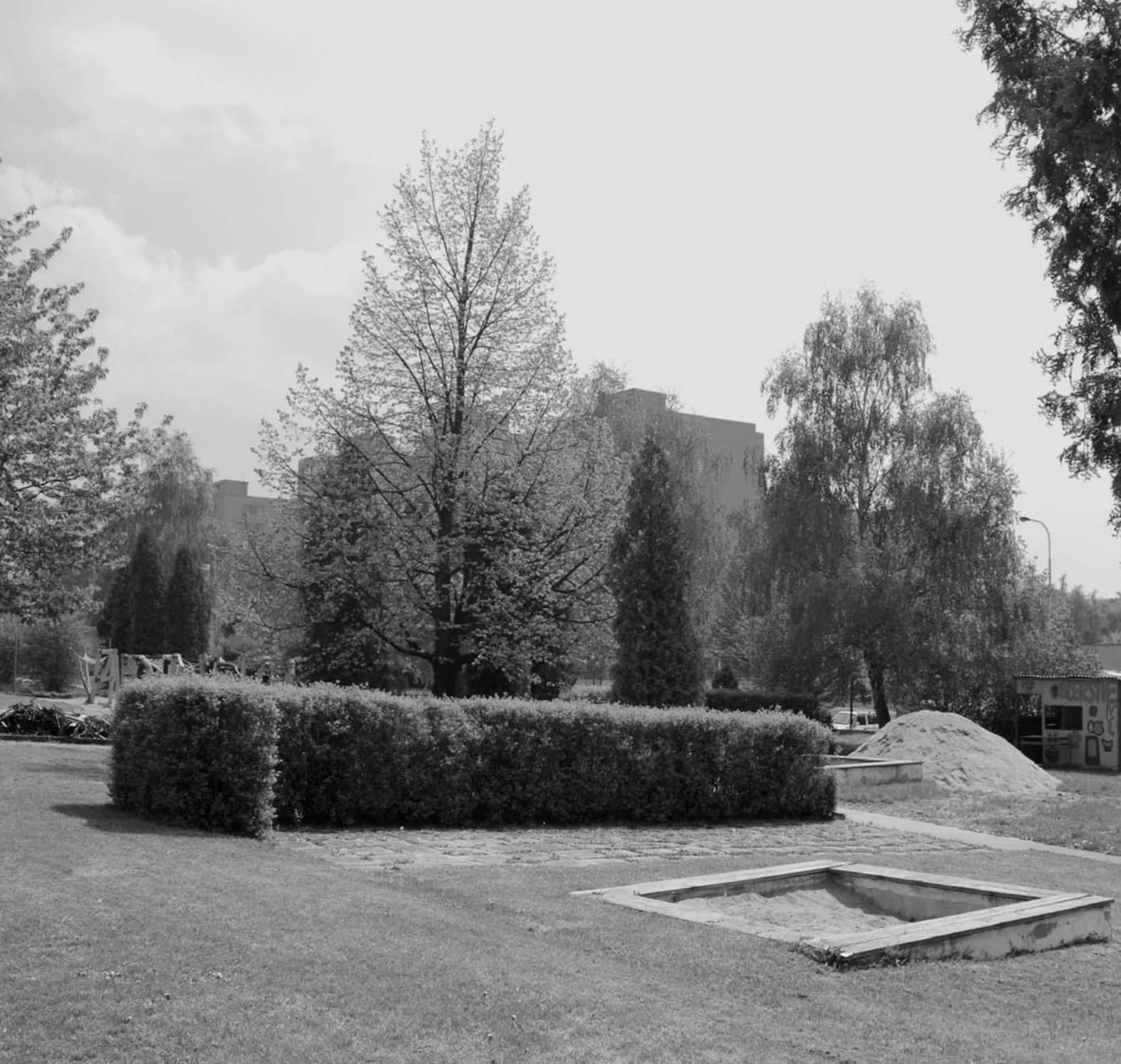
Speciální církevní škola Don Bosco / Praha 8