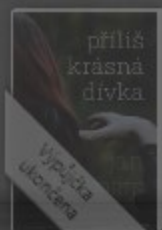
Příliš krásná dívka