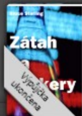
Zátah na hackery