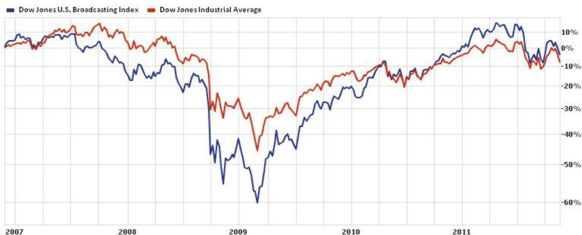
Graf 4 Dow Jones Industrial Average a Dow Jones U.S. Broad. & Entertainment Index

Je zřejmé, že index zábavního průmyslu indexu Dow Jones v době krize odepsal značnou část své hodnoty. Přesně se jednalo o 60% své původní hodnoty před pádem banky Lehman Brothers. Hodnota indexu zábavního průmyslu indexu Dow Jones byla před pádem Lehman Brothers okolo 470 bodů a po roce 2009 se hodnota ocitla až na hodnotě okolo 180 bodů.