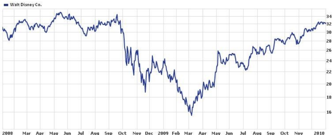
Graf 1 akcie Walt Disney Co.

V době krize, po pádu Lehman Brothers v září 2008, akcie společnosti Walt Disney Co. ztratily přes 50% své původní hodnoty.