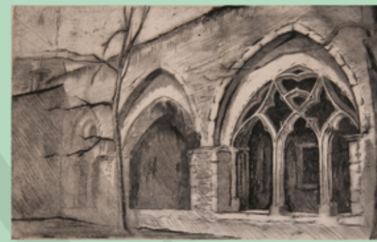
Loucký klášter, 1952, suchá jehla

Oldřich Míša zemřel následkem nemoci 21. října 2013 v anglickém Orfordu.