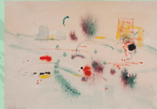
Periferie, 1964, akvarel