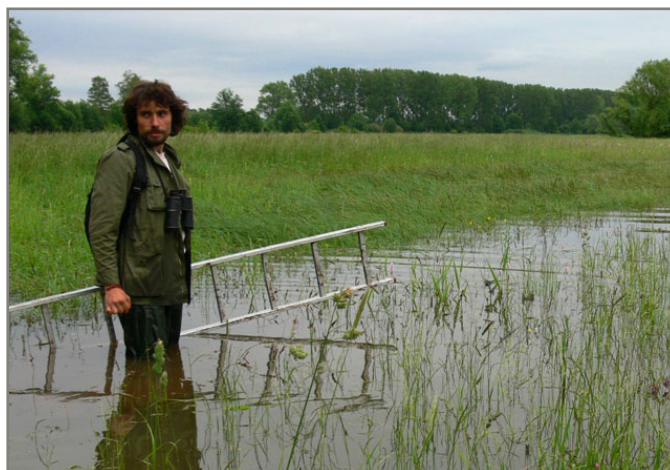
Josefovské louky jsou skutečně mokřadním prostředím.

V souvislosti se špatným rozhodnutím státního orgánu jsme se poprvé v historii obrátili na soud. Společnou žalobou s Okrašlovacím spolkem Zdíkovska jsme zabránili dalšímu drolení jádrových území výskytu tetřeva hlušce na Šumavě.