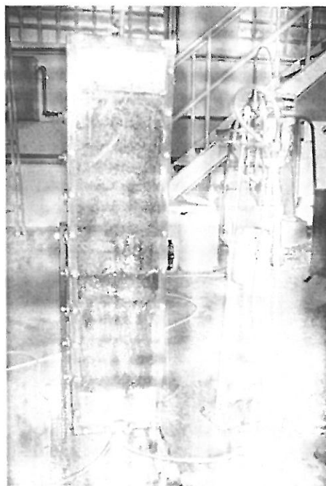
Obr. 1. Norit použitý jako sorpční bariéra v průtočné koloně naplněné pískem

Výsledky z laboratorních experimentů byly využity pro design experimentů v průtočném sorpčním kanálu nejen se simulovanou, ale i s reálnou odpadní vodou z podzemního zplyňování uhlí. Ve čtvrtprovozním průtočném kanále byly sorbenty použity jako reaktivní bariéra v průtočné koloně, ve které protékala reálná odpadní voda z UCG viz Obr. 1., Obr. 2. Zároveň byl zkoumán i vliv různých forem použitých sorbentů na jejich sorpční účinnost.