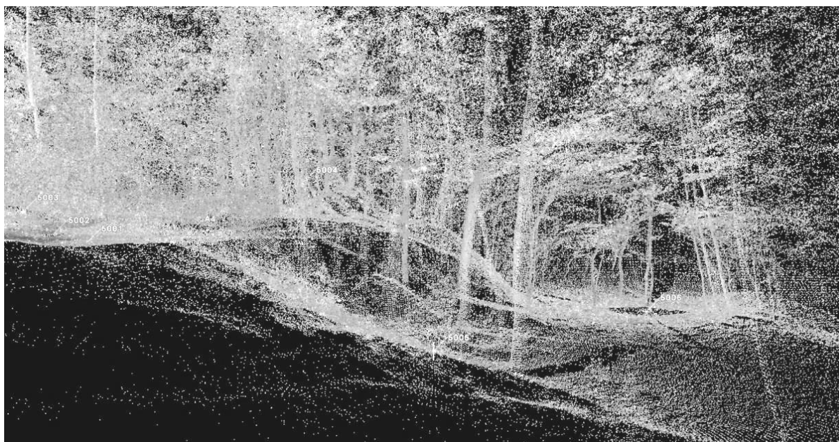
Obr. 1. Ukázka zaměřeného mračna bodů před zpracováním. Lokalita s pracovním názvem Pezinok, Slovensko.

Například při geomorfologickém výzkumu, kdy je požadovaným výstupem detailní digitální model reliéfu (DMR) se hustá vegetace stává značným problémem při zpracování naskenovaných dat. Na Obr. 1 můžeme vidět mračno bodů zaměřených na lokalitě s pracovním názvem Pezinok. Jedná se o velmi malé území (cca 70 × 70 m) s nepříliš složitým reliéfem, avšak s velmi hustou vegetací tvořenou vysokými trávami, keři, popínavými rostlinami a stromy.