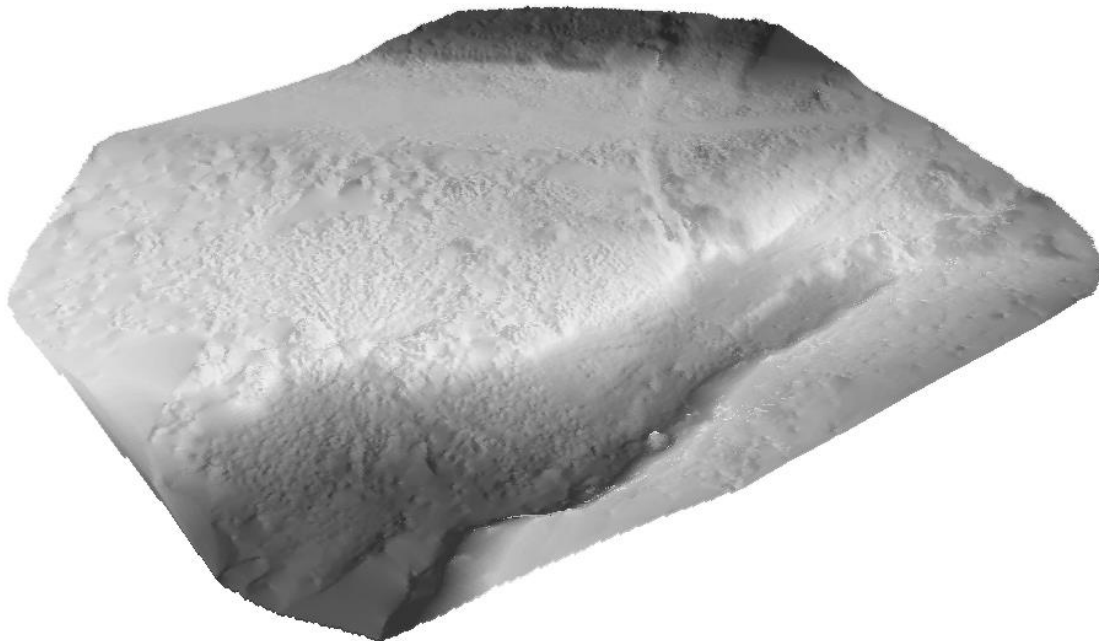
Obr. 4: Výsledný digitální model reliéfu - celkový pohled na lokalitu s pracovním názvem Pezinok, Slovensko.

Nejefektivnější využití laserového skeneru v rámci fyzickogeografického výzkumu (Tab. 2) proto spatřujeme v pořízení digitálního modelu lokálních tvarů reliéfu se sporadickou vegetací (např. sesuv, mrazový srub, erozní rýha apod.) a v pořizování profilů. Výhodou při generování profilů je jejich okamžitá dostupnost přímo z naměřeného mračna bodů. Navíc vedle výběru konkrétního profilu je možné na zvolené linii automaticky vytvořit příčné profily v pravidelné vzdálenosti. Z jednotlivých profilů se také mnohem lépe a rychleji odstraňuje vegetace nebo se může i ponechat pro potřeby srovnání časového vývoje lokality (monitoring odplavení mrtvého dřeva, sledování sukcese aj.).