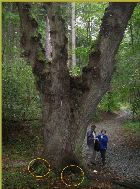
Hraniční dub v Kamenných Vratech do kořene stromu jsou vrostlé různé staré hraniční kameny

v nejzápadnějším cípu katastru někdejšího královského horního města Jílového, poblíž osady Kamenná Vrata, byl vysazen hraniční dub letní. Jeho stáří se odhaduje na tři sta let. Je to jeden z mála pozůstatků historických dělení hranic v okolí.