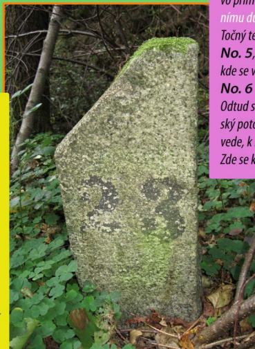
Jeden z mladších hraničních kamenů na rozhraní katastrálních obcí Libeň x Petrov

DALŠÍ: starý pařež dubový jmenovaný panským cejchem; hromada kamení mechem porostlá