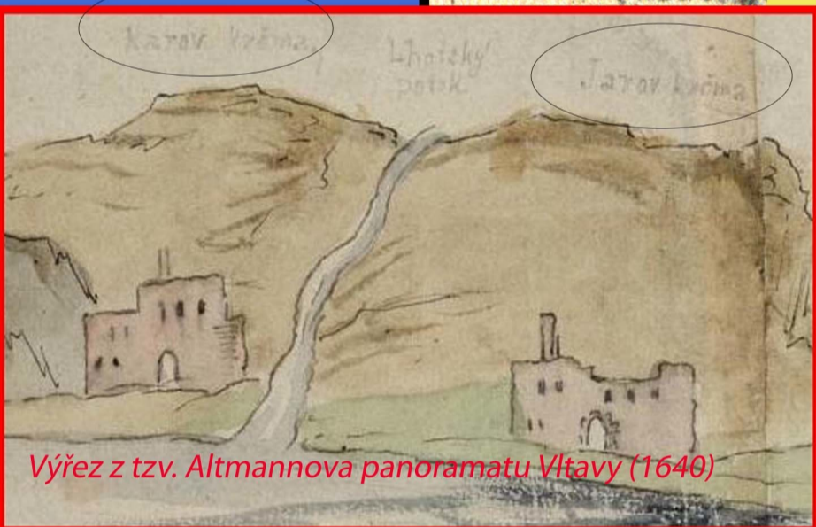
Výřez z tzv. Altmannova panoramatu Vltavy (1640)