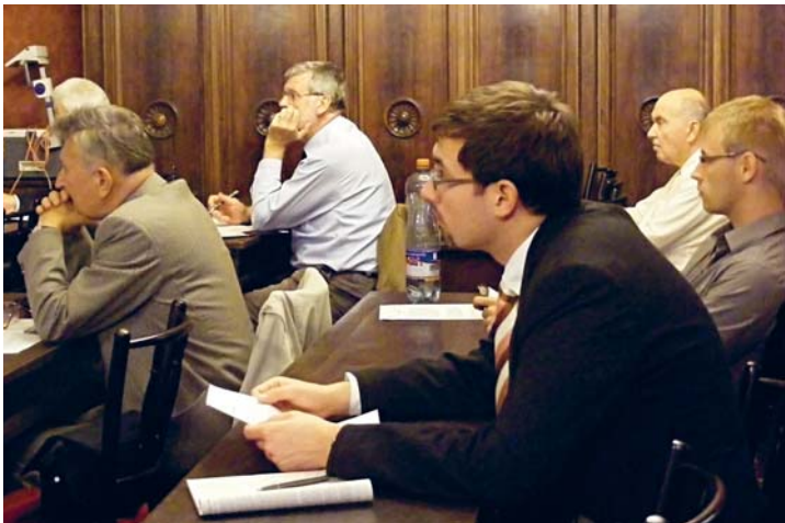
Účastníci Evropského klubu I.