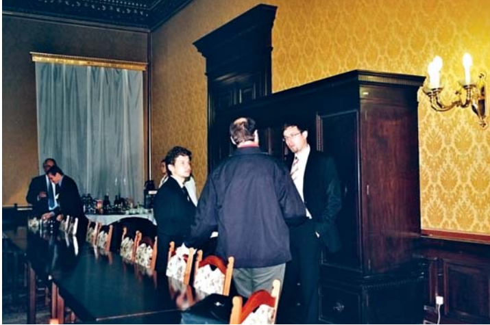
Účastníci Evropského klubu I. na recepci