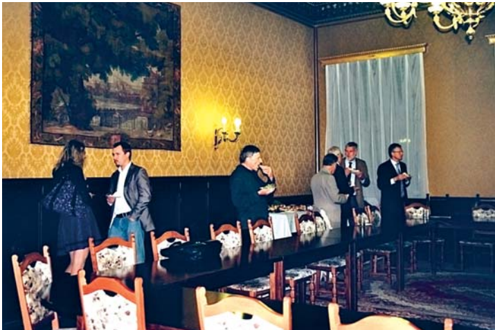
Účastníci Evropského klubu I. na recepci