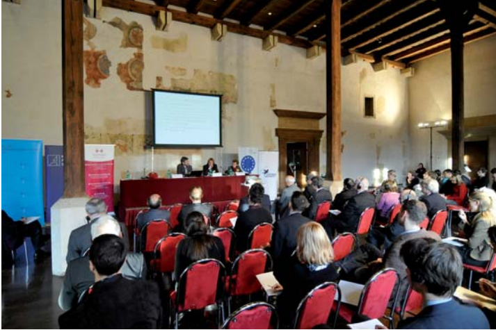
Velký sál Novoměstské radnice v Praze, kde se konala konference Evropa občanů – Evropa voličů