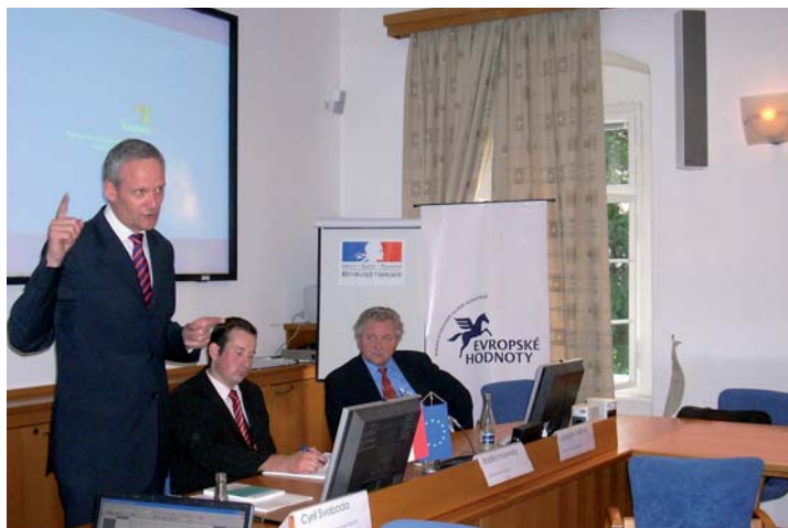
Úvodní diskuse workshopu „Politický marketing pro volby do Evropského parlamentu“. Ministr Cyril Svoboda, předseda Evropských hodnot Radko Hokovský, europoslanec Jaroslav Zvěřina