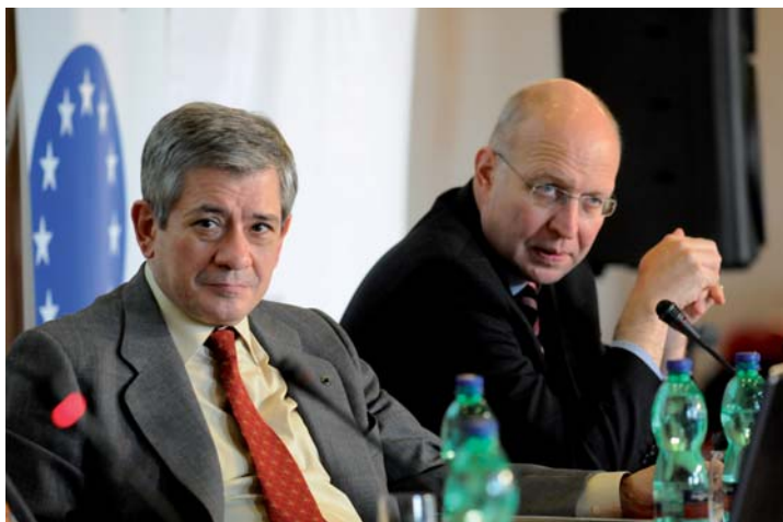
Politický panel: bývalý předseda Evropského parlamentu Enrique Barón Crespo a lídr britských liberálů v EP Andrew Duff