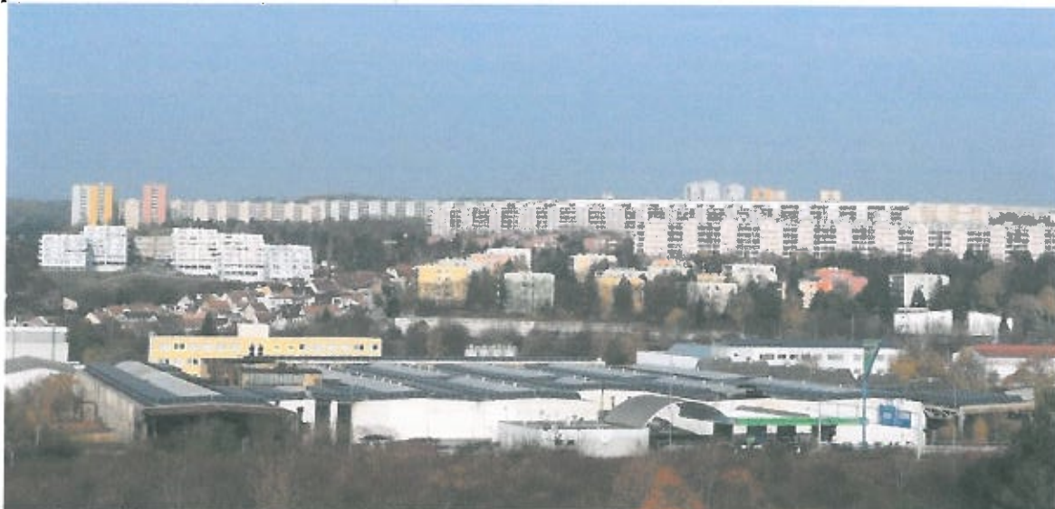
Obr. 5: Příklad solární elektrárny umístěné na střechách budov z městské části Brno-sever (v pozadí Divišova čtvrť a sídliště Lesná)