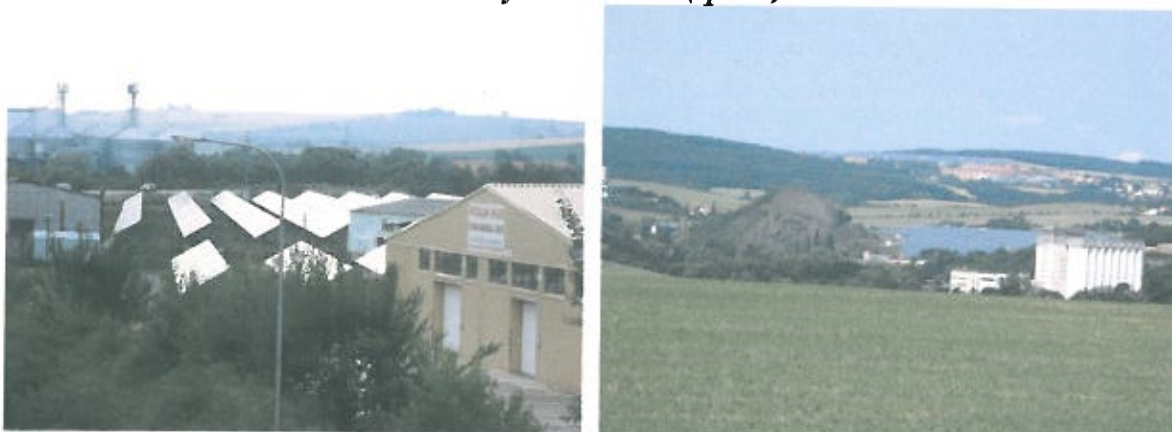
Obr. 1 a 2: Solární elektrárna v lokalitě bývalého cukrovaru ve Slavkově (vlevo) a solární elektrárna na místě částečně odtěžené haldy v Oslavanech (vpravo)