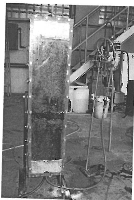
Obr. 1. Norit použitý jako sorpční bariéra v průtočné koloně naplněné pískem