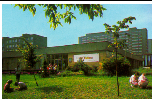
Nová síň, Mongolská 2, Ostrava - Poruba

Hlavní úsilí galerie bylo v roce 2005 zaměřeno tradičně na zlepšení péče o sbírkový fond, spolupráci na přípravě projektové dokumentace pro rekonstrukci objektu Poděbradova, který byl definitivně včetně pozemků převzat do majetku Ms kraje a dán do správy GVUO, na revitalizaci odborné knihovny GVUO. Stěžejními výstavními akcemi byly: Superstart in Ostrava - Kamera Skura & Kunst-Fu, Karel Haruda – Rapsodická cesta k malbě (k 80. narozeninám autora) a Signal box (projekt v rámci česko-polské kooperace). Usilujeme o neustálé zlepšování práce s veřejností. Sledovali jsme pozoruhodné výtvarné regionální aktivity a život uměleckých škol na Ostravsku. Úkol kulturní reprezentace kraje resp. Města splnila galerie jednak zahraničními výstavami (Polsko, Francie) a výstavami v zahraničí a v jiných krajích (Polsko, Vysočina – společná záštita obou hejtmanů). Velká pozornost, včetně prezentace podílu státu na záchraně kulturního dědictví ve sbírkách GVUO, byla věnována problematice restaurování.