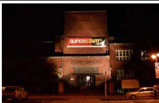
Dům umění, Jurečkova 9, Moravská Ostrava

Sídlem galerie je památkově chráněný objekt Domu umění, významná část aktivit je soustředěna i do objektu Nová síň v Ostravě - Porubě. GVUO je členem profesního sdružení Rada galerií České republiky.