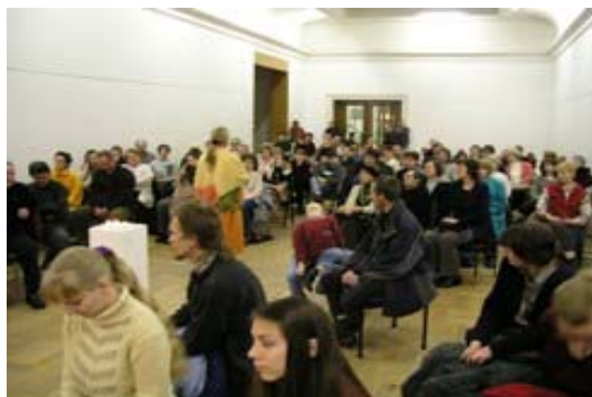
Galerie výtvarného umění v Ostravě, příspěvková organizace. Záběr z akce v Domě umění

Hlavní úsilí galerie bylo v roce 2005 zaměřeno tradičně na zlepšení péče o sbírkový fond, spolupráci na přípravě projektové dokumentace pro rekonstrukci objektu Poděbradova, který byl definitivně včetně pozemků převzat do majetku Ms kraje a dán do správy GVUO, na revitalizaci odborné knihovny GVUO. Stěžejními výstavními akcemi byly: Superstart in Ostrava - Kamera Skura & Kunst-Fu, Karel Haruda – Rapsodická cesta k malbě (k 80. narozeninám autora) a Signal box (projekt v rámci česko-polské kooperace). Usilujeme o neustálé zlepšování práce s veřejností. Sledovali jsme pozoruhodné výtvarné regionální aktivity a život uměleckých škol na Ostravsku. Úkol kulturní reprezentace kraje resp. Města splnila galerie jednak zahraničními výstavami (Polsko, Francie) a výstavami v zahraničí a v jiných krajích (Polsko, Vysočina – společná záštita obou hejtmanů). Velká pozornost, včetně prezentace podílu státu na záchraně kulturního dědictví ve sbírkách GVUO, byla věnována problematice restaurování.