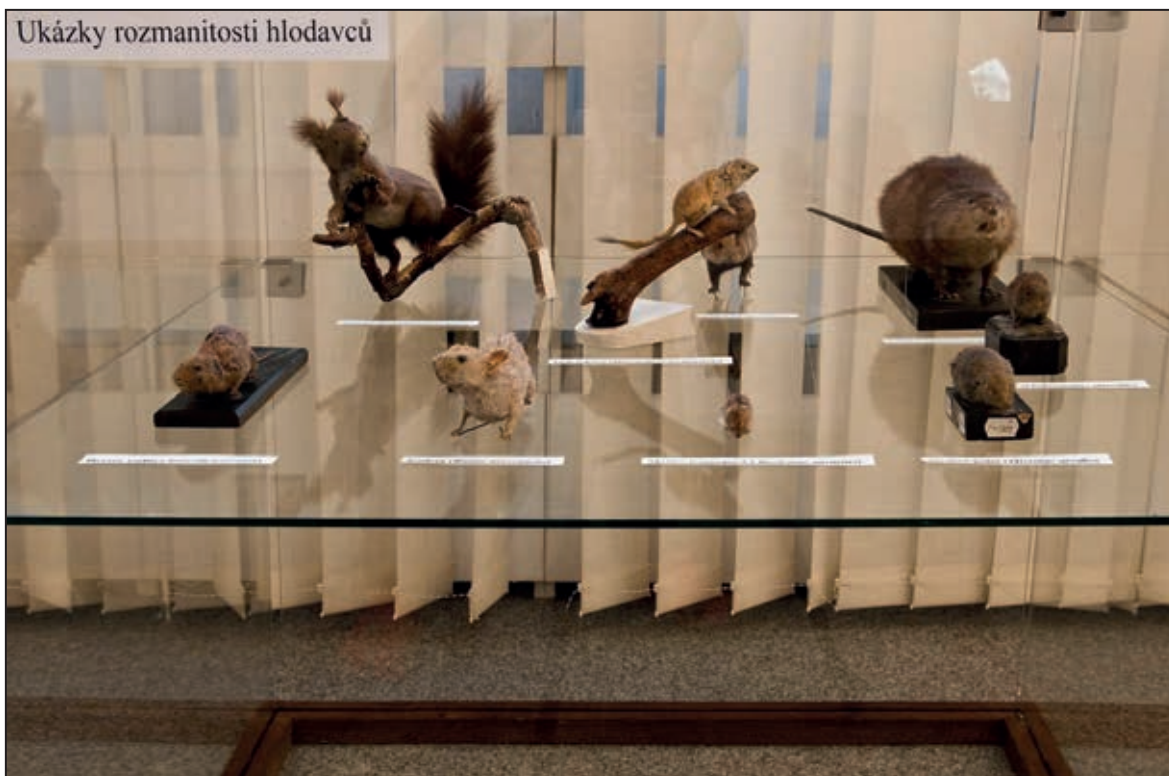
Výstava Neznámý svět drobných savců (únor 2011)