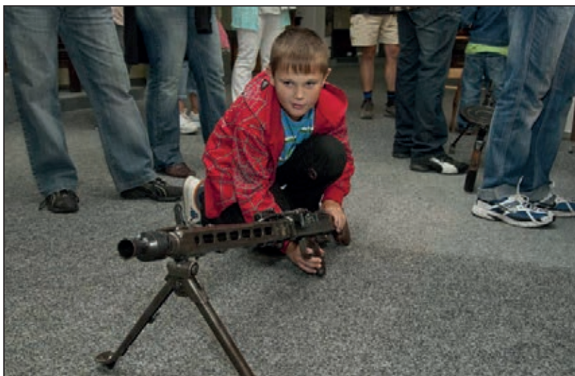
Dny Evropského kulturního dědictví – EHD (září 2011)