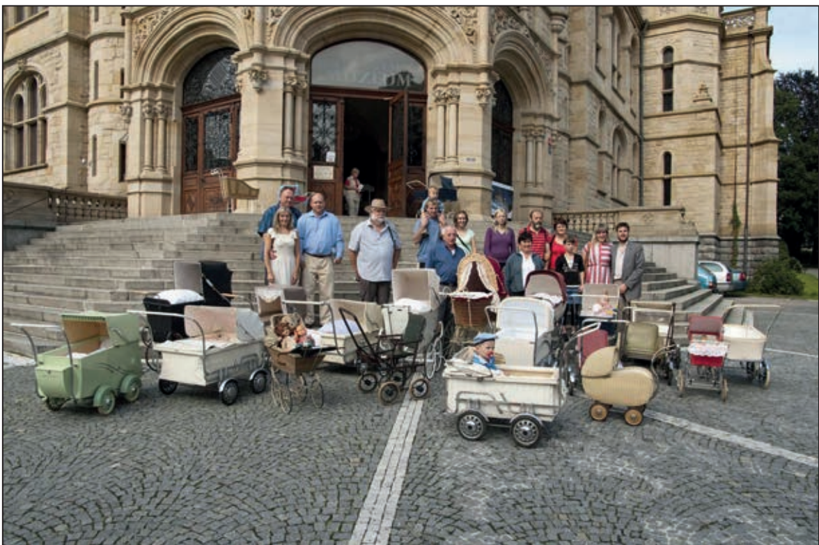
Přehlídka historických kočárků před budovou muzea – akce Kočárkový veterán (srpen 2011)