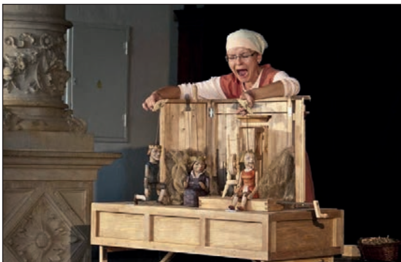
Divadelní představení Tři přadleny (září 2011)