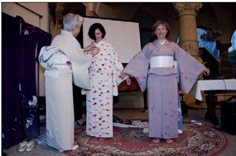
Podzim s Japonskou kulturou v SM (září 2011)