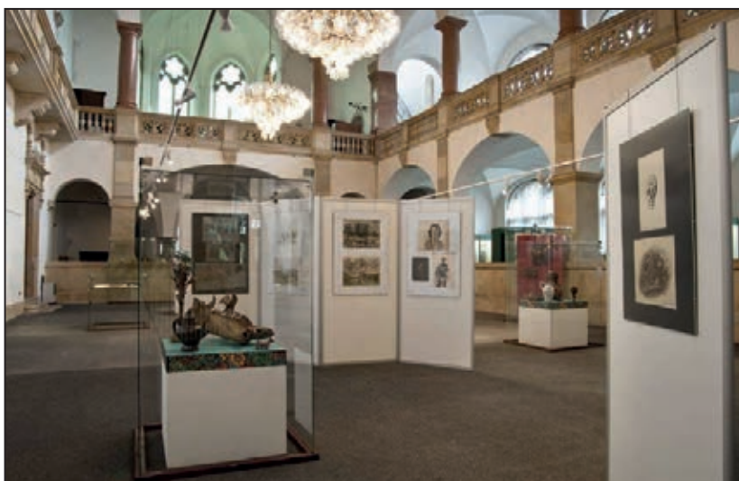
Záběr z výstavy (Ne)praktický kabinet Jiřího Wintera (září 2011)