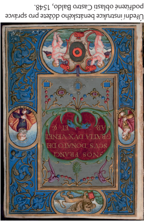
Uřední instrukce benediktína dožitého pro správu podřízené oblasti Castro Baldo, 1548.