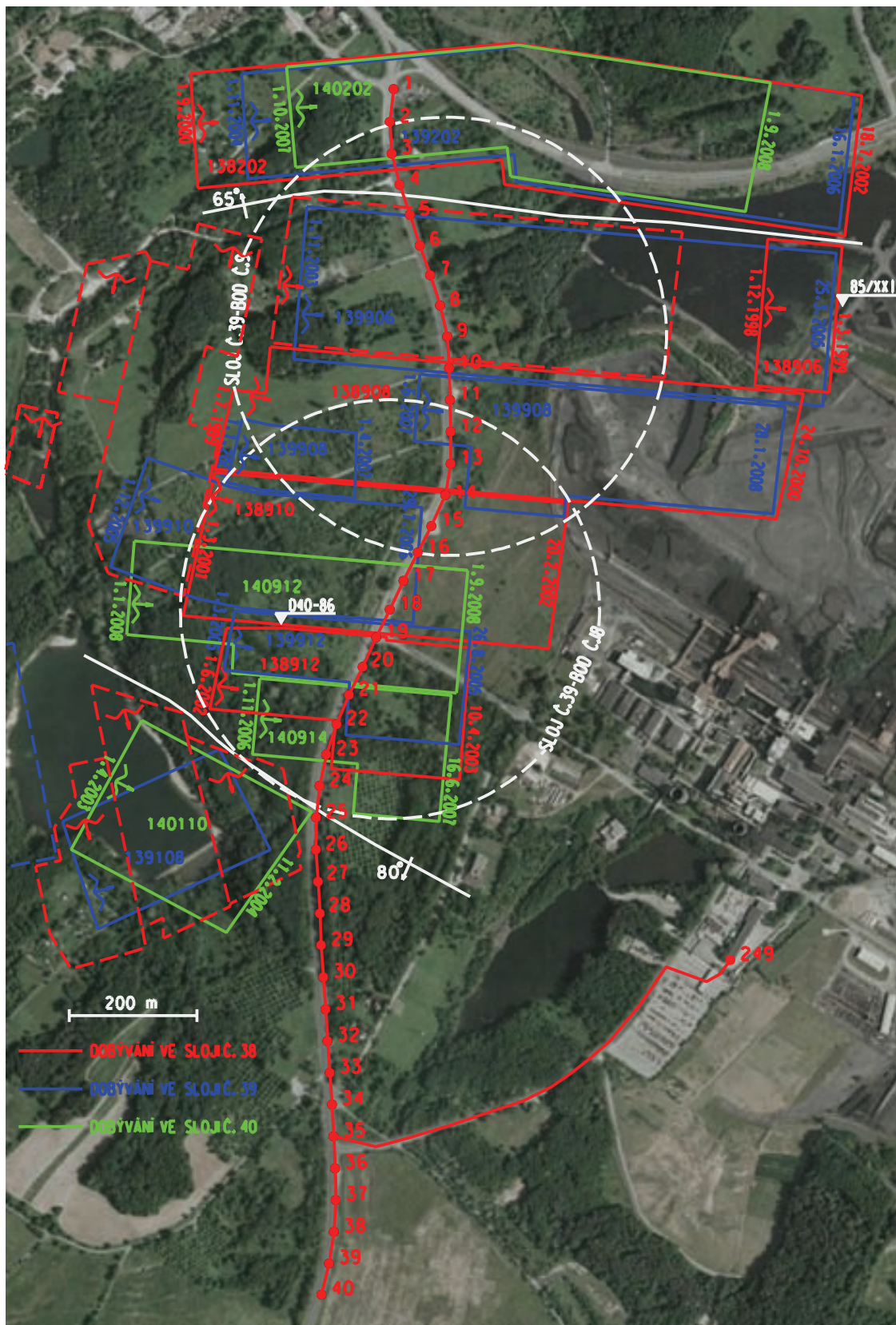
Obr. 1. Měřická přímka a přípojovací pořad lokality Lazý se zobrazením dobývání v 38., 39. a 40. sloji, podkladová data (c) ČÚZK