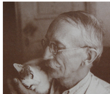
Bohuslav Reynek v polovině 50. let

Samota byla pro něho nutnost, většinou ho netížila, na rozdíl od často nepřiměřené společnosti lidí. Vítanými hosty jeho samoty byla naopak zvířata. To už jsou ale věci dostatečně známé.