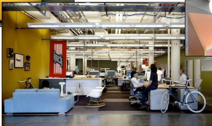
Facebook, Sao Paulo